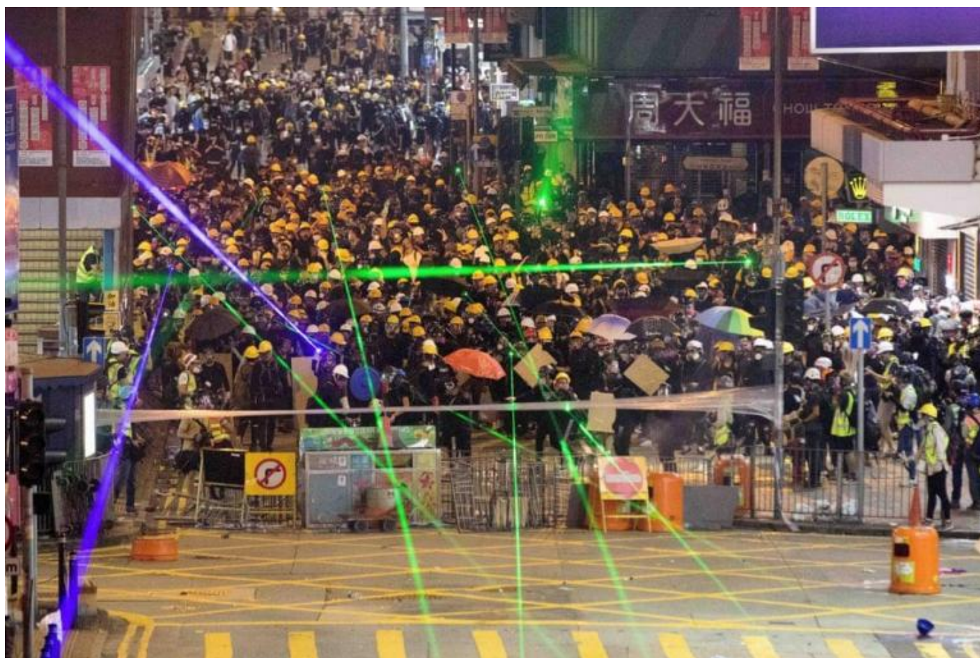
Hong Kong, Photograph: Kevin On Man Lee/Penta Press/REX/Shutterstock.

Da domenica 9 giugno, Hong Kong è diventata teatro di scontri tra le forze governative e gli attivisti pro-democrazia che protestano contro un disegno di legge che faciliterebbe l'estradizione in Cina di cittadini accusati di reati gravi. La popolazione, preoccupata per le conseguenze che la legge avrebbe sul delicato equilibrio politico del paese, ha cominciato a manifestare pacificamente, in un crescendo di tensione e di scontri sempre più duri. Durante le manifestazioni, gli attivisti hanno invitato i partecipanti a utilizzare mascherine per coprirsi il volto e occhiali per rendersi irriconoscibili dalle forze di polizia e hanno chiesto ai reporter di non scattare immagini che potessero aiutare a identificare chi protesta. Le immagini dei civili che fronteggiano i poliziotti a colpi di puntatori laser, cercando di “accecare” i sistemi di riconoscimento facciale e di impedire agli agenti di mirare, hanno fatto il giro del mondo, segnando un cambio di passo nella pratica dei conflitti sociali.