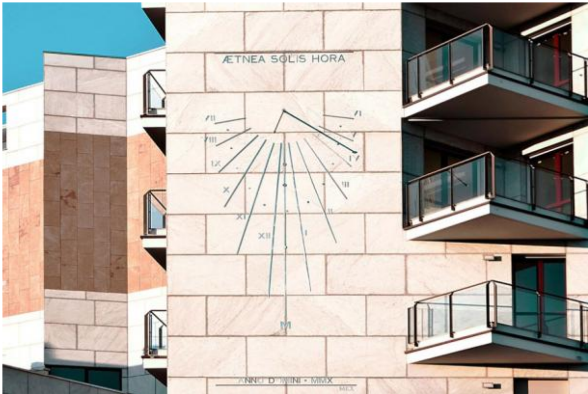
Studio Ticozzi, Residenze a Porta Vittoria, Milano.

Se continuiamo a tenere vivo questo spazio è grazie a te. Anche un solo euro per noi significa molto. Torna presto a leggerci e SOSTIENI DOPPIOZERO