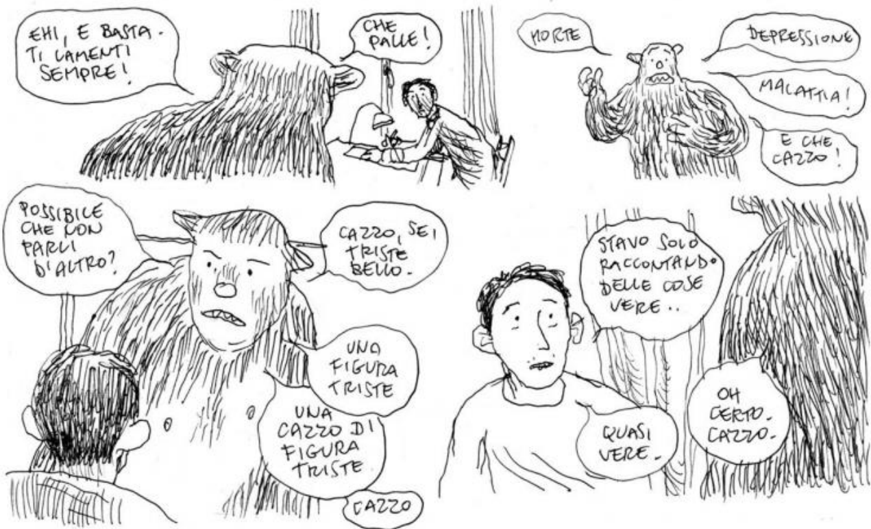
Una scena da "La mia vita disegnata male" (2008).

In altri libri di Gipi questo ruolo dissacratorio è svolto da personaggi usciti direttamente dalla fantasia del narratore. Per esempio in La mia vita disegnata male è una specie di orso a impedire al fumettista di cedere troppo all'autocommiserazione: "E basta. Ti lamenti sempre!", gli dice.