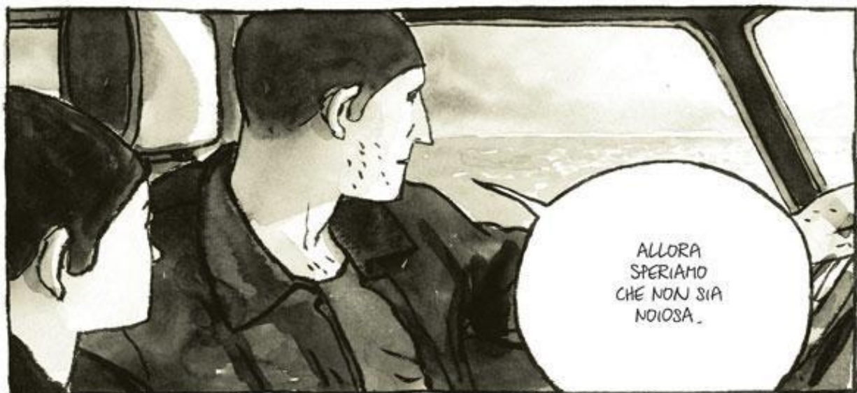
Una tavola da "Gli innocenti" (2005).