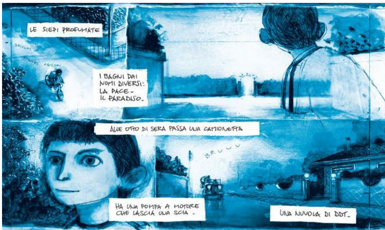
Una scena dal racconto "Via degli Oleandri" (2003).

Qualcosa di molto simile succede nel nuovo fumetto di Gipi, Momenti straordinari con applausi finti (sempre per Coconino Press). A un certo punto del libro appare un bambino luminoso. Spunta di notte, in un bosco, quasi come in un incontro ravvicinato del terzo tipo. È il protagonista da ragazzino e sembra essere lì per ricordargli quello che sta succedendo - "Mamma sta morendo" - e costringerlo a fare i conti con questa realtà, invece di perdersi e distrarsi in altri pensieri, invece di fuggire.