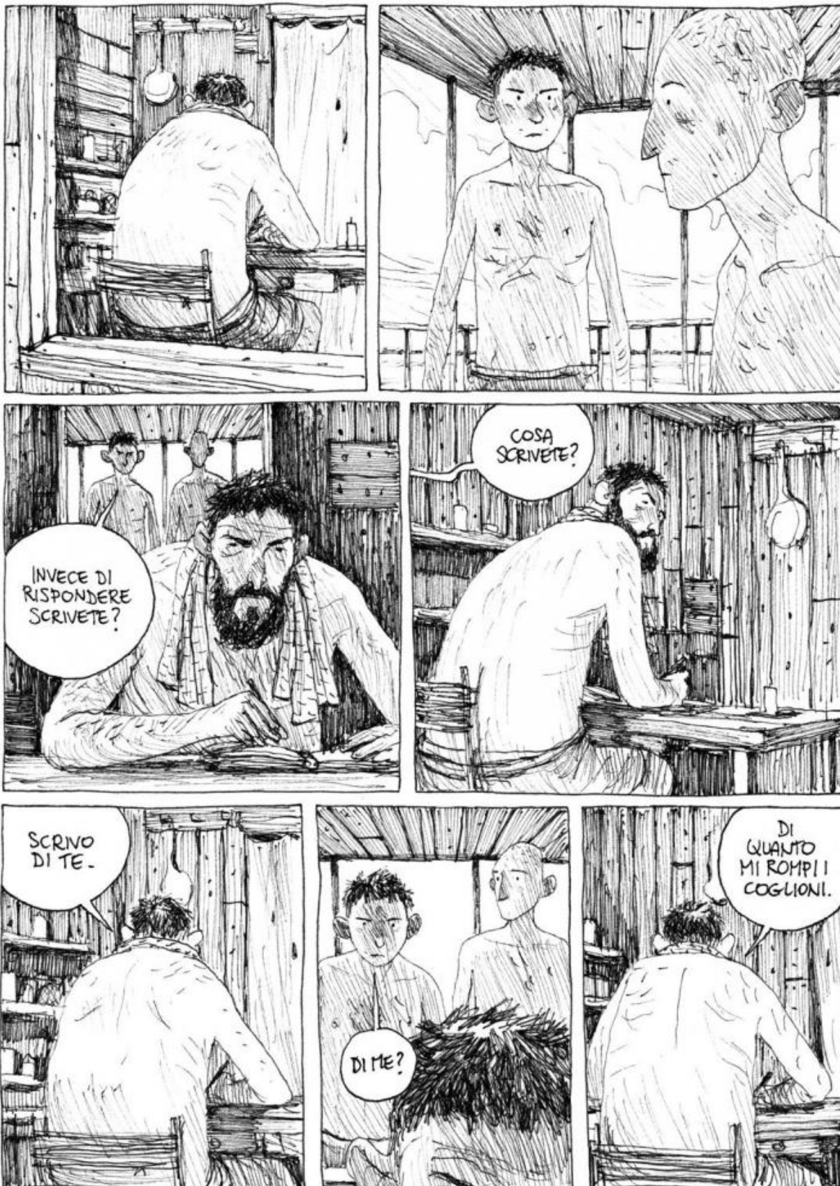
Una tavola da "La terra dei figli" (2016).