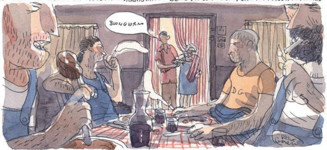
Una scena da "S." (2006).

UN GIORNO LA PORTO A MANGIARE AL CIRCOLO DELLA SAINT GOBAIN, LA FABBRICA DI MATERIALI VETROSI CHE ERA STATA OBIETTIVO DEL BOMBARDAMENTO, NEL 1943 - E' UN CASO - E' SOLO CHE FANNO DA MANGIARE ABBASTANZA BENE. CI SONO GLI OPERAI. SI MANGIA IN FRETTA.