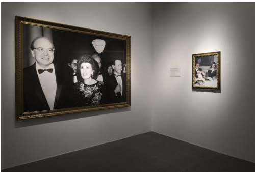
Francesco Vezzoli, "Party politics" (2019).

Ma nel frattempo non c'è stato leader forte dell'ultimo ventennio che non abbia pensato agli aspetti peggiori di quella lezione. Berlusconi l'ha detto due o tre volte: "Non farò la fine di Craxi". Là dove questa fine era da intendersi come una specie di gorgo profondo e oscuro che risucchiava insaziabile il Super Colpevole da spedire nel deserto carico dei peccati di tutti in tal modo dando sfogo all'angoscia collettiva secondo il rito crudele del capro espiatorio.