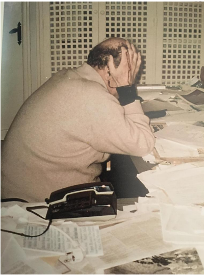
L'ultima foto: il fax è muto.

Era forse inevitabile per un ex leader che ai tempi fu paragonato al dantesco gigante Capaneo mostrando di tenere “in gran dispitto”, come Farinata, il suo stesso inferno. Fatto sta che Craxi ha passato gli ultimi anni della sua vita a difendersi, diceva lui, comunque a correggere meticolosamente con chilometrici fax qualsiasi notizia che lo riguardasse e ad agitarsi, accusare, minacciare. Aveva un sacco di tempo e più di ogni altro sapeva che la peggior pena per lui era l'oblio. Così non ne lasciava passare una, ogni anno pubblicava la raccolta dei suoi scritti, rispondeva di persona a Mario Appignani “Cavallo Pazzo” e a Edoardo Agnelli, scrisse sotto falso nome anche romanzi pseudo-cavallereschi “a chiave” e gialli dietrologici; prese a raccogliere notizie imbarazzanti su chi detestava, anche grazie a un giro di specialisti; coltivò i più vari propositi di rivalsa nei riguardi degli ex compagni di partito; insomma continuò a darci dentro con una guerra ormai così personale da sembrare misera e miniaturizzata rispetto alla sua statura.