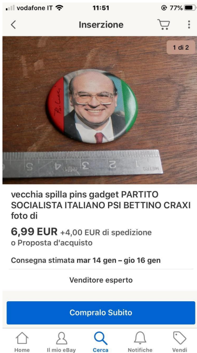
Vecchia spilla su ebay.