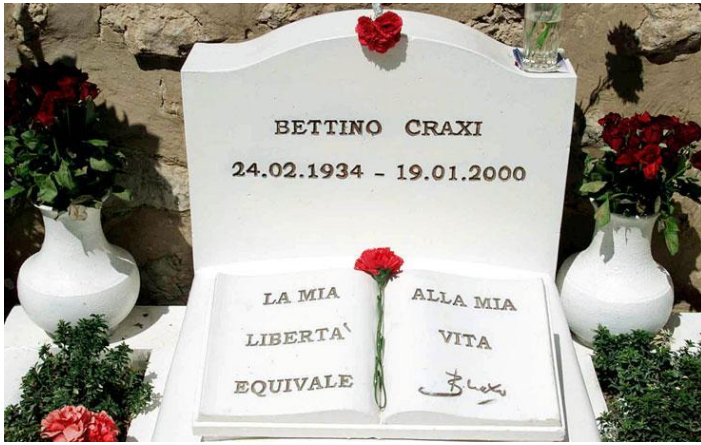
La tomba di Craxi a Hammamet.