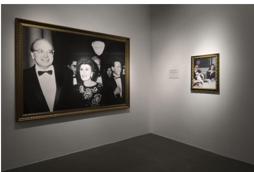
Francesco Vezzoli, “Party politics” (2019).