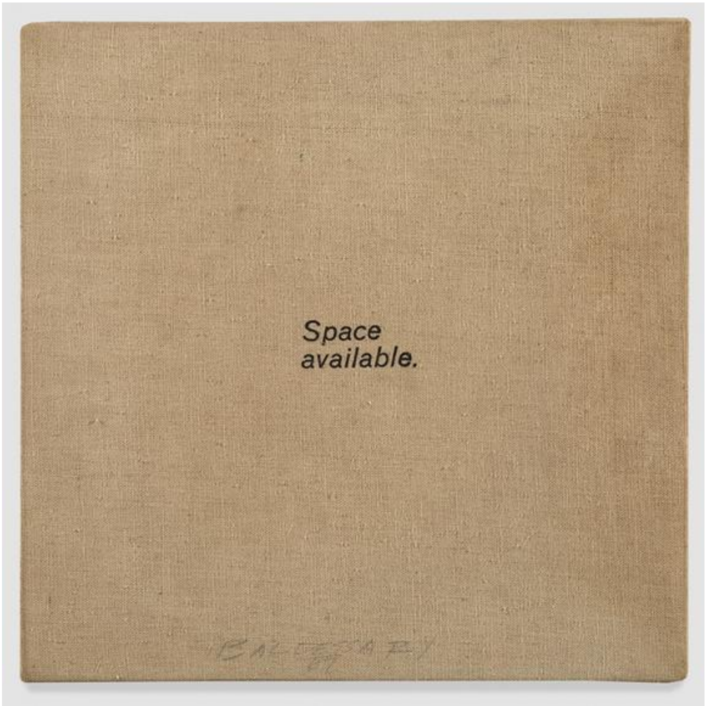
Space available, 1966-67.

Per questa ragione valicare la porta del suo studio, scavalcando la troupe che ne ostacola l'accesso, è un gesto ambiguo aperto a diverse letture. Secondo la più evidente, l'artista ripara in uno spazio domestico, quello del suo studio, estromettendo il mondo del cinema. Del resto uno dei migliori complimenti che abbia mai ricevuto è: "quello che mi piace della tua arte è quanto lasci fuori". Tuttavia basta poco per sospettare che in realtà, scavalcando i fili delle luci e le apparecchiature del set cinematografico e varcando la soglia di casa, Baldessari penetri in una sala cinematografica. O forse entra all'interno del film, passando da una parte all'altra dello schermo. Come se il suo atelier diventi il set di un film di cui ignora il copione, allestito nei minimi dettagli in attesa del suo arrivo.