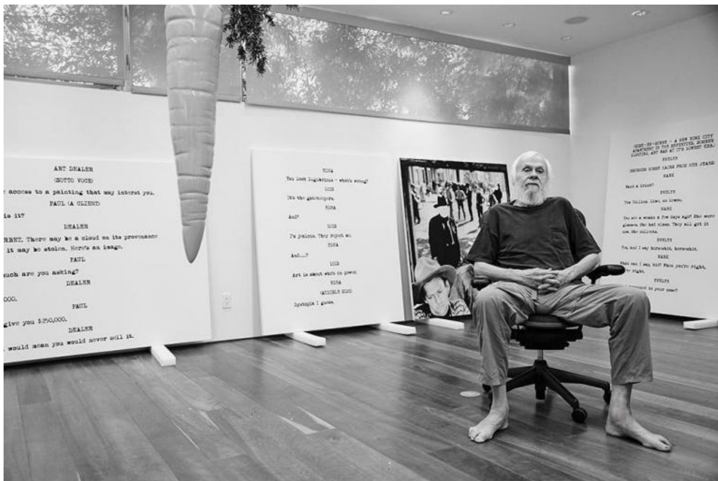
John Baldessari, 2015