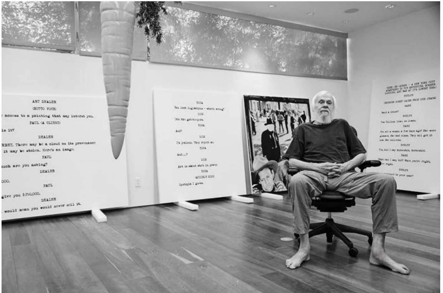
John Baldessari, 2015