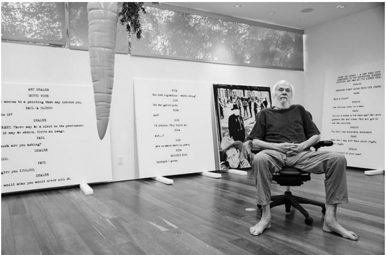
John Baldessari, 2015, courtesy Manfredi Gioacchini.

Il cinema allontana Baldessari dalla nozione d'immagine, filtrata dalla pittura modernista. Come riconosce in un'intervista del 1999, "All'improvviso ho iniziato a vedere la pittura in serie nei musei come singole immagini di una sequenza cinematografica. Immaginavo quale immagine dovesse venire prima di un dipinto di Van Gogh e quale dopo. Pensavo a come l'immagine sarebbe apparsa attraverso un grandangolo. All'improvviso ho visto la pittura attraverso categorie filmiche. E mi sono convinto che un'immagine individuale sia troppo emblematica per la verità. Un'immagine individuale vuol sempre dire: le cose stanno così". Al contrario, varcando la porta del suo atelier quella mattina dei primi anni settanta, Baldessari capisce che le cose non stanno sempre così.