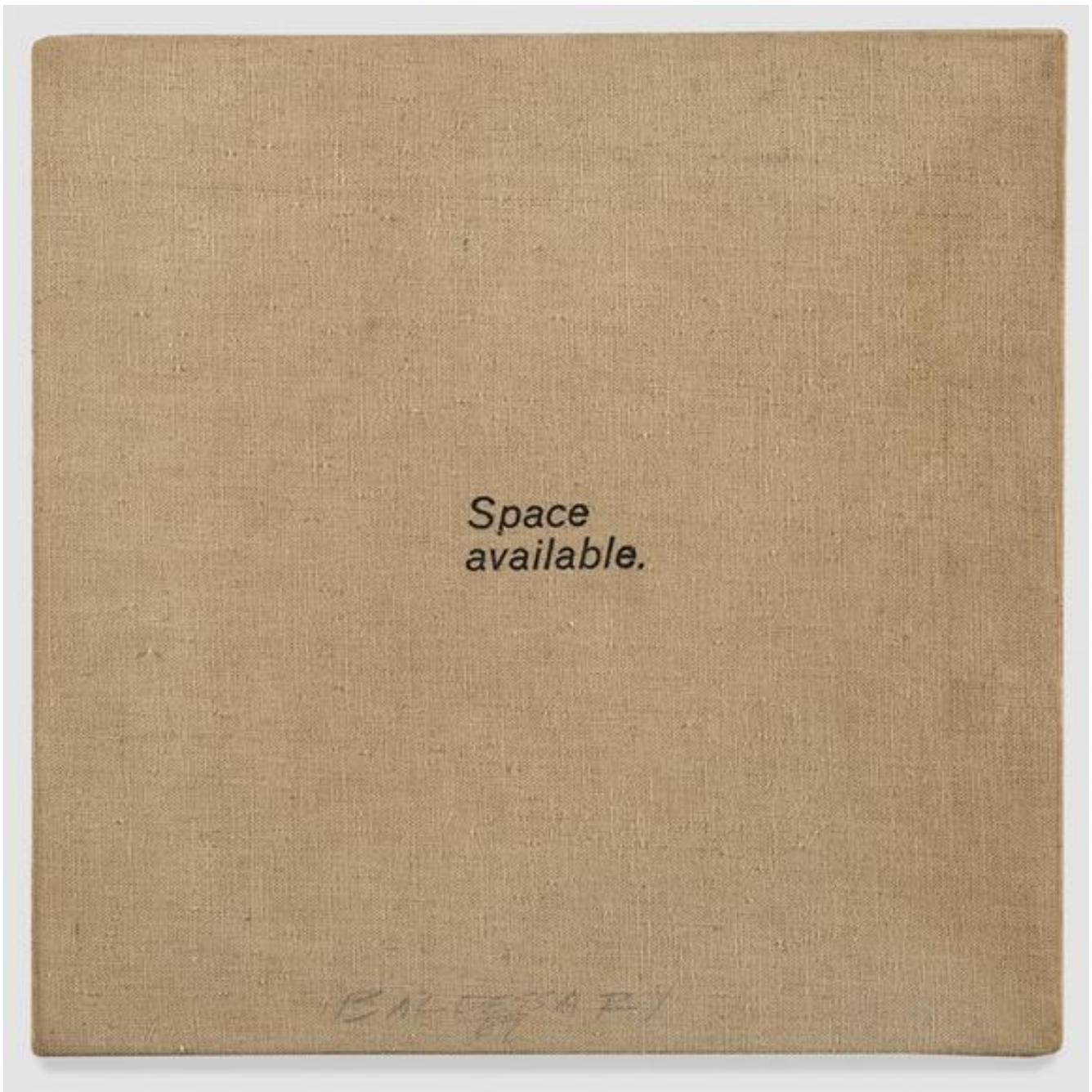
Space available, 1966-67.

Per questa ragione valicare la porta del suo studio, scavalcando la troupe che ne ostacola l'accesso, è un gesto ambiguo aperto a diverse letture. Secondo la più evidente, l'artista ripara in uno spazio domestico, quello del suo studio, estromettendo il mondo del cinema. Del resto uno dei migliori complimenti che abbia mai ricevuto è: "quello che mi piace della tua arte è quanto lasci fuori". Tuttavia basta poco per sospettare che in realtà, scavalcando i fili delle luci e le apparecchiature del set cinematografico e varcando la soglia di casa, Baldessari