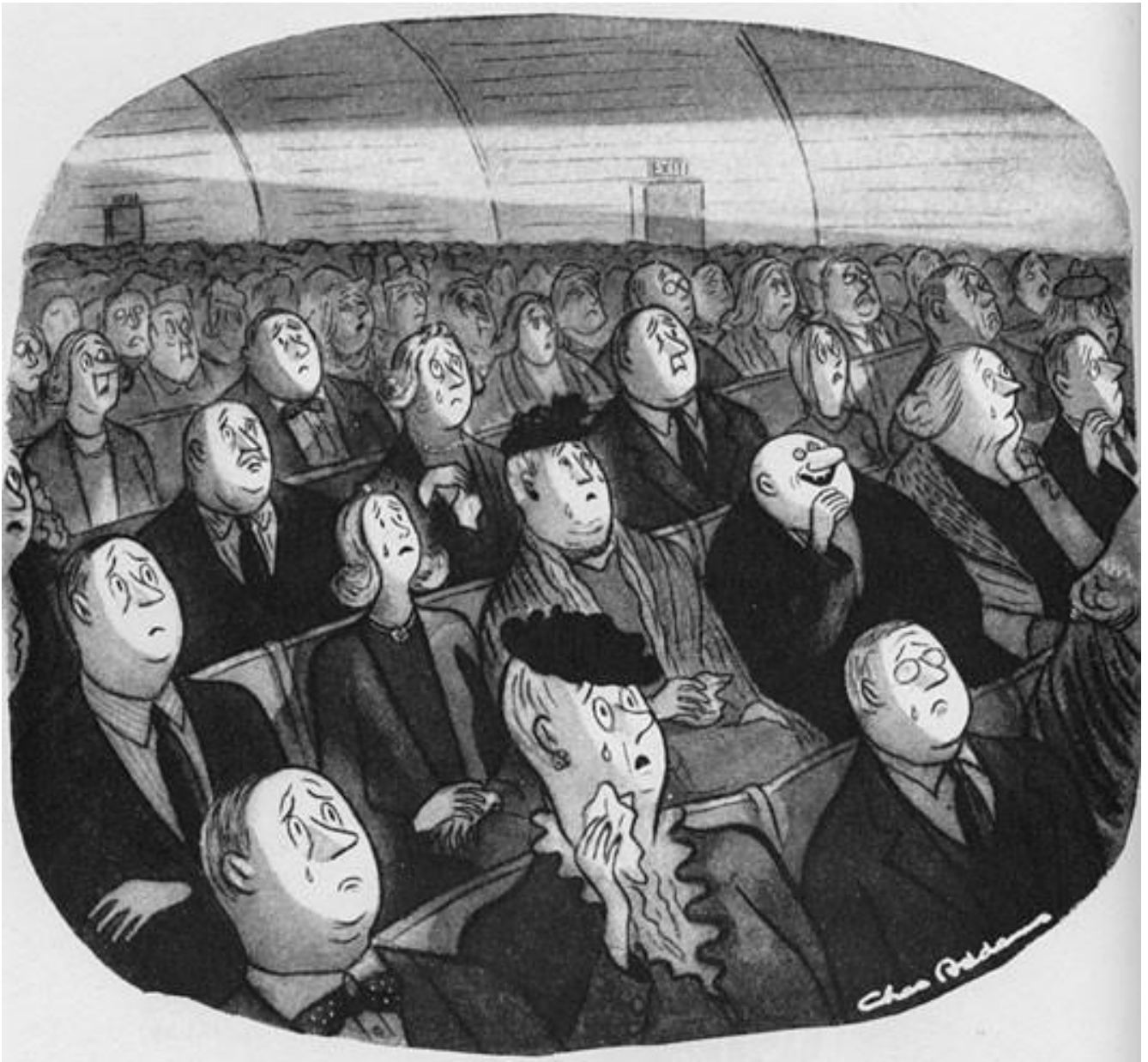
Charles Addams, vignetta pubblicata sul "New Yorker".

Baldessari amava una vignetta di Charles Addams pubblicata sul "New Yorker", ambientata in una sala cinematografica, un tema sviluppato già dalla pittura americana: si girano le spalle al film sullo schermo per interessarsi agli effetti del film sugli spettatori - un approccio su cui è costruito, più recentemente, lo straordinario Shirin (2008) di Abbas Kiarostami.