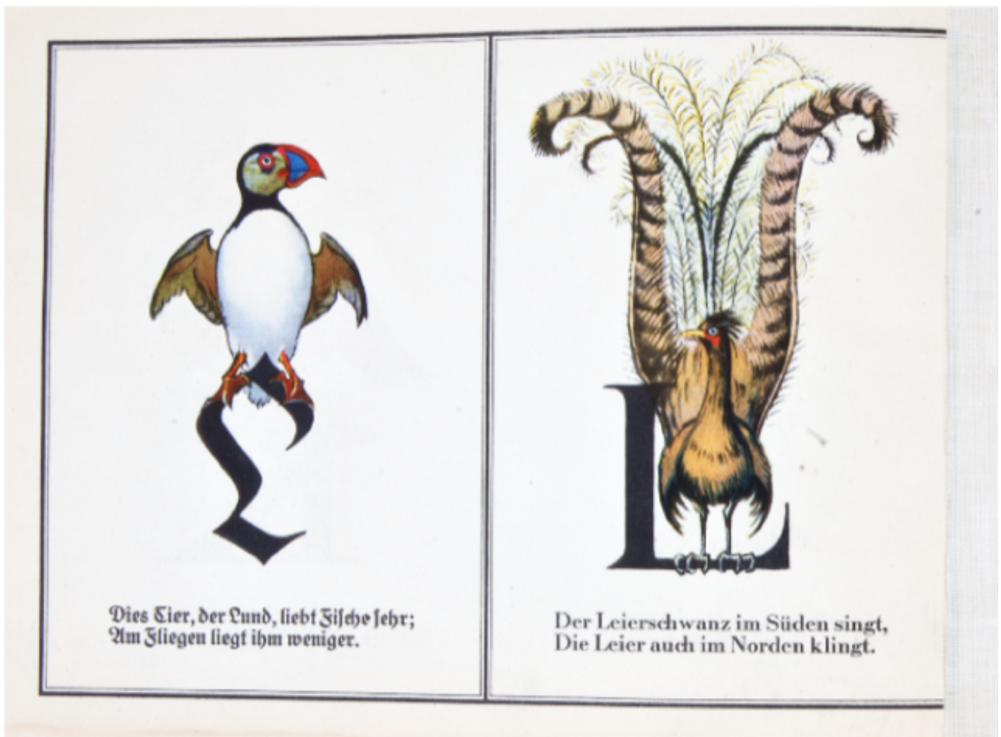
Friedrich Wilhelm Kleukens, Vogel ABC , Stalling Verlag, Oldenburg 1925.

Parallela a questo filone di indagine, troviamo nel libro una ricerca etimologica: Maurizio Bettini ci spiega il significato della parola latina ornamentum , che non corrisponde esattamente alla semantica dell'italiano, poiché indica anche l'equipaggiamento di un'unità militare o di una nave e persino i finimenti del cavallo, ma anche la bulla del ragazzo e il paludamentum del console che, oltre all'aspetto estetico, definivano il rango del personaggio in questione. L'etimo di ornare si collega poi al verbo ordinare : «l'ornamento non è un semplice abbellimento, ma una forma di “ordinamento”» ed è parente dell'ordito. Non si tratta quindi di un capriccio: l' ornamentum manifesta un ordine, come il greco kosmos , che indica l'adornare, ma anche l'ordine delle parole in un discorso, i modi del comportamento, la struttura della comunità e dello Stato e, infine, l'ordine dell'universo (pp. 95-96, vedi anche la voce 'kosmos' di Paolo Cesaretti).