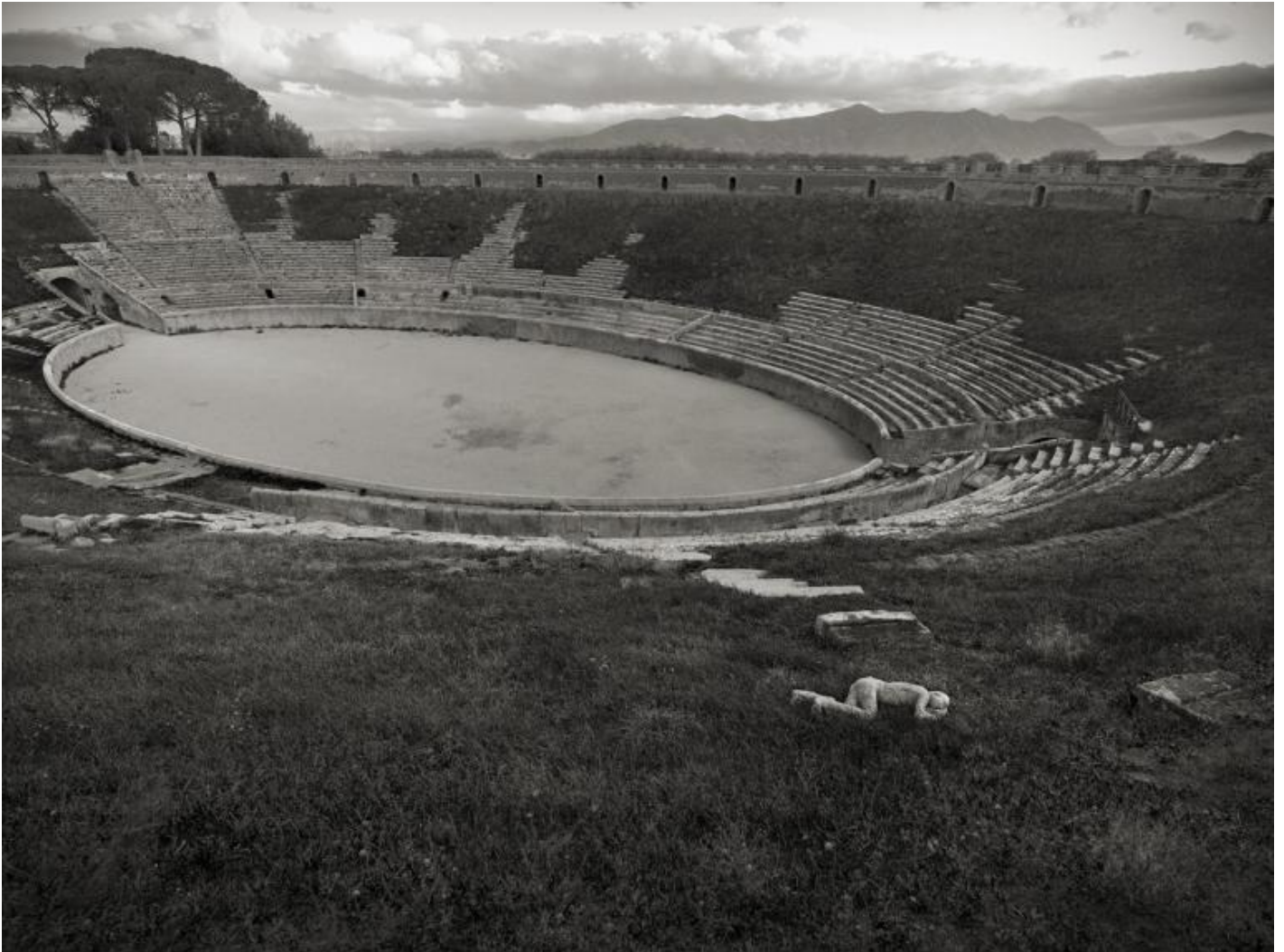
Kenro Izu Pompei, Anfiteatro, 2016 Stampa inkjet 61x76 cm

Sacred Places , di cui fanno parte, oltre alle fotografie delle Piramidi d'Egitto, anche quelle delle Piramidi dei Maya, di Stonehenge e di molti altri siti archeologici situati in svariate parti del mondo, dal Messico al sud est asiatico, diventa il progetto più importante e tutt'ora in corso, della sua vita. L'intenzione dell'autore è quella di entrare nel luogo attraverso l'immagine e per far questo utilizza il banco ottico che riproduce accuratamente ogni particolare così come la stampa al palladio che restituisce la materia di ogni cosa.