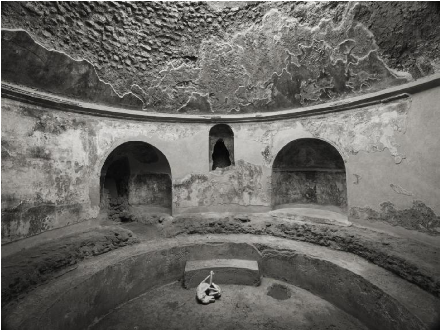
Kenro Izu Pompei, Terme Stabiane, 2016 Stampa al platino 42,5x55 cm

Molti autori, nel momento in cui scattano, sono spesso alla ricerca inconscia della bella fotografia. Una costruzione mentale che li induce a osservare il soggetto da un punto di vista principalmente estetico, (nel senso di estetizzante). L'intento di Kenro Izu è invece quello di catturare lo spirito del soggetto. Secondo la sensibilità dell'artista giapponese spirito equivale a vita . Per questo tanto i fiori o la frutta dei suoi still life quanto i paesaggi, le architetture e il corpo umano sono per lui tutti soggetti che racchiudono un alito di spiritualità riconducibile ad una sacralità arcaica.