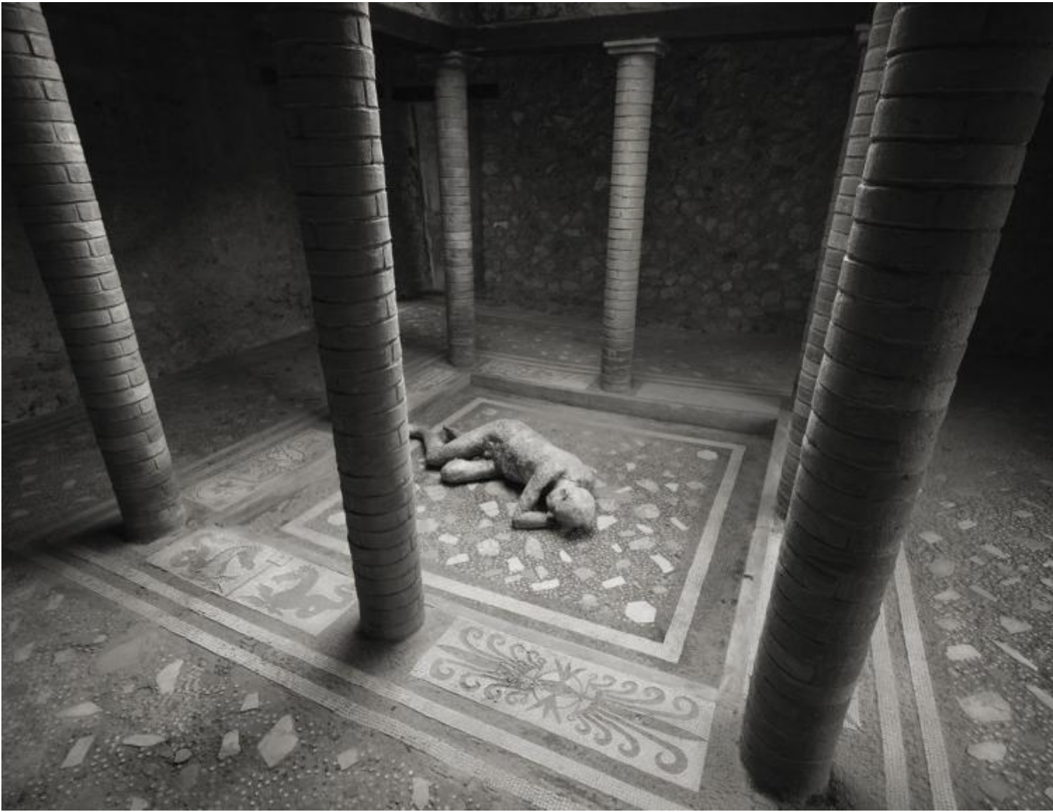
Kenro Izu Pompei, Casa del Menandro, 2016 Stampa inkjet 61x76 cm

La fotografia può avere il potere di evocare, “ non è una mera forma di arte – puntualizza l’autore – bensì un percorso di ricerca costante nella vita, per trovare il significato più recondito dell’esistenza stessa. Per questo considero ogni fotografia come la mia orma lasciata su un sentiero, talvolta sono orme nette e profonde, altre volte indefinite e superficiali. ”