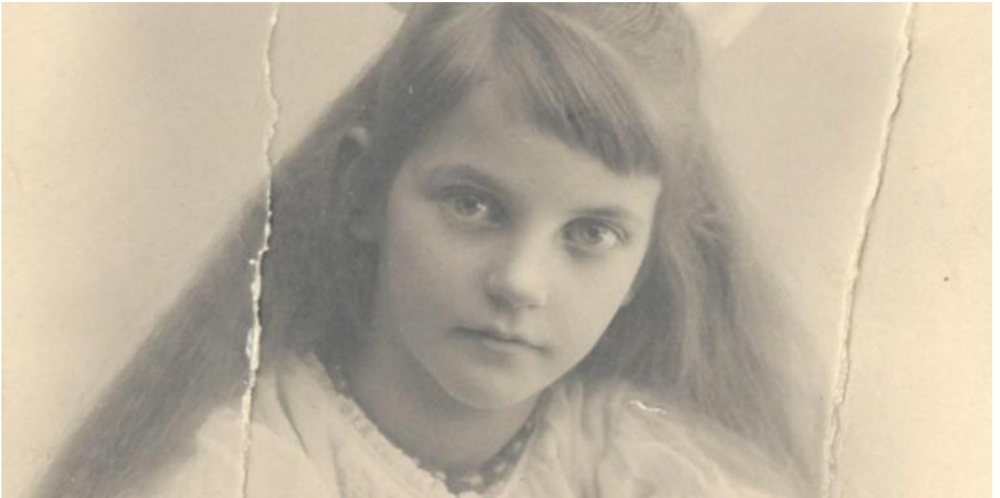
Astrid Lindgren da bambina.

Astrid Lindgren spiegò in diverse occasioni che il giacimento a cui attinse per tutta la vita i suoi personaggi e le sue storie fu l'infanzia con la sua grande famiglia, nella fattoria di Näs, a Vimmerby, nella contea dello Småland, di proprietà dei genitori, dove nacque nel 1907, e crebbe con i suoi fratelli rispettata e amata, con mansioni, compiti e doveri precisi, ma anche con la possibilità di godere di tutta la libertà del gioco in un ambiente naturale che dai suoi ricordi risulta un paradiso terrestre. Una proprietà, quella di Näs, a cui la scrittrice fu legatissima, di cui si prese cura per tutta la vita, e in cui non più bambina, trascorse lunghi periodi di vacanza insieme ai fratelli, alle sorelle, ai figli e ai nipoti. È in questo terreno la radice prima dell'immaginario della scrittrice. Una esperienza che permette di trarre da dimensioni apparentemente contraddittorie le energie vitali, l'intelligenza, lo spazio mentale per condurre un'esistenza propizia alla crescita, all'infanzia, ma anche all'età adulta. In una parola, alla felicità.