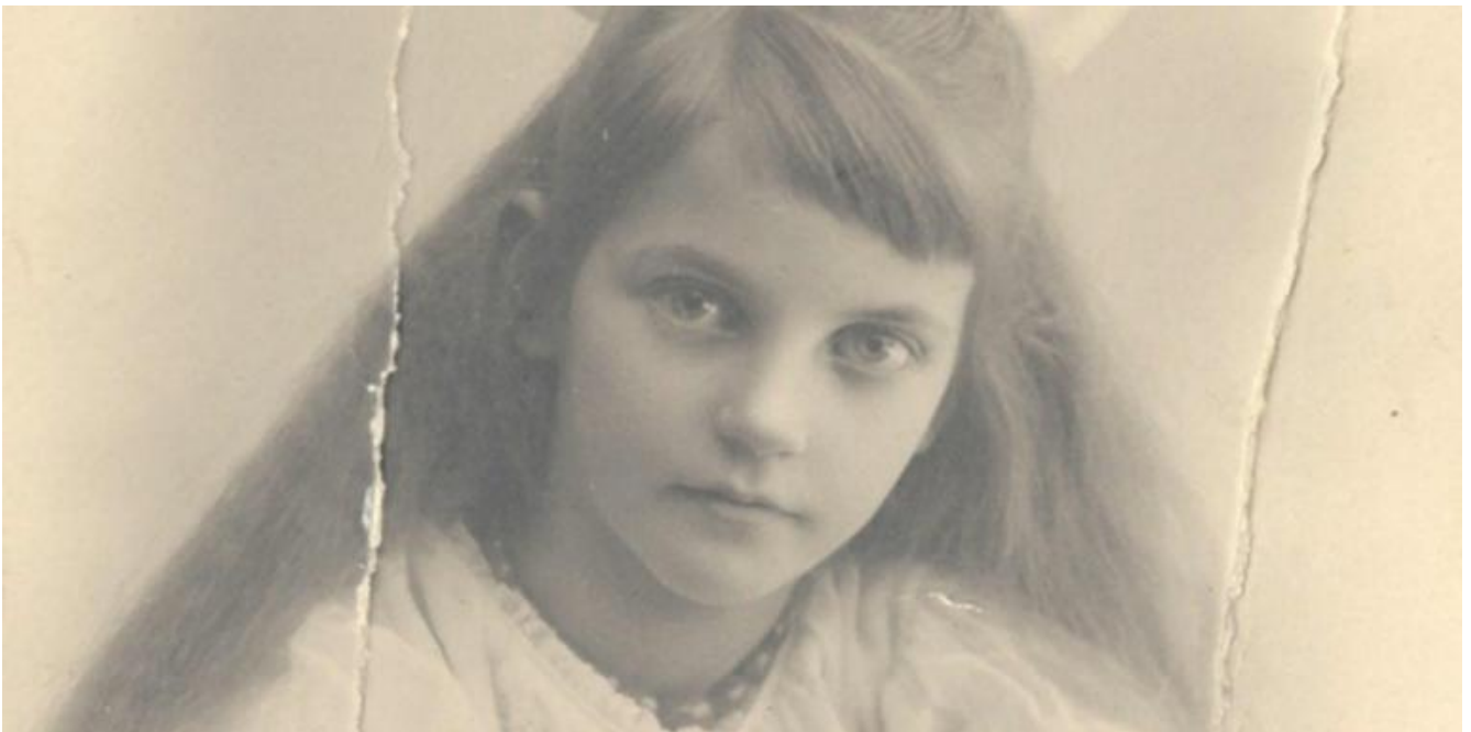
Astrid Lindgren da bambina.

casa scalena e sghimbescia quante altre mai, che vive fra alterne vicende di caos abissali e bizzarre pulizie, è contrapposta la linda casetta di Tommy e Annika, in cui la routine quotidiana è scandita dall'ordine più rassicurante, prevedibile e rigoroso. Alla nordicissima cittadina di Visby fa riscontro la tropicale isola di Taka Tuka. Insomma, una architettura infallibile per sedurre qualsiasi bambino o bambina, fra bisogno di trasgressione e necessità di sicurezza, scatenata immaginazione e sano realismo, libertà sconfinata e senso del limite, burbera selvatichezza ed educata urbanità, rischiosa avventura e confortevole abitudine, anarchismo sfrenato e rispetto delle regole, umorismo e serietà, follia del rischio e senso di responsabilità.