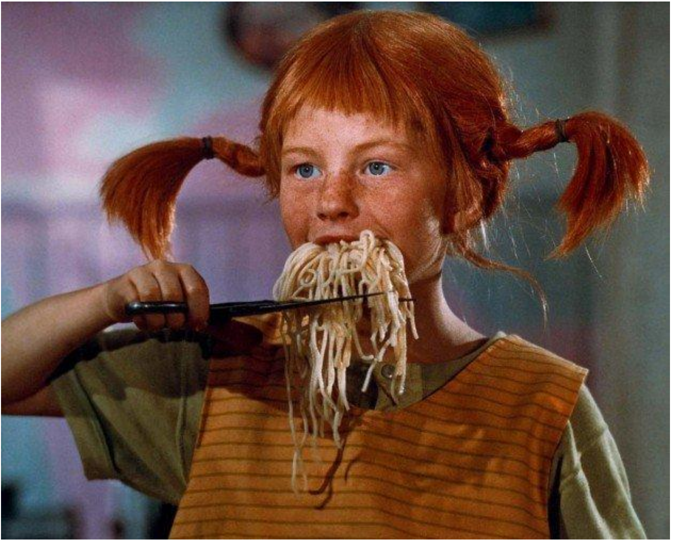
Immagini della serie tv Pippi Calzelunghe, uscita nel 1969.

Allora, cos'era ad affascinarci in questa figlia di pirata dalle trecce orizzontali? Non la libertà, ne avevamo abbastanza della nostra, che confinava, a volte, con la solitudine. Non la trasgressione: trasgressive lo eravamo non per scelta, ma per educazione. Pippi, nella sua meravigliosa Villa Villacolle, ci indicava, semplicemente, una possibilità, una via d'uscita. Pippi, ci rassicurava. Ci diceva che la diversità, minacciosa, perché penalizzata, nel nostro mondo, era possibile. Poteva addirittura trasformarsi in autonomia, in felicità, in forza (la prodigiosa forza fisica di Pippi). Noi eravamo ragazzine selvatiche ed eccentriche, sì, ma timidissime, impaurite da un mondo che, ovviamente, perceivamo "altro". Vivevamo anche noi, in realtà, in un recinto costruito da adulti, come i bambini allevati nella pedagogia tradizionale da genitori "autoritari". Pippi ci infondeva coraggio. Ci faceva ridere, ma ci piaceva per come sapeva essere seria e inflessibile, severa nel far trionfare la giustizia e la verità. Ci spiegava, con le sue regole tutte al contrario, che avere principi e rispettarli è importante. Che, in