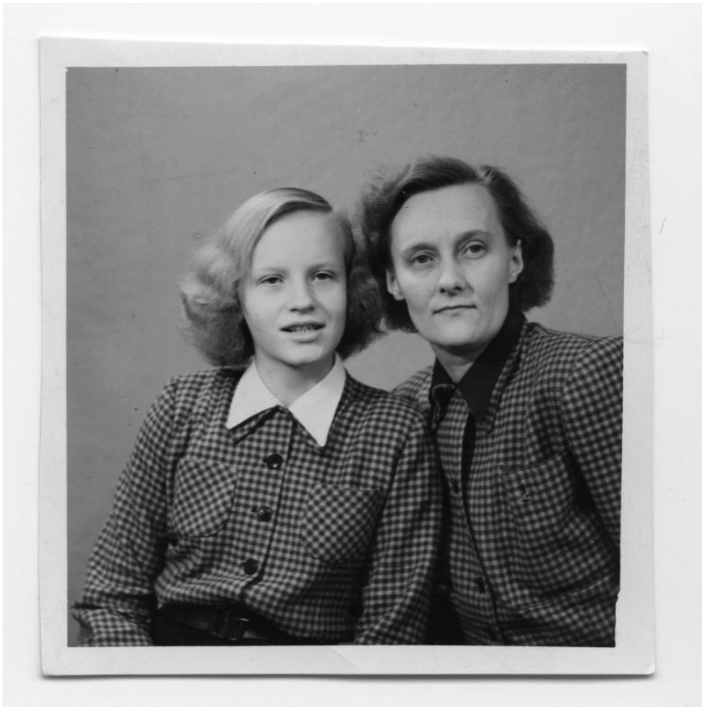
Astrid Lindgren con la figlia Karin.

Come Pinocchio, Alice, Harry Potter –, a Pippi, ovvero Pippilotta Viktualia Rullgardina Krusmynta Efraimsdotter Långstrump (tradotto Pippilotta Viktualia Rullgardina Succiamenta Efraimsilla Calzelunghe) toccò in sorte una fraterna intimità con milioni di bambini e ragazzi, finendo per vivere di vita propria e diventando più famosa della sua creatrice. L'opera della Lindgren, infatti, fu quasi oscurata dalle sue avventure: vero asso pigliatutto, proprio come lo è Pippi personaggio, inesauribile, spiazzante, costantemente al centro dell'attenzione.