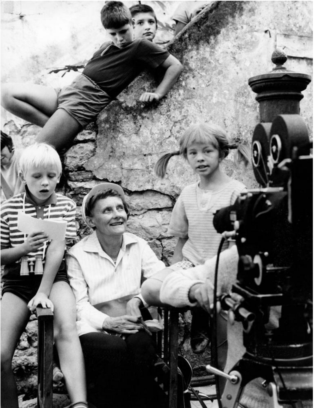
Astrid Lindgren insieme a Inger Nilsson.