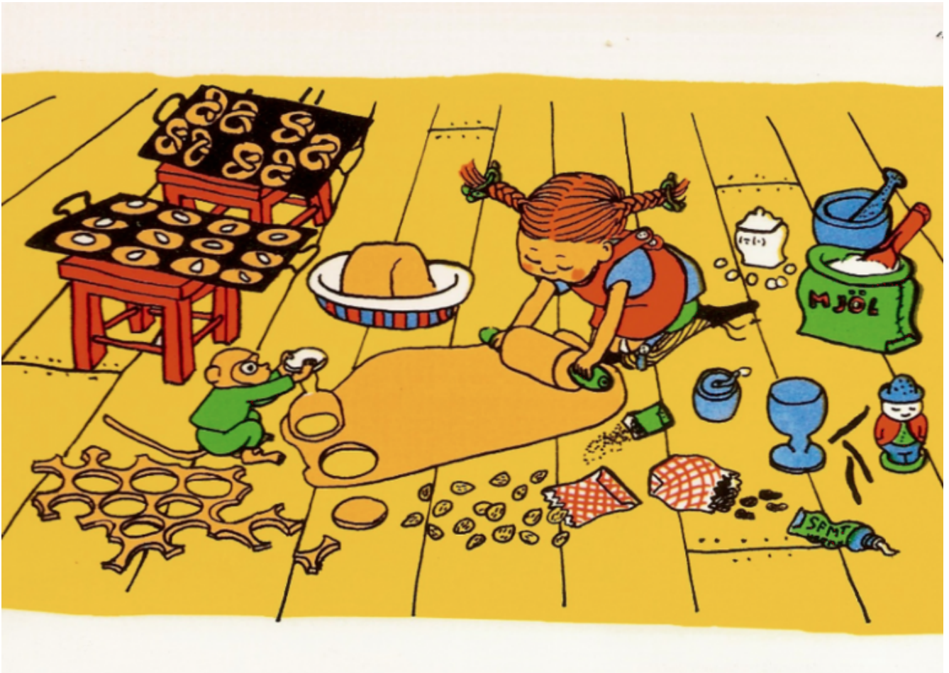
Illustrazioni di Ingrid Vang Nyman per Pippi Calzelunghe.

Questa osservazione che potrebbe sembrare marginale mette in luce un aspetto fondamentale delle avventure costruite intorno alla esplosiva identità di Pippi. Astrid Lindgren che come molti autori per ragazzi ha potuto contare su una conoscenza sottilissima dell'infanzia, una sorta di orecchio assoluto per i bambini, ha composto una partitura narrativa pressoché perfetta, che orchestra in un corpo coerente armonie e dissonanze, contrasti e accordi, differenze e analogie, simmetrie e asimmetrie.