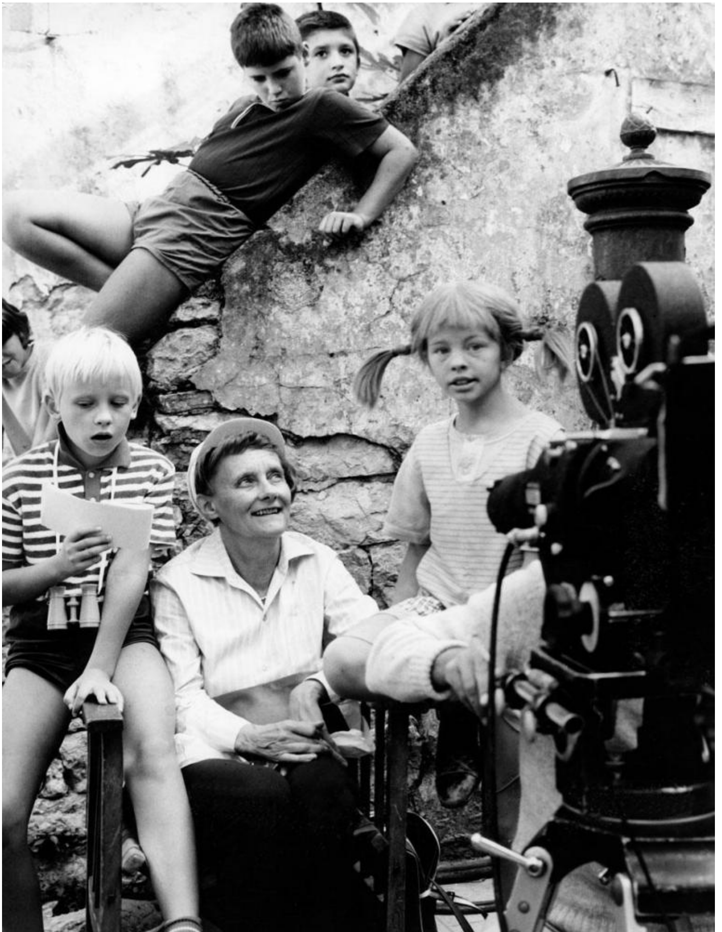
Astrid Lindgren insieme a Inger Nilsson.