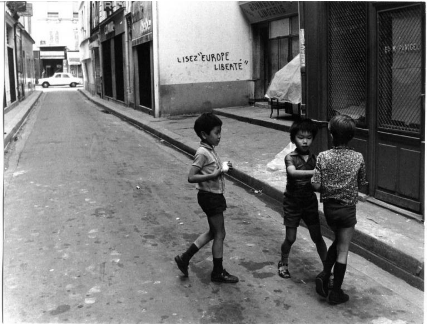
Marais, Parigi, 1971.

A molti di questi dubbi, raccogliendo l'auspicio dell'autore della Camera chiara a scrivere una storia di sguardi, nel suo Storia dello sguardo (Il Saggiatore, 2017), l'irlandese Mark Cousins risponde che se da un lato il sovraccarico visivo sminuisce qualsiasi evento e apre a una vera e propria Babele (Vabele è il termine coniato per unirlo al virtuale), dall'altro il bilancio degli strumenti sviluppati in merito al potenziale creativo espresso nelle arti visive risulta complessivamente positivo.