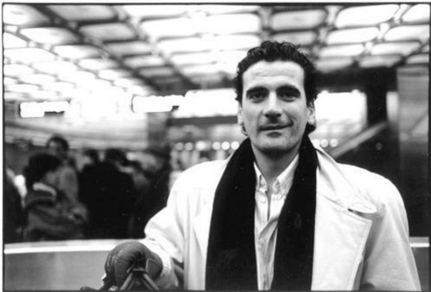
Massimo Troisi, 1988.

In questo lungo viaggio, è come se Piermarini scorgesse, seguendo il suo amato Baudrillard, nella frenesia schizofrenica della società occidentale odierna, una inarrestabile mortificazione . Sappiamo che l'immagine, agli albori, è il calco del defunto, dunque ombra, specchio, imitazione e mimesi. Ma forse il punto per l'autore è che la vita stessa, come in preda a un ipnotico gioco di prestigio, finisce per plasmarsi a immagine del calco. Non più la rappresentazione della realtà, bensì la realtà di sole immagini, trasforma il mondo in un balbettio tautologico insignificante, conducendo Salvatore Piermarini verso il De Martino dell' Apocalisse culturale , e a ritroso al Carlo Levi di Paura della libertà .