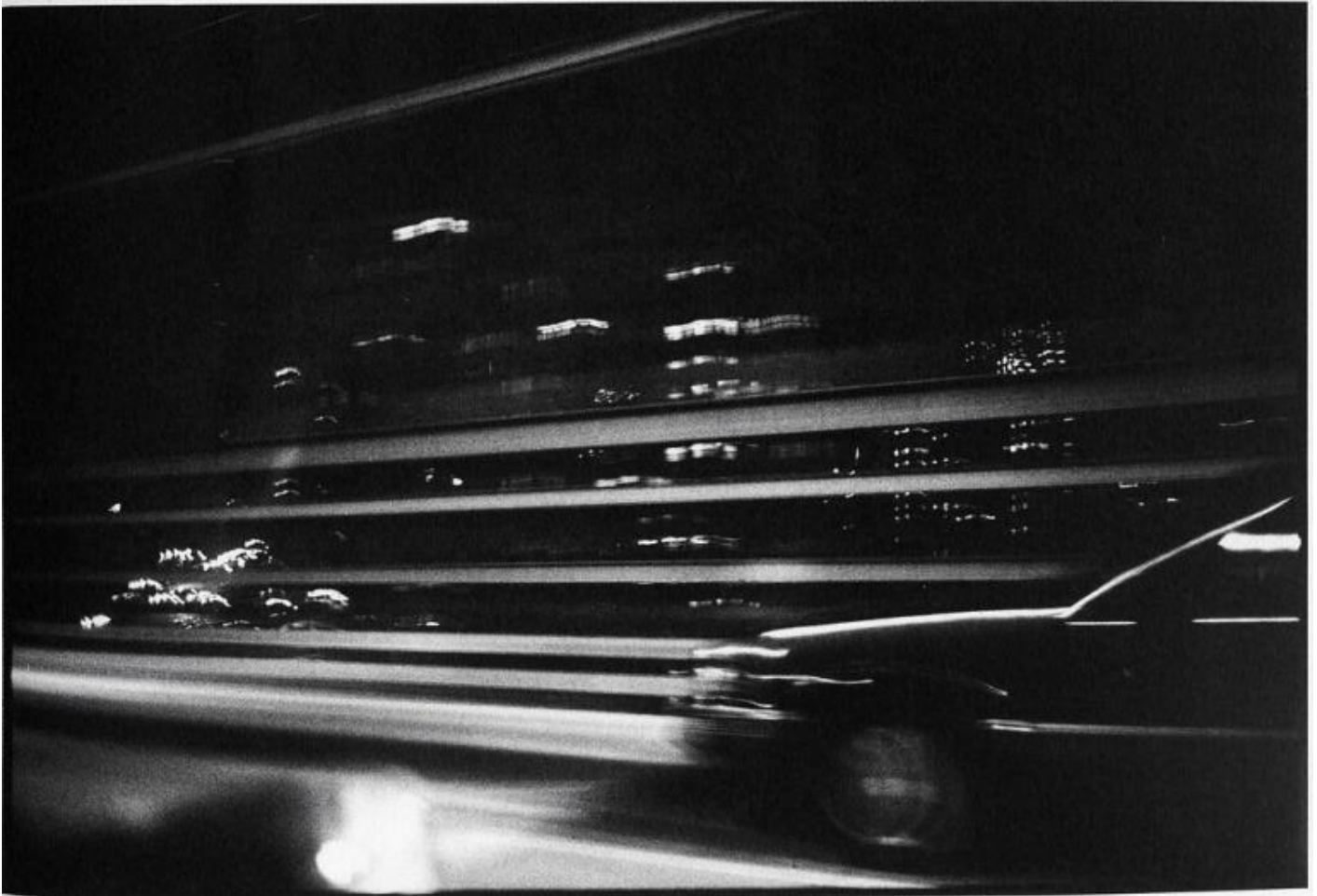
New York City, 1987.

Beninteso, Cousins si dice consapevole che il risultato non può che dirsi ambivalente, e finisce per ammettere che le attuali "mancanze dello sguardo" restano il sostanziale prezzo da pagare come contropartita.