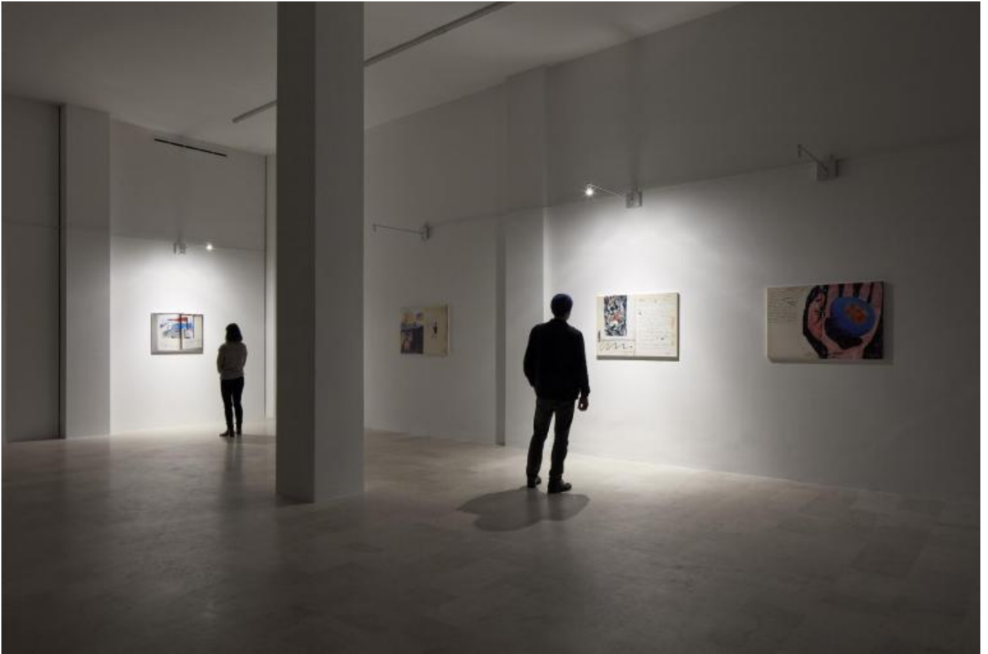
Franco Vaccari, Migrazione del reale, 2020, Installation view, courtesy of the artist, P420 Bologna, ph Carlo Favero.

apparentemente distanti – lo spazio dedicato alla mia opera con quello dedicato a questo asteroide.