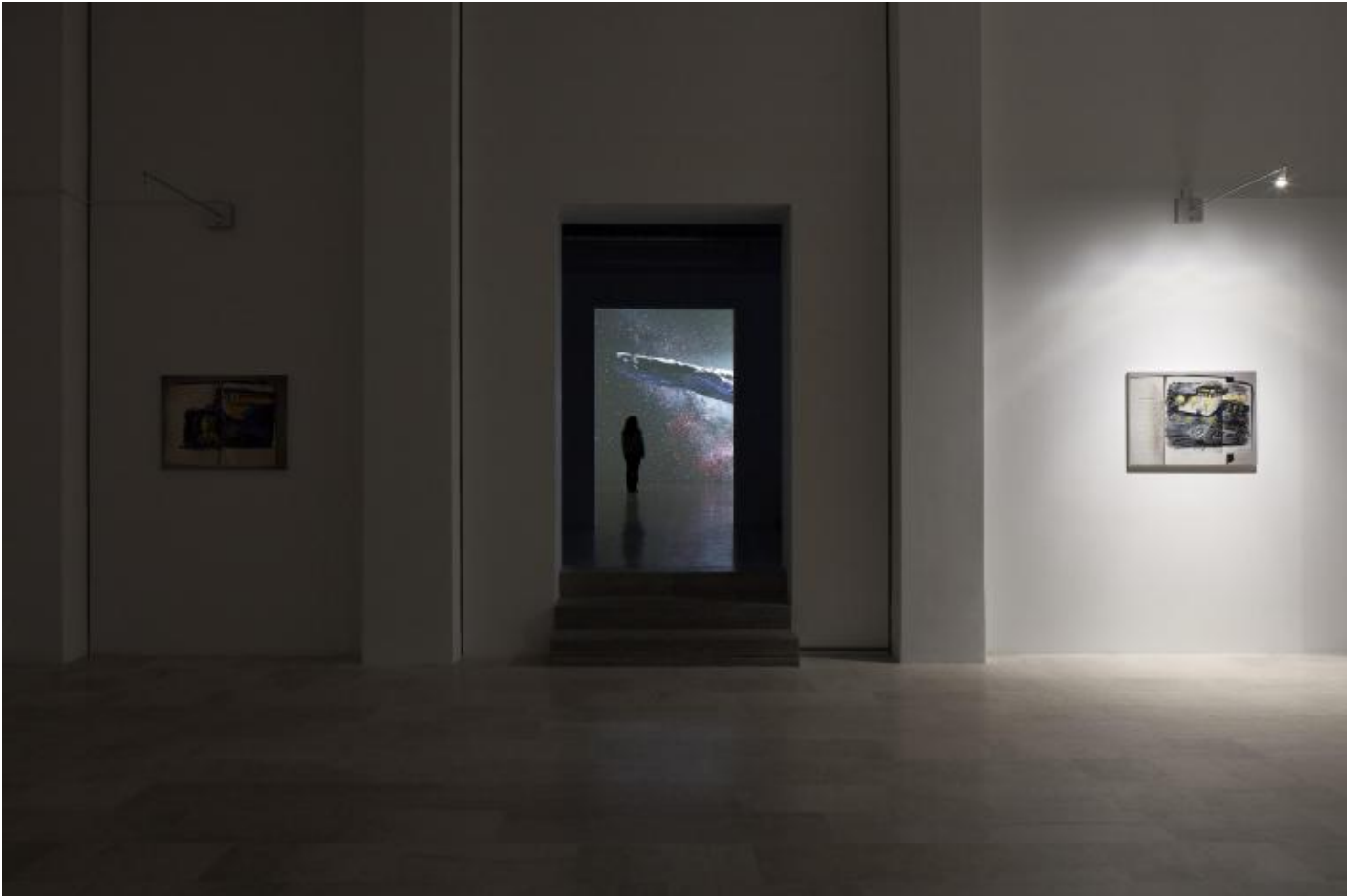
Franco Vaccari, Migrazione del reale, 2020, Installation view, courtesy of the artist, P420 Bologna, ph Carlo Favero.

Nel sogno subentrano tantissime cose. Quando ho dovuto rendere l'immagine che vedevo sulle superfici delle uova, mi è venuto in mente Capogrossi. Ma, in realtà, forse l'immagine più precisa erano i cromosomi, nel momento in cui si suddividono, dando luogo ai corpi, allo sviluppo. Nel mio sogno c'era qualcosa che mi ricordava l'inizio dello sviluppo dei corpi. Allora questa danza dei cromosomi mi è sembrata abbastanza simile alla danza dei segni misteriosi presenti nelle opere di Capogrossi, che non sono solo decorativi, ma vogliono probabilmente dire anche qualcos'altro e hanno radici più profonde.