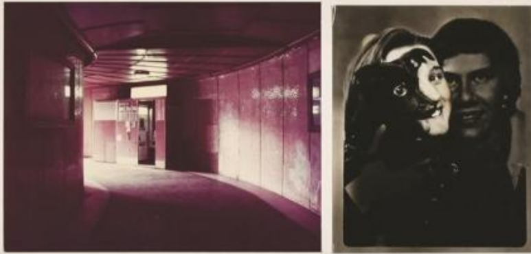
Schema di funzionamento dell'ESPOSIZIONE IN TEMPO REALE "L'UCCELLO SU QUESTE PARETI UNA TRACIA FOTOGRAFICA DEL TUO PASSAGGIO", 1975