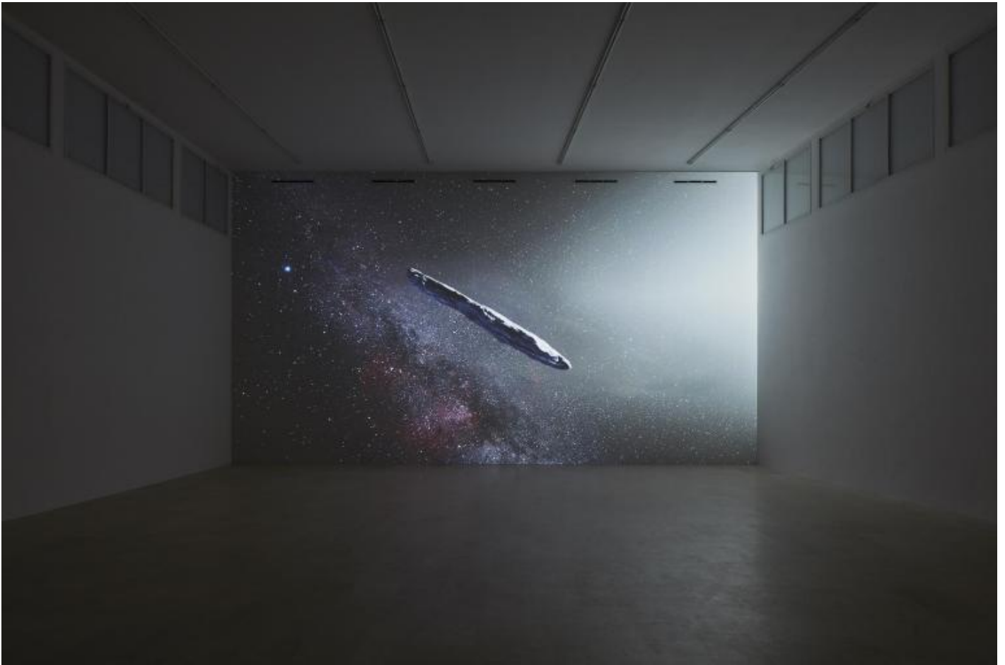
Franco Vaccari, Migrazione del reale, 2020, Installation view, courtesy of the artist, P420 Bologna, ph Carlo Favero.

Quindi come immagini tu l'utilizzo di una macchina fotografica quantistica? Che immagini potrà realizzare?