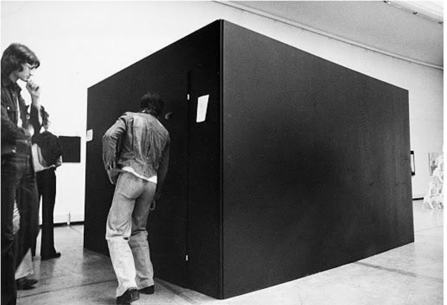
Franco Vaccari, I sogni, spazio privato in spazio pubblico 1975.

passa quasi totalmente, come per la luce nel telefono. Anche le telefonate nel loro apparire potevano essere oggetto di mostre. L'apparizione della voce di un corpo, di un essere, che per noi poteva significare tanto, ma a distanza enorme, doveva essere fonte di una meraviglia incredibile. Però adesso con la telefonata chi è che riesce a emozionarsi più sentendo una voce? Anche se ci sono situazioni in cui questo ancora si verifica, come per esempio è accaduto a Rigopiano qualche tempo fa, dove una valanga di neve ha sepolto un albergo. Ci sono state telefonate da parte di persone, che poi sono morte, che da sotto la neve si erano messe in contatto con i loro cari o con quelli che avrebbero forse potuto andare a salvarli.