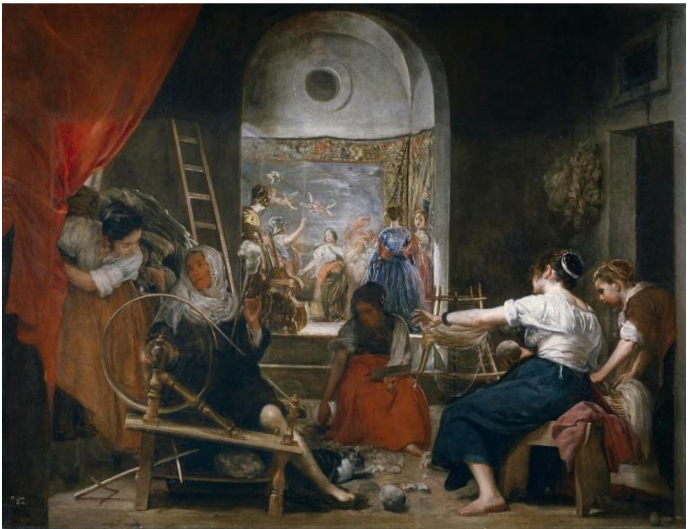
Diego Velázquez, "La fabula de Aracne o las hilanderas", Madrid, Museo del Prado, 1657-58.