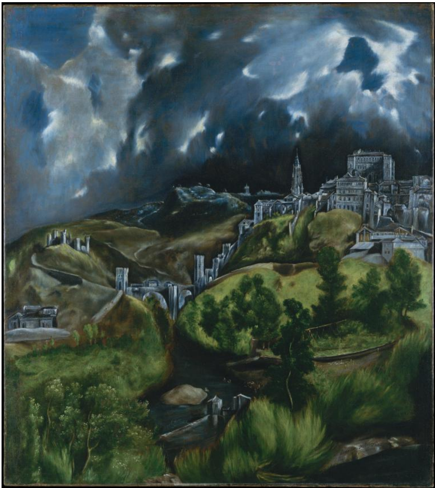
El Greco, "View of Toledo"