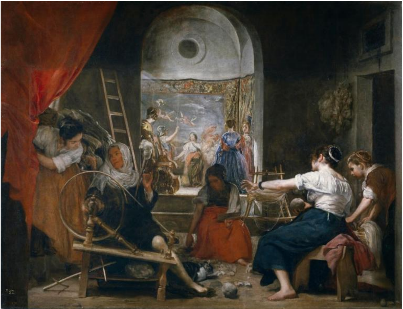
Diego Velazquez, "La fabula de Aracne o las hilanderas", Madrid, Museo del Prado, 1657-58.

S.: È un sentimento ambivalente, il mio. Perché è vero che mi sono sempre sentito un cittadino europeo, ma è vero pure che sono nato e cresciuto in un paese chiuso e diffidente come la Romania, anche se per fortuna in un ambiente familiare intellettualmente molto aperto. Quella di allora era un'Europa fatta di centri e periferie; per gli intellettuali rumeni di allora il centro restava Parigi, ma anche Roma e il suo mito avevano lo stesso significato. Questa nostalgia del centro, una volta partito dalla Romania, mi è passata. L'Europa è riuscita a rifondarsi proprio lasciando da parte questa scissione, fra centro e periferie, che non ha più motivo di esistere.