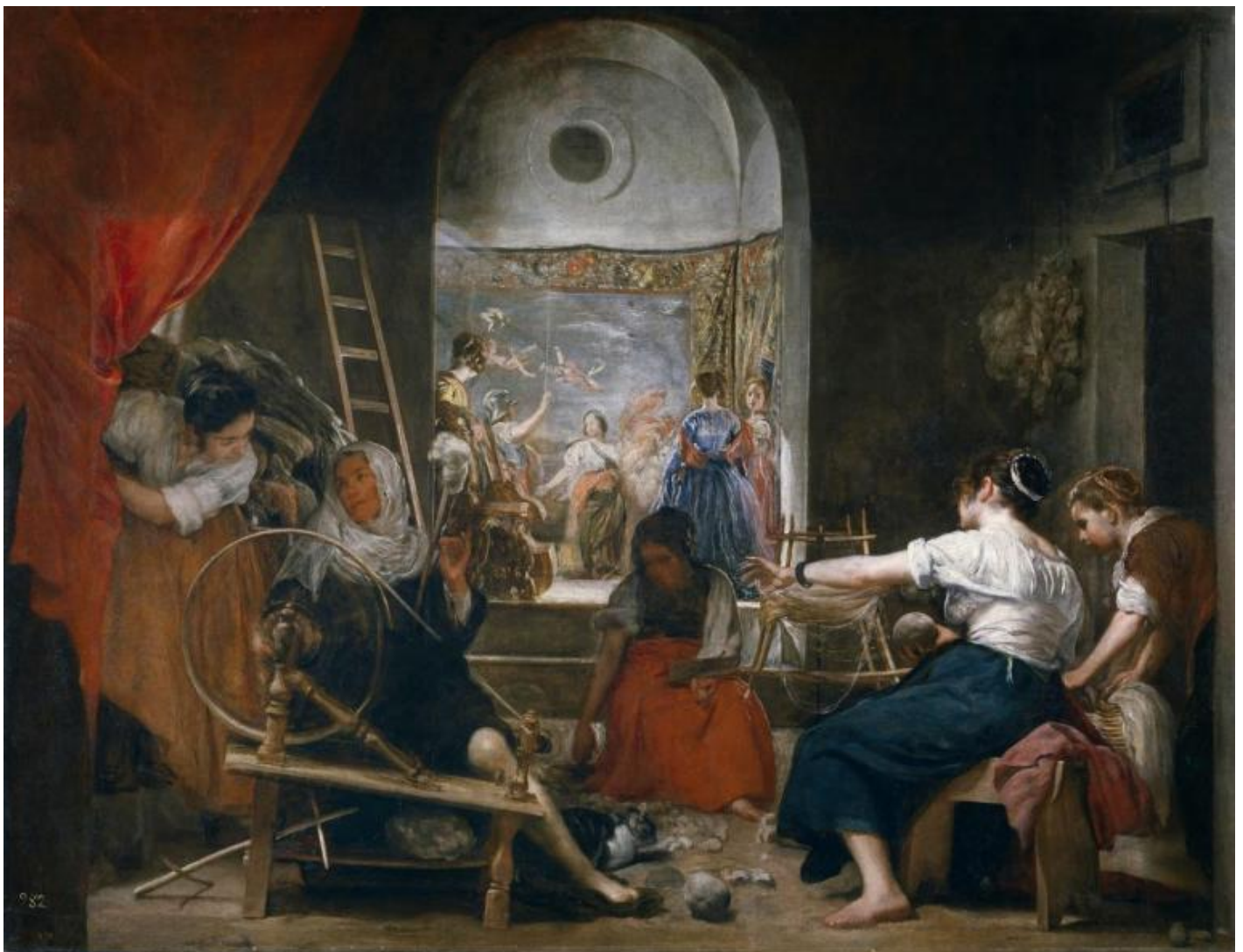
Diego Velázquez, "La fabula de Aracne o las hilanderas", Madrid, Museo del Prado, 1657-58.