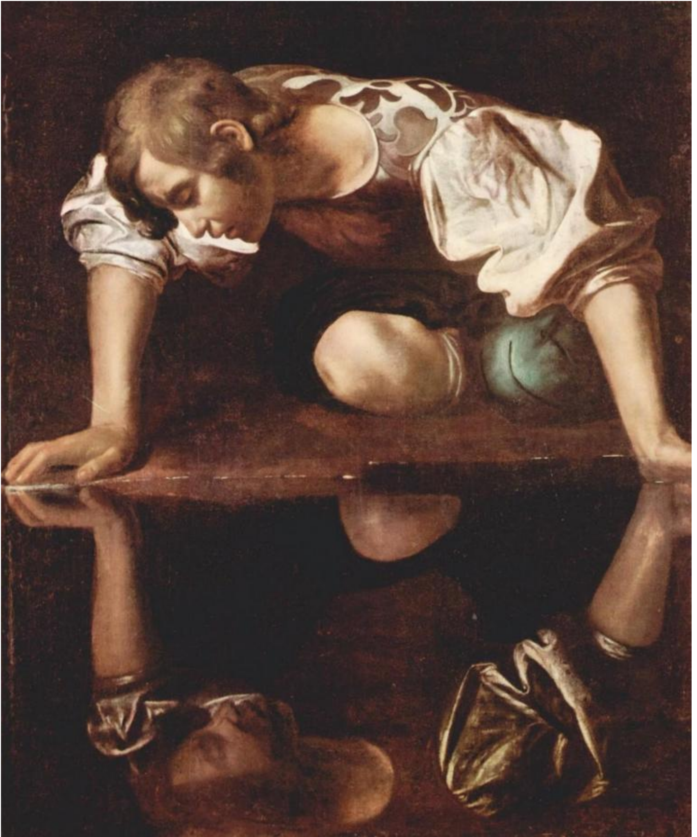
Caravaggio (attribuito), "Narciso alla fonte", Roma, Palazzo Barberini.

sdoppiamento della personalità e l'incontro effettivo con l'Altro (la zingara che legge la mano al giovane gentiluomo) compongono un chiasmo: l'identità narcisistica e il faccia a faccia sono due aspetti dello stesso problema di rappresentazione.