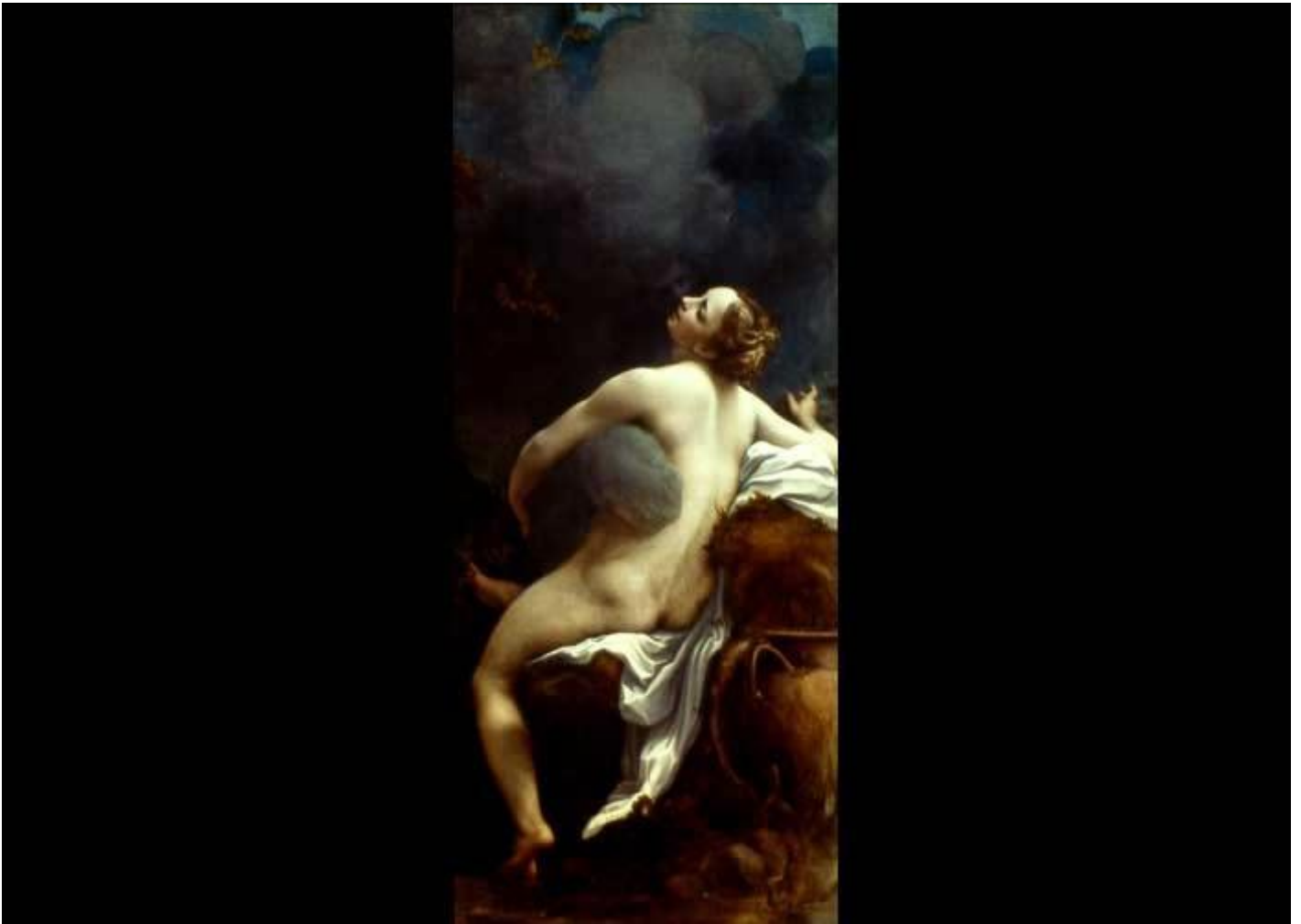
Correggio, "Giove e io", Vienna, Kunsthistorisches museum, 1532.