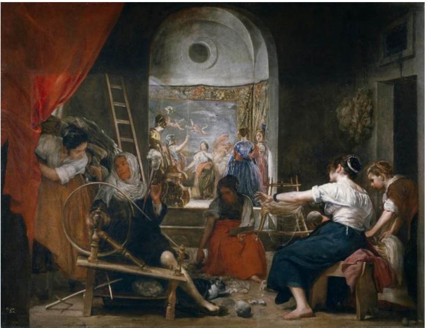
Diego Velázquez, "La fabula de Aracne o las hilanderas", Madrid, Museo del Prado, 1657-58.