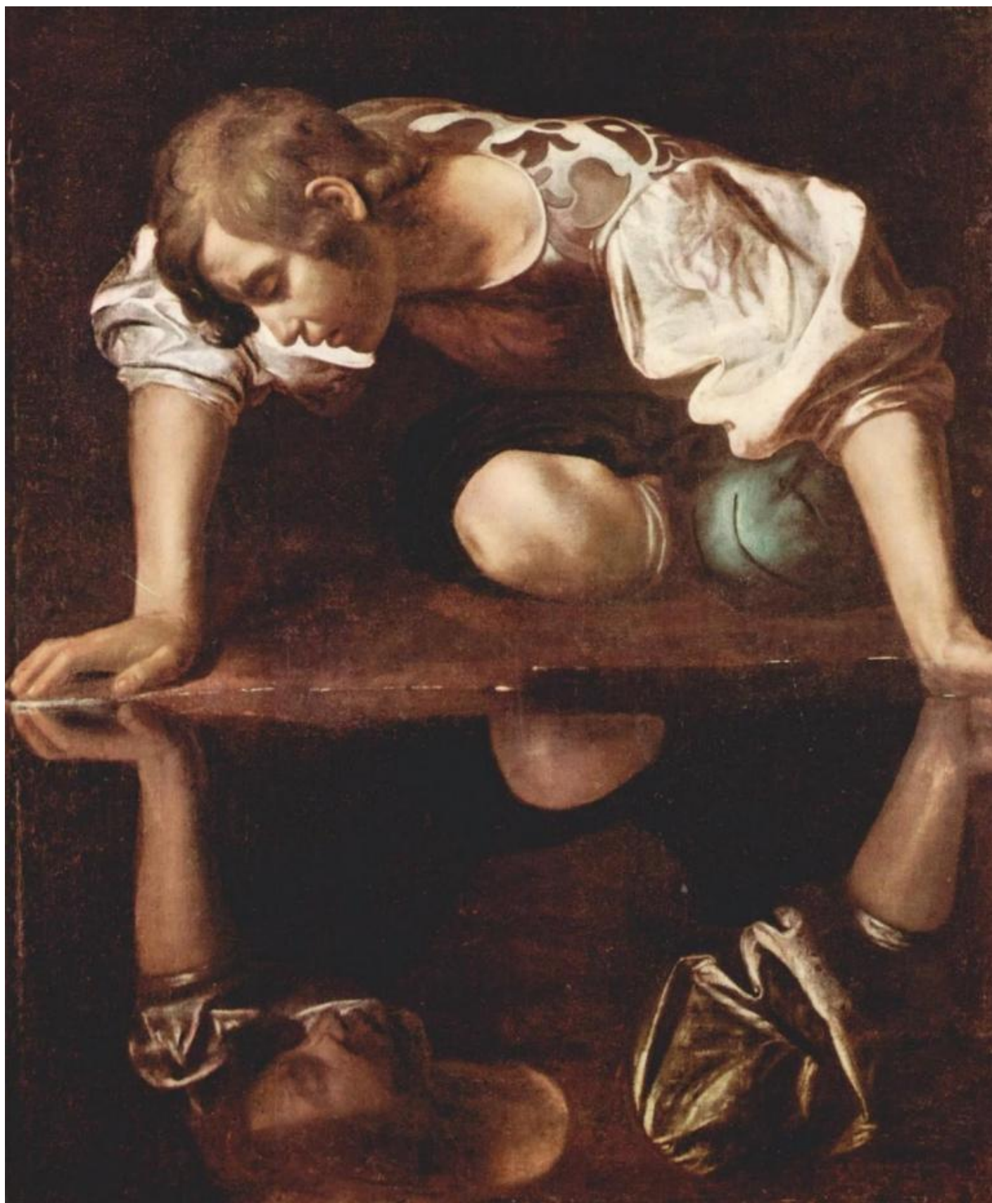
Caravaggio (attribuito), "Narciso alla fonte", Roma, Palazzo Barberini.

sdoppiamento della personalità e l'incontro effettivo con l'Altro (la zingara che legge la mano al giovane gentiluomo) compongono un chiasmo: l'identità narcisistica e il faccia a faccia sono due aspetti dello stesso problema di rappresentazione.