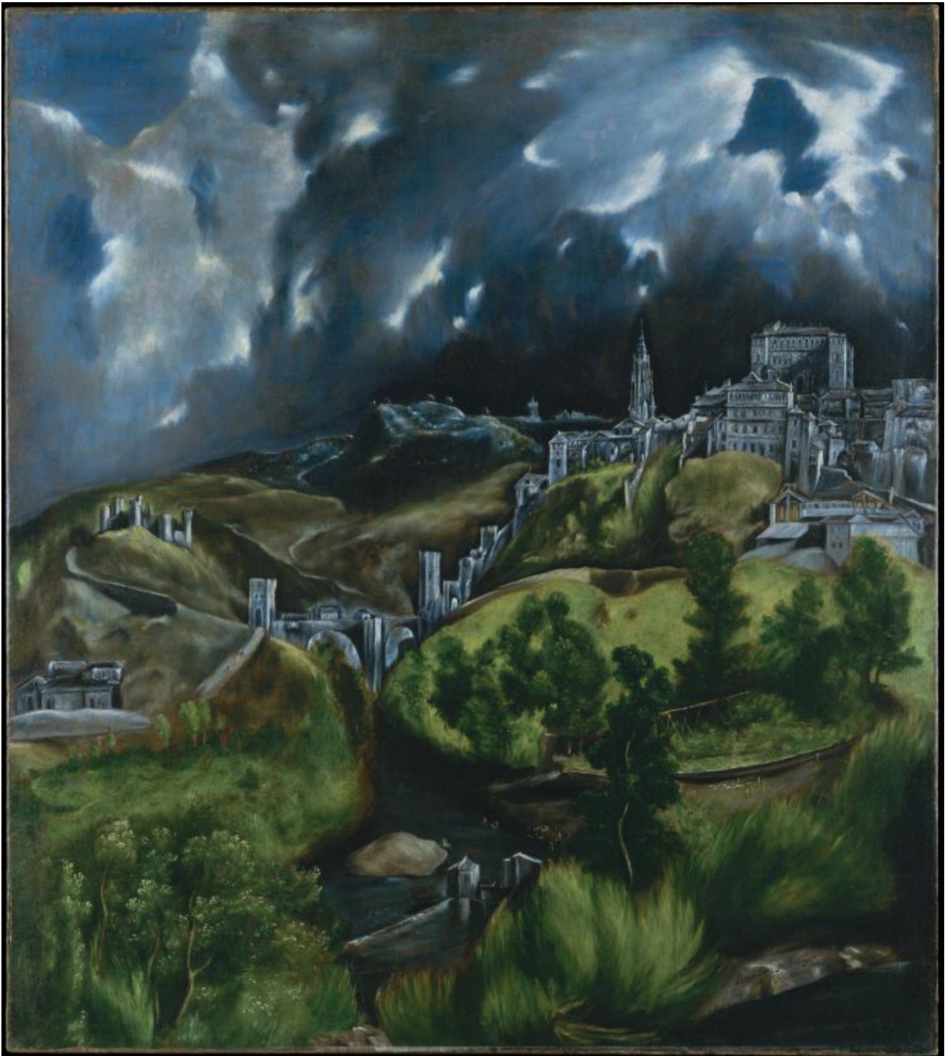
El Greco, "View of Toledo"

C.: Però quella robusta formazione tradizionale forse è rimasta, a rinsaldare le basi dei tuoi lavori. Quando leggo il caposcuola della semiotica della pittura, Louis Marin, o certi suoi colleghi e discepoli geniali come Daniel Arasse o Hubert Damisch, mi rendo conto della differenza che li divide da te: i tuoi studi hanno un fondo di erudizione, di spessore storico e competenza anche sul contesto