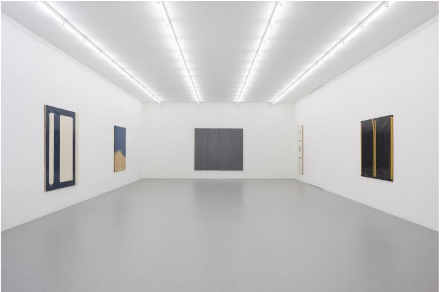
Mario Schifano, Qualcos'altro 22.01.2020 – 20.03.2020, Installation view Gió Marconi, Milan

I monocromi rappresentano il punto sorgivo di quella linea ascendente che porterà l'artista a brillare come una stella cometa, assunto nel cielo della sua mitologia, e poi lo condurrà lungo una traiettoria di caduta, giù nel delirio da tossico e delle opere buttate via, le copie, i falsi e tutta l'incredibile vicenda esistenziale che per anni ha messo in ombra il valore di una produzione che non ha equivalenti ma solo epigoni.