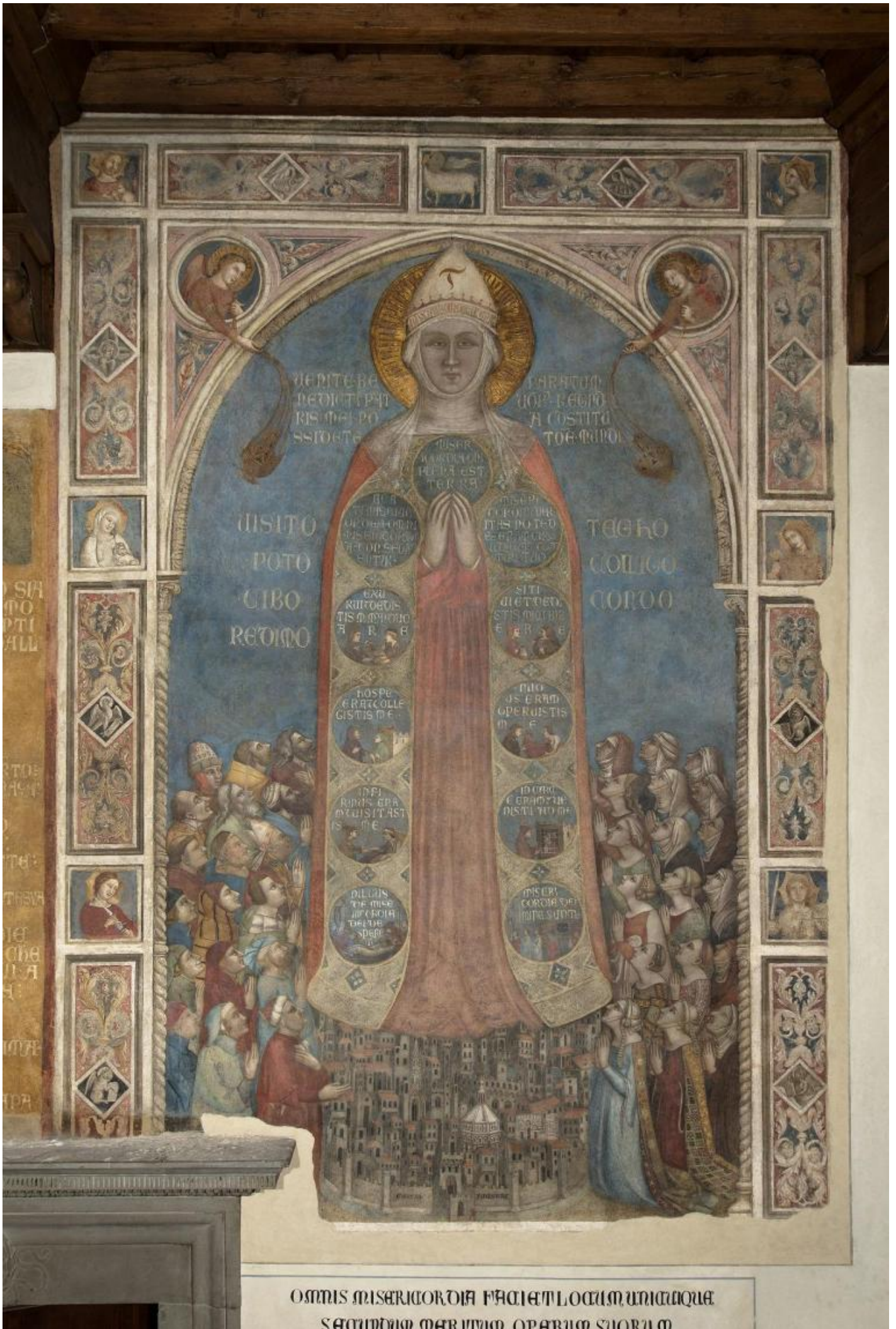
OMNIS MISERICORDIA FACIET LOCUM UNICUIQUE SECUNDUM MEDIUM OPERUM SUORUM