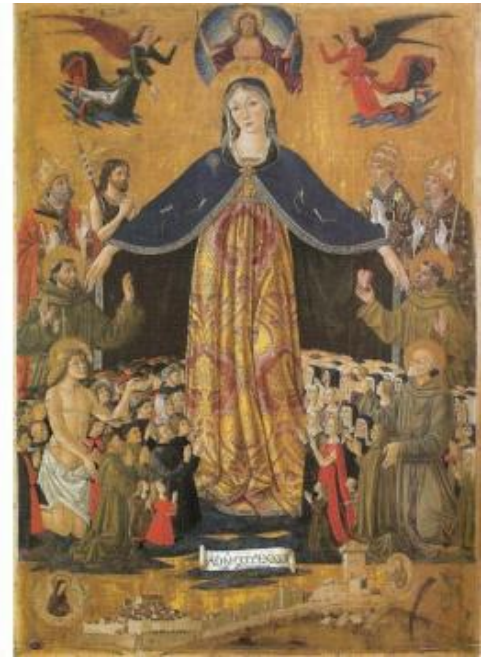
Maestro da Salisburgo, Madonna della Misericordia, 1460, Oberosterreichische Land Museum, Bottega di Benedetto Bonfigli, Madonna della Misericordia, 1464, Perugia, Oratorio di San Bernardino.

La Morte con la falce compare anche nell'affresco Madonna della Misericordia (1464), dipinto dalla Bottega di Benedetto Bonfigli nell'Oratorio di San Bernardino a Perugia. Qui, però, lo scheletro viene colpito da un angelo in volo, armato di lancia, che intende fermare la pestilenza, nonostante che in cielo Cristo continui a brandire le frecce. Diego de la Cruz, invece, nella Vergine della Misericordia (1485 ca.) di Burgos, raffigura due diavoli in alto, al posto delle figure divine: uno scaglia grandi frecce, l'altro porta pesanti libri sulla schiena. Il diavolo a destra è stato identificato come Titivillus, ovvero un demone che, secondo Cesario di Heisterbach (Colonia, 1180 ca. – Heisterbach, 1240 ca.), è responsabile degli errori di scrittura dei copisti. Titivillus è qualificato come “diavolo patrono degli scribi”, figura nata per fornire un alibi atto a giustificare gli errori di copiatura nei manoscritti. Secondo la tradizione, Cesario descrive per primo sia la visione della Madonna della Misericordia sia la figura di Titivillus.