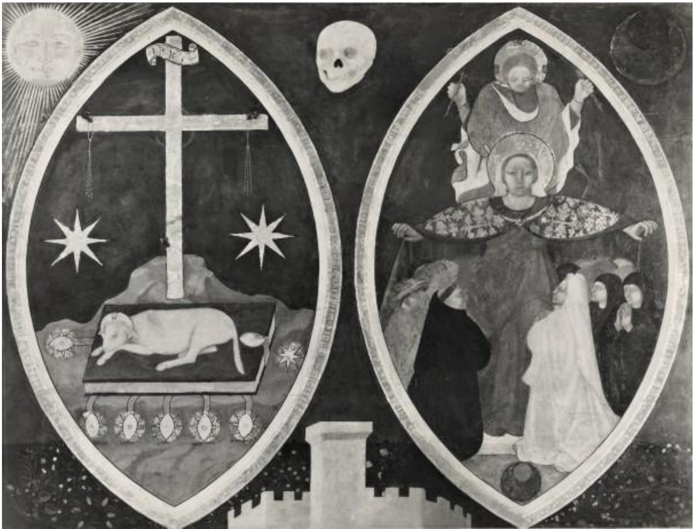
Antonio da Firenze, Simboli apocalittici e madonna della misericordia, 1440, ca. Perugia, Galleria Nazionale dell'Umbria.

Di fronte alla forza devastante della Peste nera, si fa strada la sensazione che sia in atto una punizione divina. Nascono in questo periodo molti movimenti religiosi, in conseguenza della peste o nel timore dell'epidemia. I flagellanti percorrono le città, la vita quotidiana è scandita da numerose rogatorie e processioni, i pellegrinaggi diventano più frequenti. Molti movimenti religiosi sfidano il monopolio ecclesiastico sulla sfera spirituale. In molti luoghi vengono innalzate chiese votive dedicate a S. Sebastiano e a S. Rocco, patroni degli appestati. Il popolo, deluso dal silenzio e dall'indifferenza del dio patriarcale (ora inteso più come giudice severo che come padre buono), cerca conforto altrove, indirizzando le sue suppliche alla discendente cristiana della Grande Dea materna: l'attributo della misericordia viene ora riservato alla Vergine Maria. In questi periodi pestilenziali i governi e la Chiesa hanno grande difficoltà a gestire la crisi. Nel momento in cui si mette in discussione Dio, perché sembra che non voglia o non possa rispondere alle suppliche del popolo in pericolo di morte, i poteri terreni, parimenti impotenti, perdono autorità. In una società prevalentemente "religiosa", nel senso che si privilegia l'intervento divino per risolvere tutti i problemi, l'inefficacia delle preghiere mina l'autorità istituzionale della Chiesa, che tuttavia è un colosso inaffondabile e sopravvive come in ogni altro periodo di grande crisi del passato.