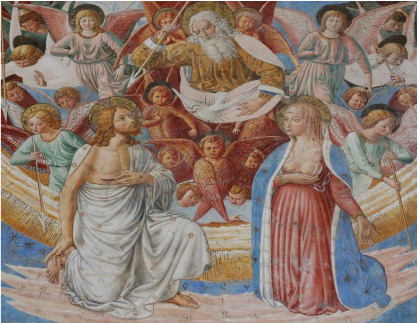
Benozzo Gozzoli, San Sebastiano intercessore, 1464 - 1465, Dettaglio San Gimignano, Chiesa di Sant'Agostino.

L'immagine della Mater misericordiae ha notevole fortuna nell'arte, declinata in innumerevoli versioni anche nei secoli successivi al Trecento, quando ancora pervasano le carestie e i virus pestilenziali. Nelle città italiane la grande carestia scoppiata tra il 1315 e il 1317 e le epidemie del 1339 e 1340 provocano un deciso aumento della mortalità. Nessuna preghiera sembra efficace contro le cause della tragedia. La Peste nera imperversa in Europa tra il 1347 e il 1353, uccidendo almeno un terzo della popolazione del continente, ovvero tra i 20 e i 25 milioni di persone. Nell'ottobre 1347, la peste fa la sua comparsa nei porti del Mar Mediterraneo, a Messina, a Costantinopoli e a Ragusa di Dalmazia (Dubrovnik) per poi diffondersi in tutta Europa. Il batterio della malattia viene portato dalle pulci presenti sui topi che viaggiano a bordo delle navi. A Venezia, scoperta la causa della trasmissione epidemica, nasce la precauzione di fare sostare per quaranta giorni ("quarantena") le navi, con il loro equipaggio, al largo della Laguna. Si pensa che l'agente patogeno del 1348 sia responsabile di tutte le successive epidemie scoppiate in Europa fino al XVIII secolo, con vari gradi di intensità e mortalità.