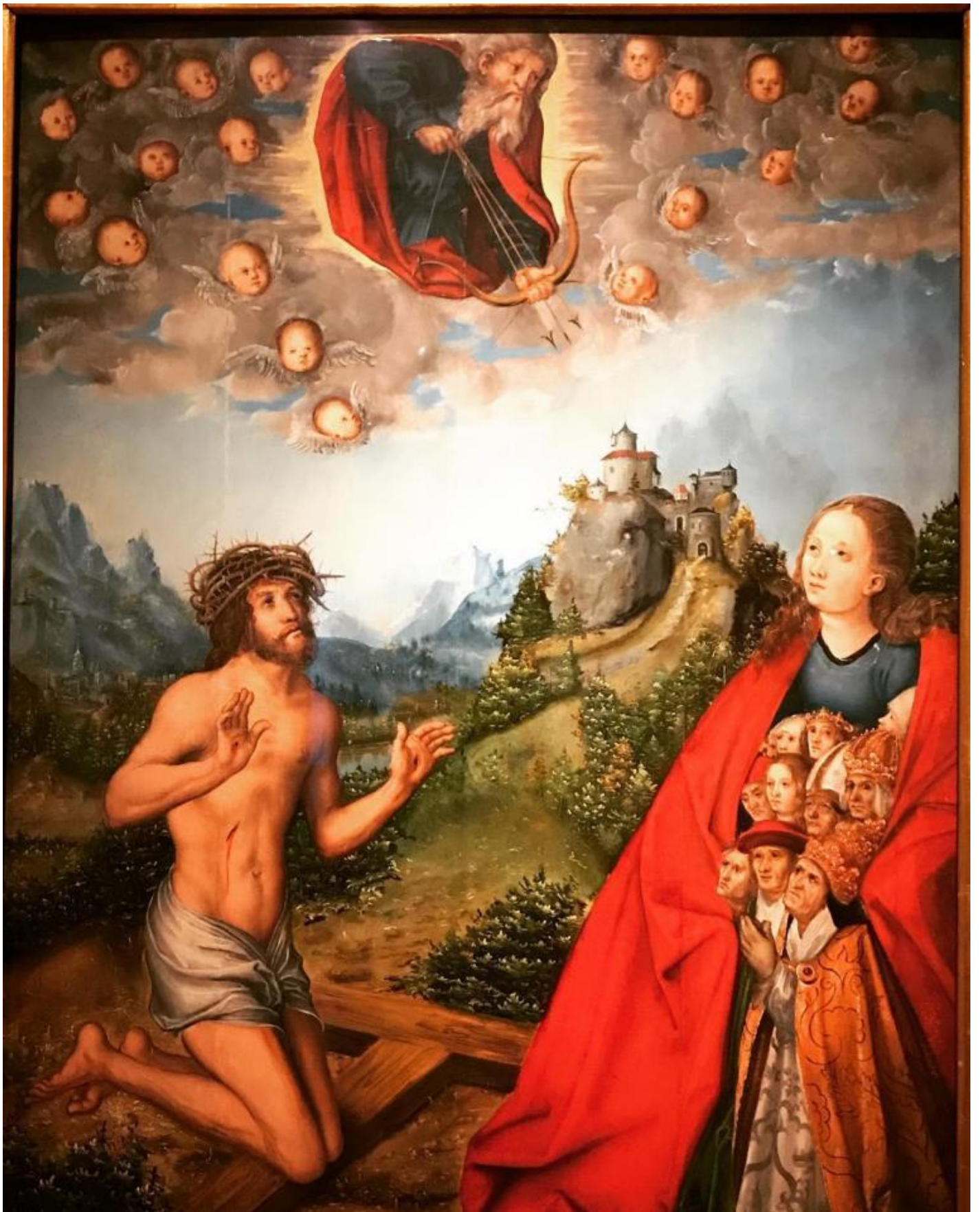
Lucas Cranach, Cristo e la Madonna intercedono, 1516.