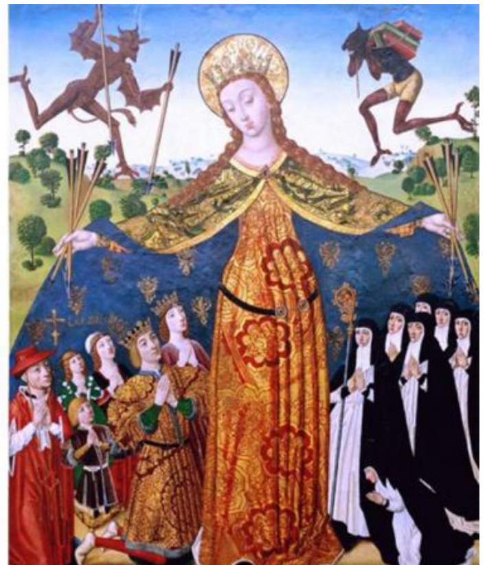
Madonna della misericordia con trono di grazia, 1390, Norimberga, Museo Nazionale tedesco, Diego De La Cruz, Madonna della Misericordia, c. 1486 Burgos Monastero di Santa Maria Real de las Huelgas.

L'iconografia delle madonne che proteggono il popolo dai dardi è fortemente imparentata con i soggetti delle danze macabre e dei trionfi della morte, dove al posto di Dio, Cristo e degli angeli sono gli scheletri o la Morte stessa a scagliare gli strali pestilenziali, come per esempio nella facciata dell'Oratorio dei Disciplini a Clusone. La funzione protettiva è identificabile nella misericordia della madre di Dio, resa visibile attraverso l'elargizione della carità e l'offerta di una speranza di salvezza, per un'umanità in perenne balia delle avversità, delle epidemie e dell'abbattersi della punizione celeste.