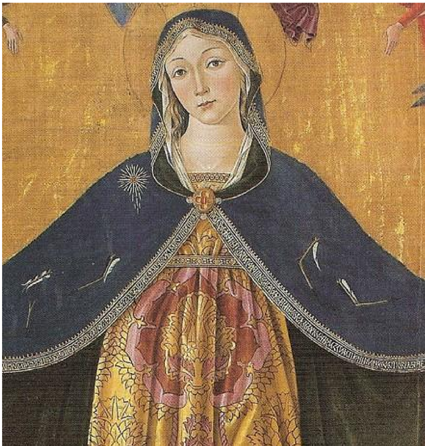
Bartolomeo Caporali, Le frecce rotte sul manto della Madonna.

centrare i bersagli colorati delle massime autorità religiose e politiche e anche delle innumerevoli teste dei popolani, che stanno nelle retrovie, sotto il manto mariano.