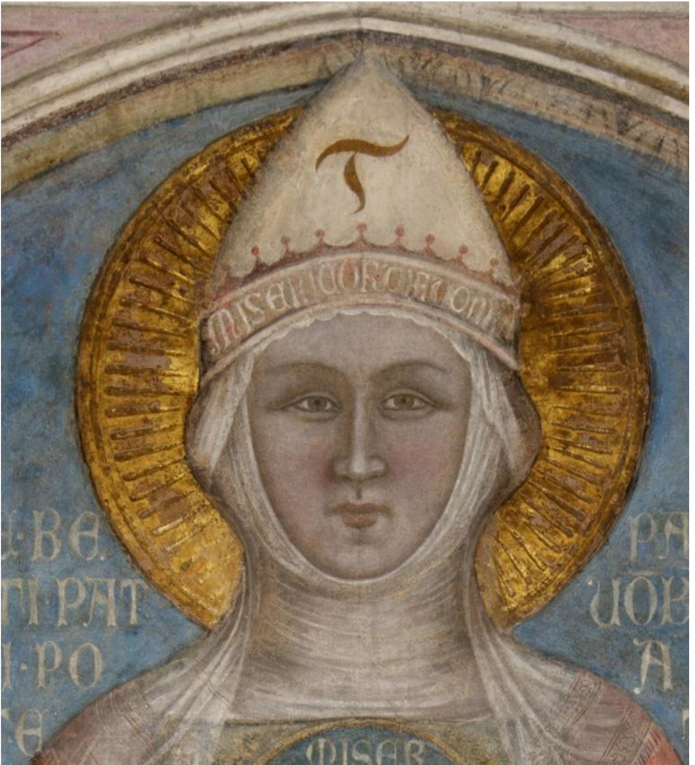
Madonna della Misericordia, Firenze, Sala dei Capitani della Loggia del Bigallo.

La Madonna della Misericordia di Bartolomeo Caporali, commissionata dal Convento dei Francescani di Montone (Perugia) nel 1482, è un tipico gonfalone contro la peste, utilizzato in processione per invocare il soccorso divino in caso di calamità e malattie. La Vergine della Misericordia protegge i fedeli con il proprio mantello dalle sciagure scagliate da Cristo giudice. Assieme alla vergine sono chiamati in causa, per accrescere il potere del manto mariano e per creare uno scudo impenetrabile sopra il borgo anche i Santi Sebastiano (protettore contro la peste), Francesco (santo titolare della chiesa), Biagio (protettore della gola e dei cardatori di lana), Giovanni Battista (in veste di protettore del Comune di Montone), Nicola (protettore