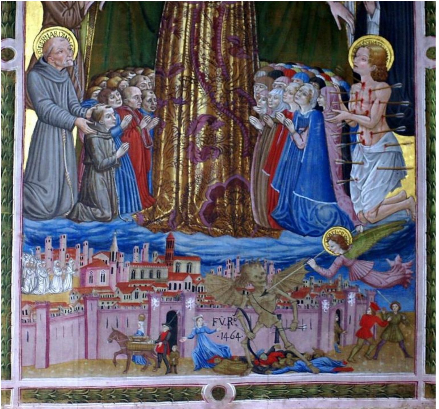
Bottega di Benedetto Bonfigli, Madonna della Misericordia, 1464, Perugia, Oratorio di San Bernardino.

dell'ordine francescano, mercanti e commercianti), Bernardino (santo francescano importante, protettore degli ammalati ai polmoni), Gregorio (cui è dedicata la Pieve) e Antonio di Padova (il santo taumaturgo dei Francescani). Nella parte inferiore, sulla destra, uno scheleto con la falce si aggira poco distante dalle mura di Montone, portando con sé gli effetti nefasti della peste.