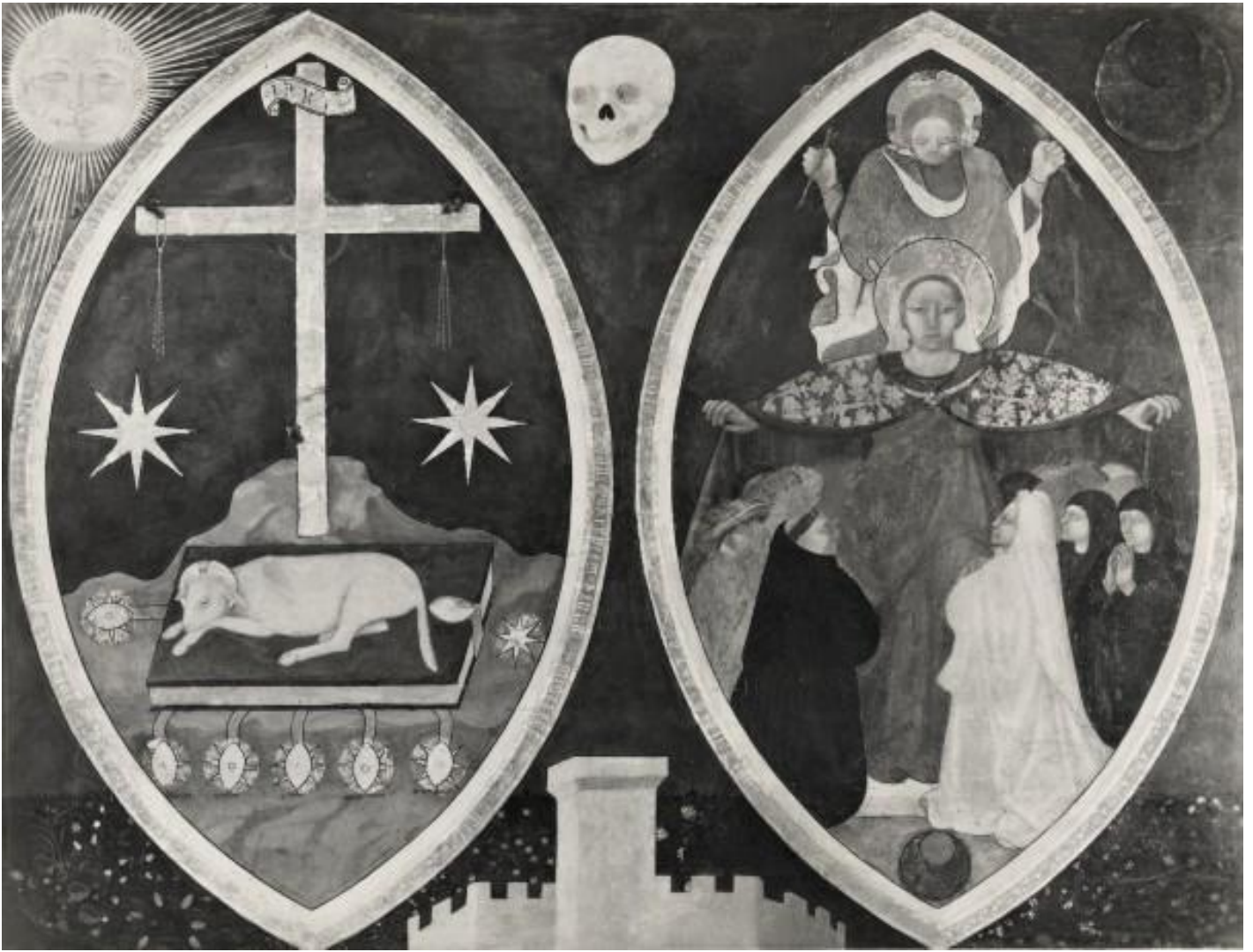
Antonio da Firenze, Simboli apocalittici e madonna della misericordia, 1440, ca. Perugia, Galleria Nazionale dell'Umbria.

Di fronte alla forza devastante della Peste nera, si fa strada la sensazione che sia in atto una punizione divina. Nascono in questo periodo molti movimenti religiosi, in conseguenza della peste o nel timore dell'epidemia. I flagellanti percorrono le città, la vita quotidiana è scandita da numerose rogatorie e processioni, i pellegrinaggi diventano più frequenti. Molti movimenti religiosi sfidano il monopolio ecclesiastico sulla sfera spirituale. In molti luoghi vengono innalzate chiese votive dedicate a S. Sebastiano e a S. Rocco, patroni degli appestati. Il popolo, deluso dal silenzio e dall'indifferenza del dio patriarcale (ora inteso più come giudice severo che come padre buono), cerca conforto altrove, indirizzando le sue suppliche alla discendente cristiana della Grande Dea materna: l'attributo della misericordia viene ora riservato alla Vergine Maria. In questi periodi pestilenziali i governi e la Chiesa hanno grande difficoltà a gestire la crisi. Nel momento in cui si mette in discussione Dio, perché sembra che non voglia o non possa rispondere alle suppliche del popolo in pericolo di morte, i poteri terreni, parimenti impotenti, perdono autorità. In una società prevalentemente "religiosa", nel senso che si privilegia l'intervento divino per risolvere tutti i problemi, l'inefficacia delle preghiere mina l'autorità istituzionale della Chiesa, che tuttavia è un colosso inaffondabile e sopravvive come in ogni altro periodo di grande crisi del passato.