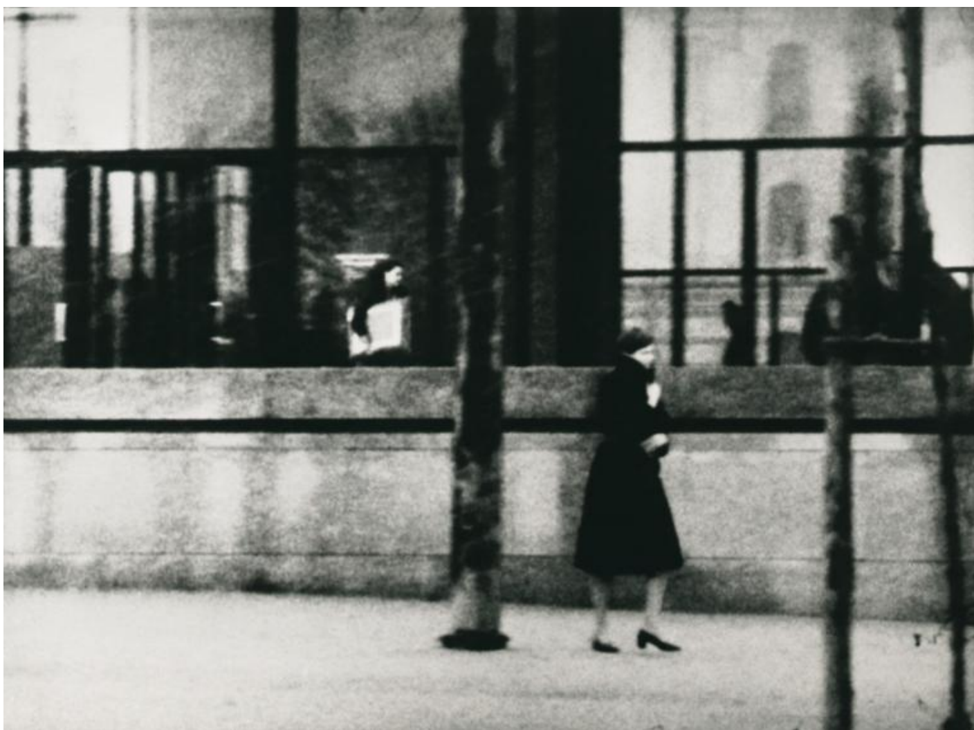
Ulay – il movimento diventa immobilità

Arrivato a Kreuzberg, raggiunge l'appartamento della famiglia turca, sostituisce il quadro al muro e scatta delle foto di Der arme poet con la famiglia turca sorridente attorno. Poi, scende in strada e da una cabina telefonica chiama il museo, chiede del direttore e dice: Mi chiamo Ulay sono un artista, voglio che venga a riprendersi il quadro a Kreuzberg e dà l'indirizzo. In pochi minuti l'isolato è circondato da forze speciali in assetto antisommossa. Il direttore del museo assieme a poliziotti, ispezionano increduli il quadro (fortunatamente incolume) nel salotto della famiglia turca e arrestano Ulay. Il giorno dopo per la prima e unica volta, Ulay e la sua action fanno la prima pagina dei maggiori quotidiani tedeschi. Arrestato e condannato, dopo tutte le attenuanti, a 56 giorni di reclusione, Ulay esce di galera su cauzione e scappa in Olanda (non potrà più mettere piede in Germania per anni). Ciò che più colpisce di There is a Criminal Touch to Art , questo il titolo che darà alla action , e che rimarrà una costante nel lavoro di Ulay, è l'aver concepito e affrontato l'azione, basandosi e facendo leva esclusivamente sul proprio corpo – agilità, velocità, nervi saldi. Il solo corpo, nudo e vulnerabile, diventa strumento e linguaggio artistico nonché di lotta politica. “Non ho mai pensato che con l'arte si possa cambiare il mondo. Ma porre l'attenzione su questioni scomode, questo sì”.