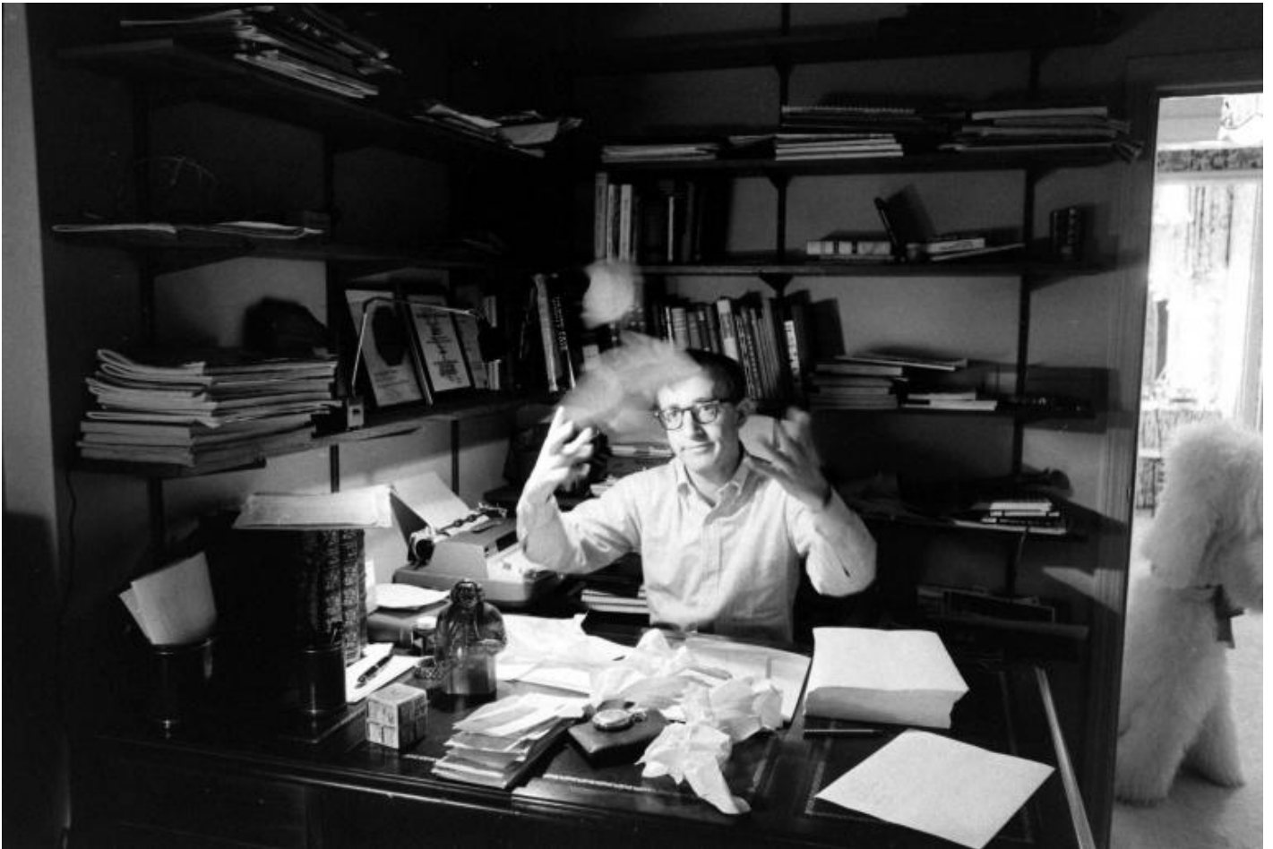
Allen al lavoro nel suo studio, 1967.

La prima parte della sua autobiografia, allora, non fa altro che indicarci dove guardare: la New York anni '40 della sua giovinezza, i tanti criminali da strapazzo (primo fra tutti il papà) che gli sfarfallano intorno, le strade di quartiere di Brooklyn, lo stupore della sua prima volta a Manhattan, i film di Bob Hope, le sue prime volte come illusionista, stand up comedian, musicista di jazz, autore televisivo, vanno via tutte d'un fiato. Ritroviamo molte di queste suggestioni nei suoi film. Come si diceva, non come autofiction , ma al contrario come ambientazioni, orizzonti poetici da piegare alle necessità della prossima storia. Non è, nei film di Woody Allen, un singolo personaggio a dire di lui, sono le nostalgie, la caratterizzazione delle sue strampalate maschere, il loro essere legate da un comune destino poetico, che egli dirige come un deus ex machina : dimostrare l'inconsistenza dell'esistenza in nome del primato delle illusioni, che prendono vita attraverso la scrittura.