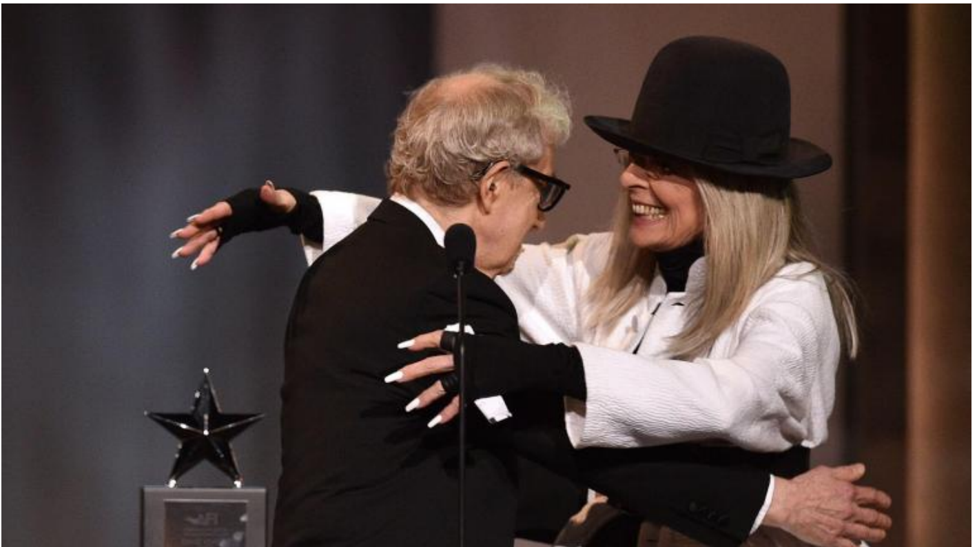
Allen con Diane Keaton nel 2017.

Parallelamente, alla sua vertiginosa ascesa artistica viaggia il racconto della sua ricca vita sentimentale che segue le tappe della sua formazione. Con Harlene, la prima moglie, egli si sposa giovanissimo. Sarà proprio grazie alla benestante studentessa che egli potrà sperimentare l'indipendenza economica ed esistenziale, mettendo su casa per la prima volta. C'è poi Louise Lasser, consorte in seconde nozze, bellissima attrice, anche lei colta ed elegante rampolla di buona famiglia. La loro relazione verrà segnata dalla malattia mentale di lei e si consumerà – fra “tormento ed estasi”, repentine euforie e strazianti cadute depressive – stancamente fino al divorzio. In mezzo, arriva Keaton (che lui ama chiamare per cognome), la mitica Diane protagonista di Io e Annie e di alcuni fra i più bei film di Woody. Con lei la relazione durerà poco ma la loro amicizia è destinata a durare tutta la vita. Il racconto delle avventure fra donne e show business è pienissimo, rocambolesco al punto giusto, godibile, la parte migliore del libro, come si sostiene in una sorta di curiosa auto-recensione che il libro offre di se stesso verso la fine: Allen è pieno di affetto e nostalgia per le sue donne con cui si vanta di essere ancora in contatto (“Le donne della mia vita sono state tutte dalla mia parte: Harlene, Keaton, Louise, Stacey”).