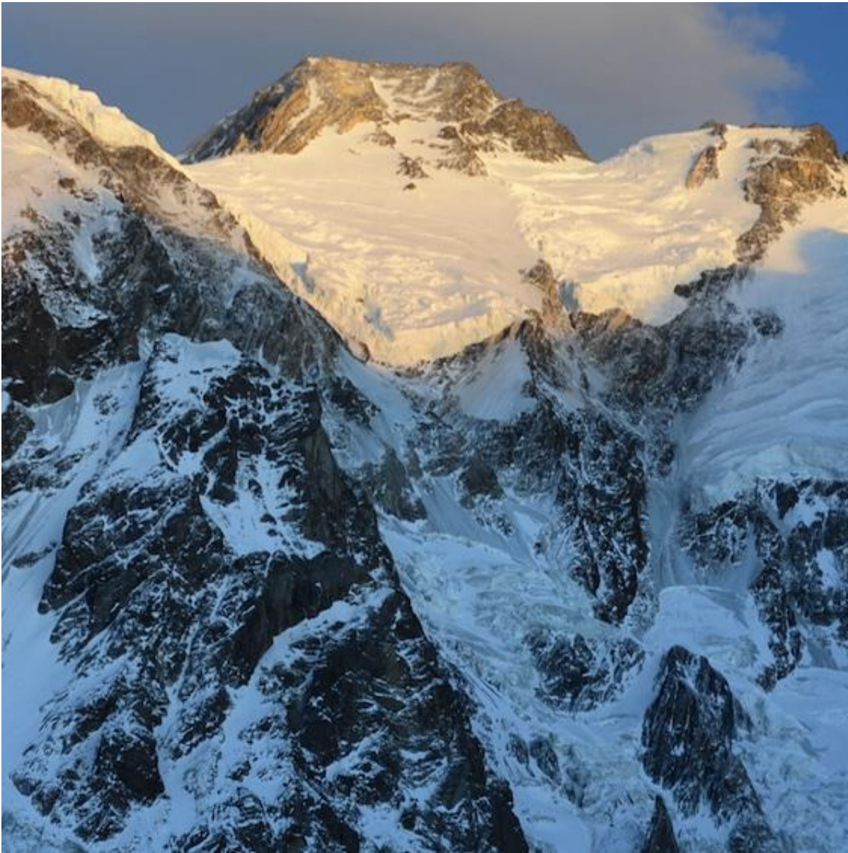
Il Nanga Parbat, sulla sinistra lo sperone Mummery.