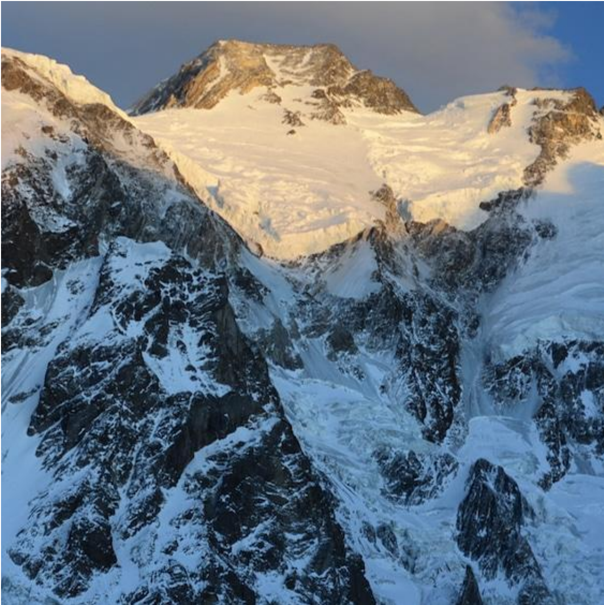
Il Nanga Parbat, sulla sinistra lo sperone Mummery.