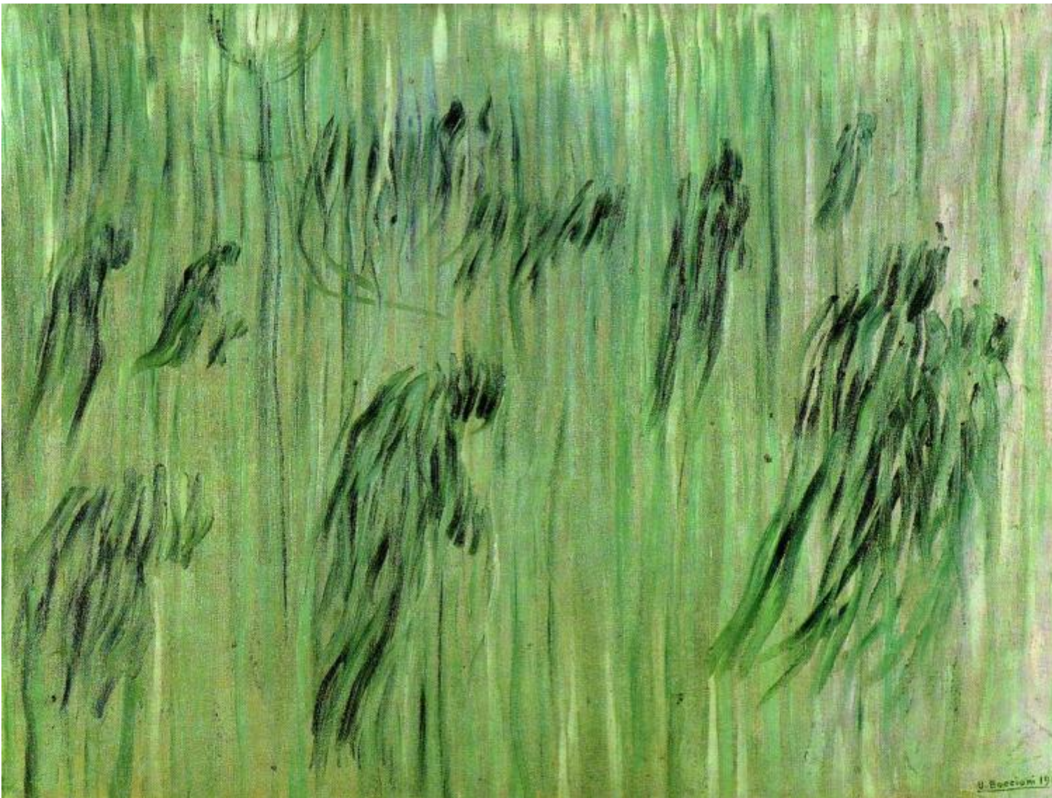
Umberto Boccioni, Stati d'animo - quelli che restano (1911)

Chi in questi giorni sta parlando del “ritorno del corpo”, in grado di aprire un varco nell’egemonia tecnologico-liberista che vede il corpo soltanto come un incidente e un’inesattezza, dimostra un certo sense of humour. A meno che non intenda dire che il corpo torna come mancanza. Il corpo ritorna, se oggi torna, come fantasma, perché è nella privazione che ci riviene in mente, inaccessibile, e ci manca. È questo che manca, nei nostri rifugi claustrali, circondati da schermi, tra lenzuolate di immagini intangibili anche alla vista, nella congestione arida e necessaria della tecnologia. Tutto da remoto. Senza toccarsi, senza le mani, lo sguardo, il pezzo di strada fatto insieme. Ci mancano i corpi, ora inavvicinabili, senza i quali è difficile sentire il mondo, sentirsi al mondo. Oppure lo si sente, ma nella modalità della perdita, dell’angoscia. Nel dolore della negazione.