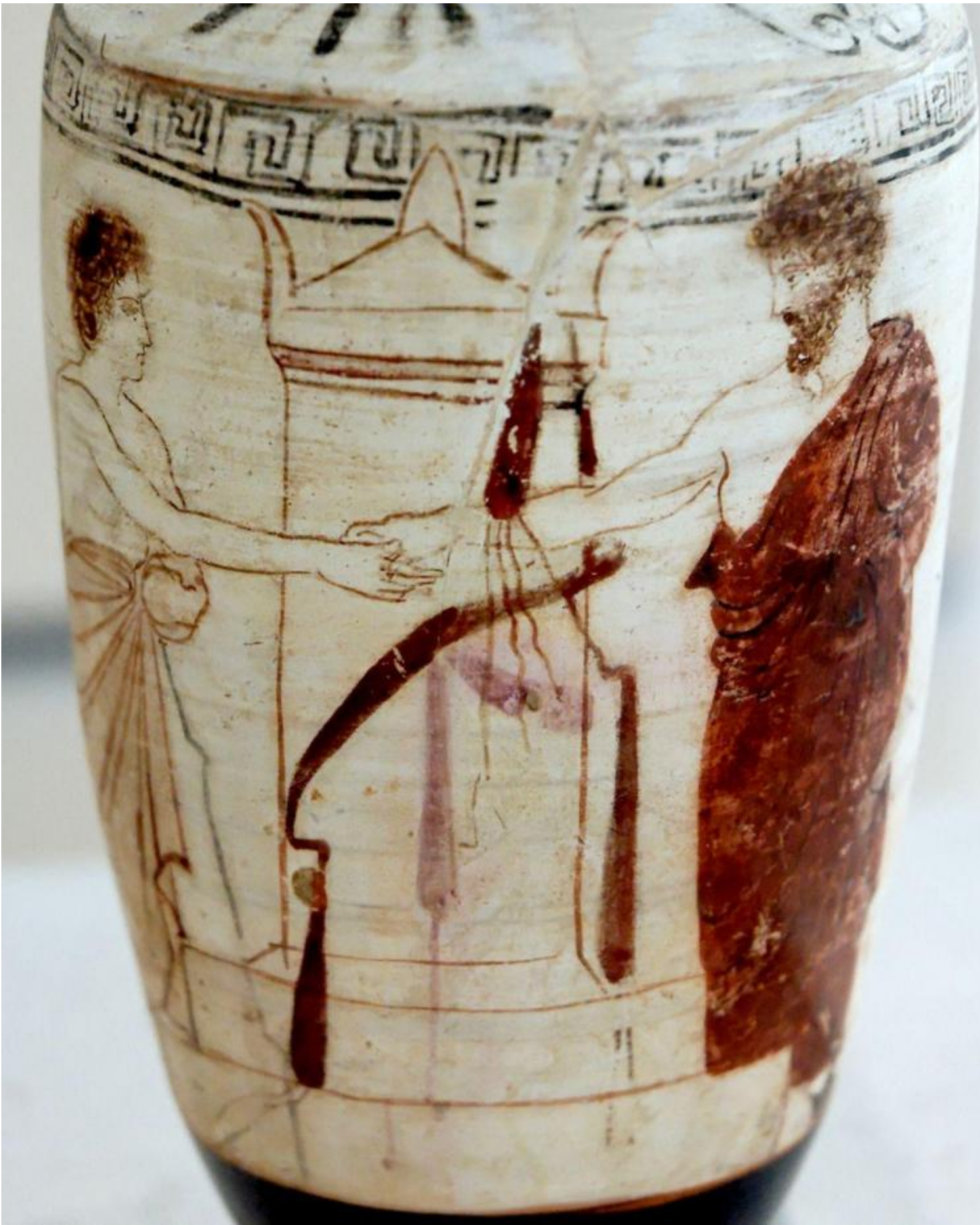
Attic white ground red figure lekythos, artist unknown, late 5th century b.C.