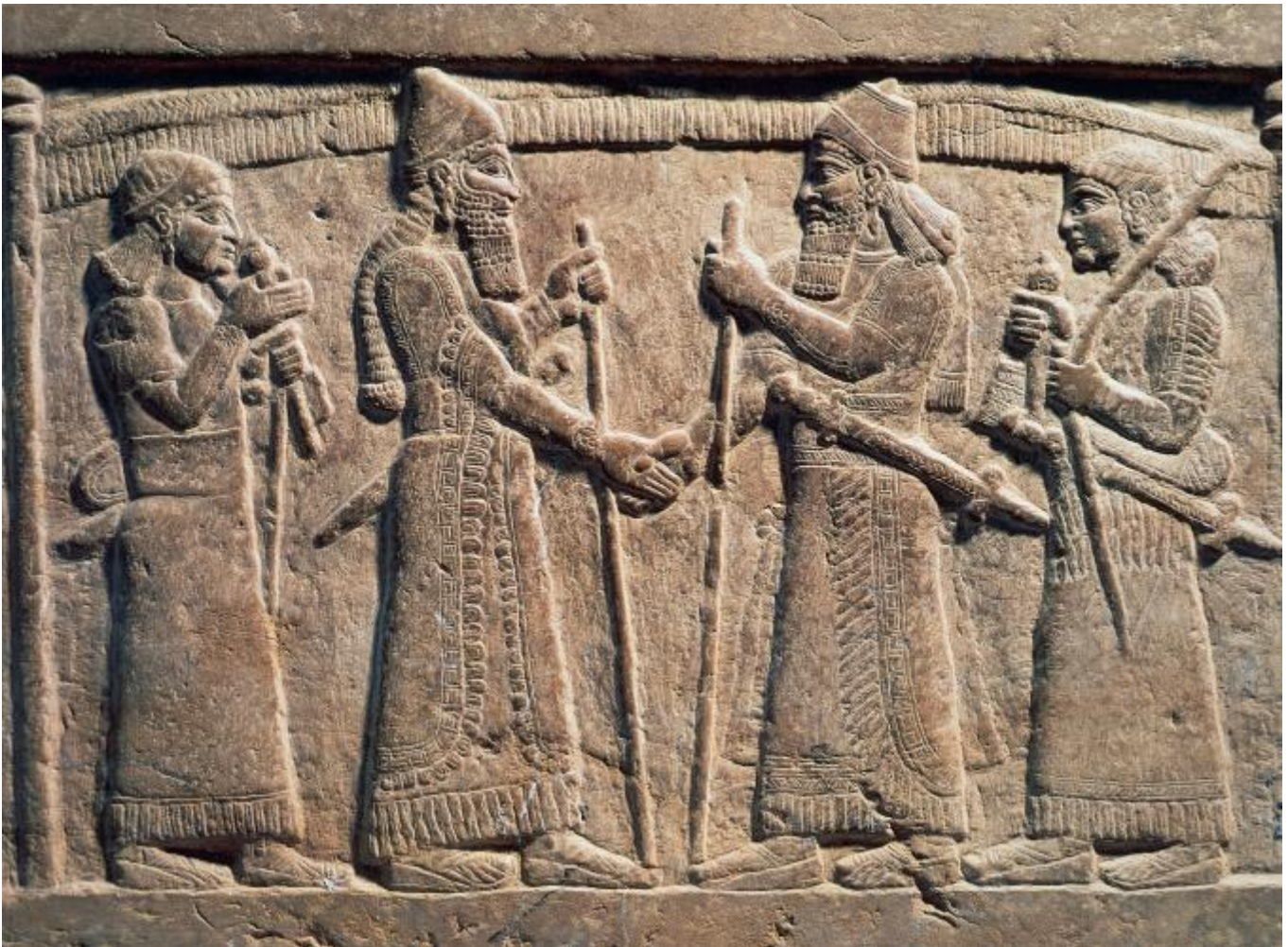
9th century b.C. stone relief depicts King Shalmaneser III of Assyria shaking hands with a babylonian

Per questo la stretta di mano segna un passaggio irto di pericoli, esposizione a incognite non controllabili. Senza conoscerci, diamo la nostra mano all'altro, prendiamo la sua, espressione e riconoscimento insieme, ci allacciamo per un momento. Questo salto quantico è una coreografia della fiducia. È inerme la mano che ne stringe un'altra, non può impugnare armi. E allora dire "piacere" per il nuovo incontro è quasi un rito propiziatorio, metamorfosi dello straniero in presenza grata, così come dirsi "incantati" (come si fa in alcune lingue) rivela che siamo entrati nella sfera d'influenza esercitata dall'altro, nel suo incanto.