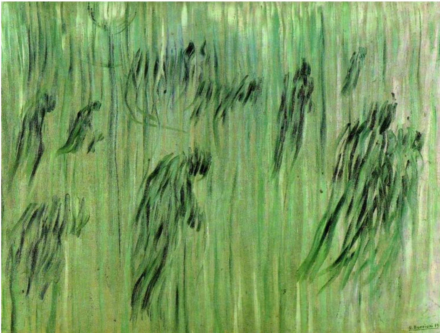
Umberto Boccioni, Stati d'animo - quelli che restano (1911)

Chi in questi giorni sta parlando del “ritorno del corpo”, in grado di aprire un varco nell’egemonia tecnologico-liberista che vede il corpo soltanto come un incidente e un’inesattezza, dimostra un certo sense of humour. A meno che non intenda dire che il corpo torna come mancanza. Il corpo ritorna, se oggi torna, come fantasma, perché è nella privazione che ci riviene in mente, inaccessibile, e ci manca. È questo che manca, nei nostri rifugi claustrali, circondati da schermi, tra lenzuolate di immagini intangibili anche alla vista, nella congestione arida e necessaria della tecnologia. Tutto da remoto. Senza toccarsi, senza le mani, lo sguardo, il pezzo di strada fatto insieme. Ci mancano i corpi, ora inavvicinabili, senza i quali è difficile sentire il mondo, sentirsi al mondo. Oppure lo si sente, ma nella modalità della perdita, dell’angoscia. Nel dolore della negazione.