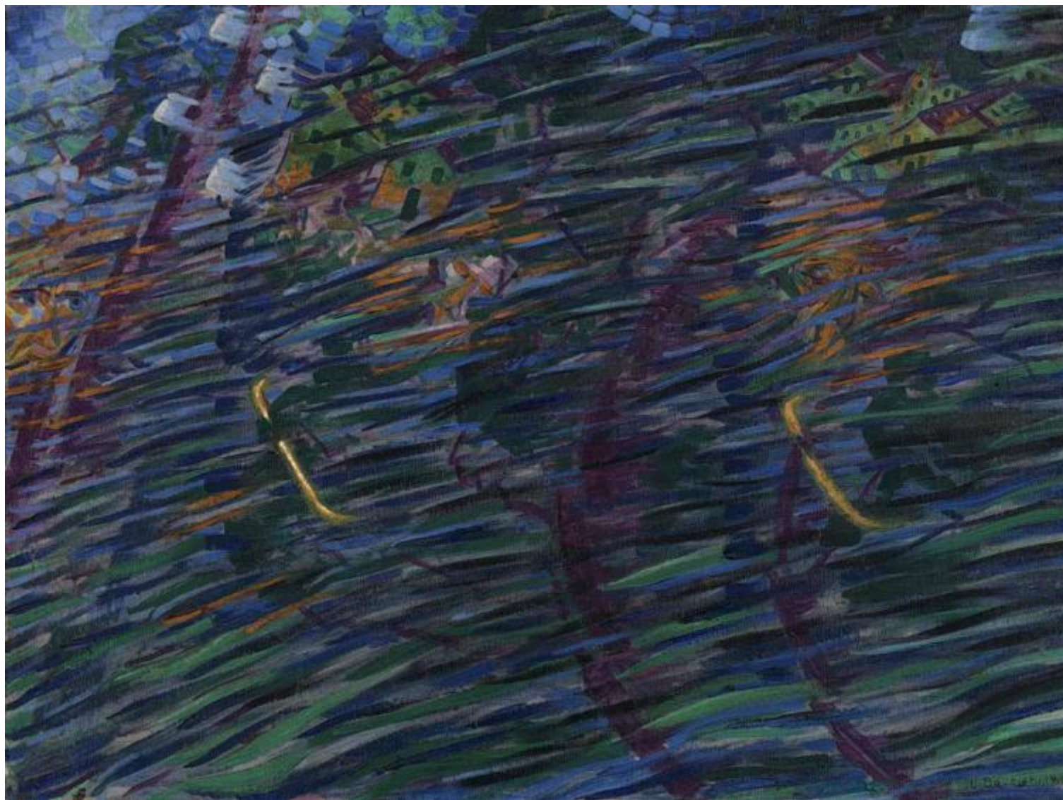
Umberto Boccioni, Stati d'animo - quelli che vanno (1911)

Non si stringono più le mani, incontrandosi. Sebbene di rado, fuori ci si incontra ancora, chi per lavoro, per quei lavori rimasti aperti, chi nelle uscite fugaci dalla tana, per le provviste e le necessità. Ma il movimento della mano, che pure si protende in saluto verso l'altro come per moto proprio, si frena a mezz'aria, esita, poi si prolunga solo nell'intenzione, e fisicamente recede.