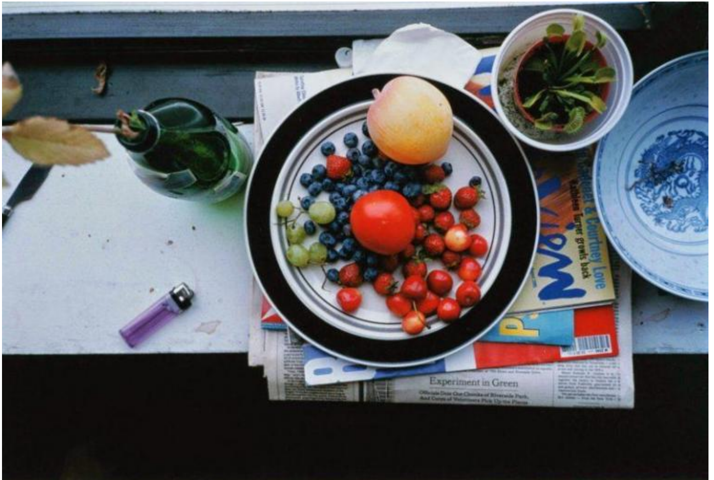
Opera di Wolfgang Tillmans.

Come è inutile fare pronostici sul futuro, nello stesso modo non ha senso parlare del Covid-19 come di un "trauma collettivo". Dal punto di vista dell'inconscio, un trauma non corrisponde ad una situazione concreta, nel nostro caso la pandemia. Ci sono troppi fattori che intervengono, e il fatto che sia collettivo non cambia l'affare. resta quindi ad ognuno di noi di trovare il modo di reagire di fronte a questa esperienza inattesa, sicuramente inusuale, ma non necessariamente traumatica.