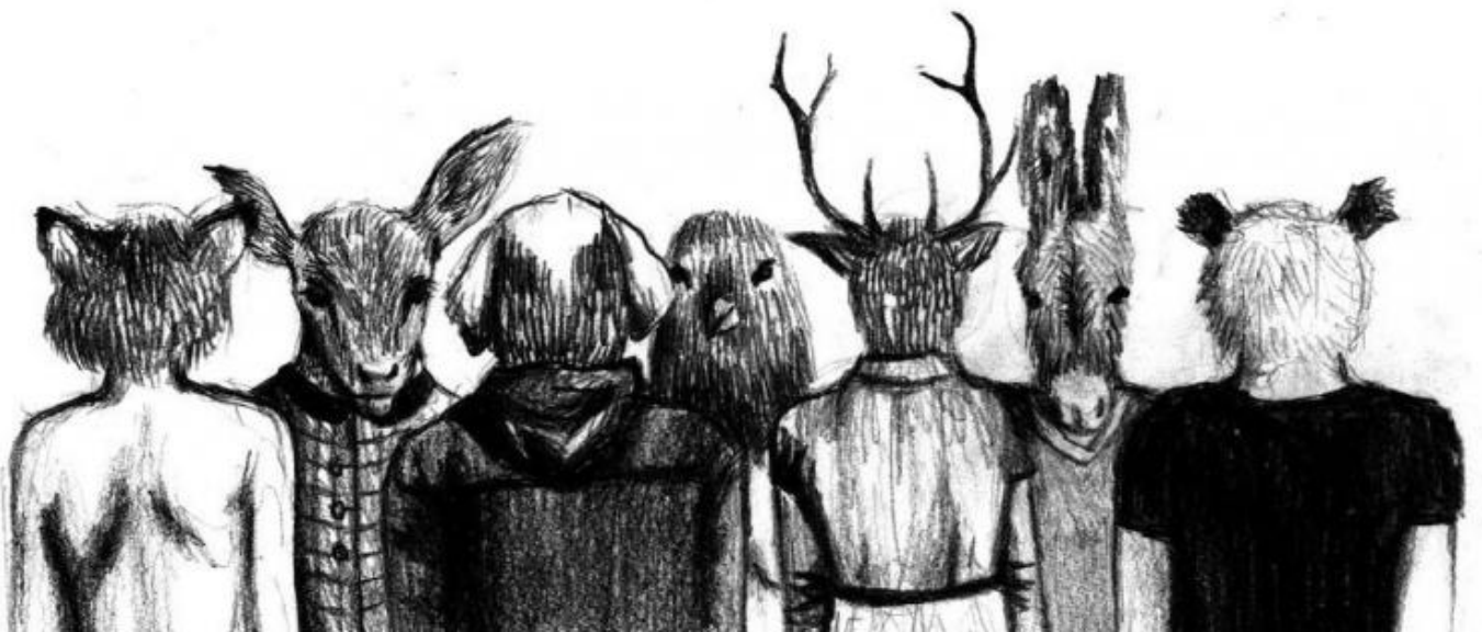
“Comunità”, di Rojna Bagheri.

« “El Comandante” ci saluta a medio alzato su Skype, dalla webcam piazzata ad arte sul boma del windsurf risoluzione strategica numero 6, tavola da 107 litri, vela da 6 metri, occhiali bianchi a specchio, “El Comandante” nel vento e fatevi fottere tutti quanti, voi e il movimento»