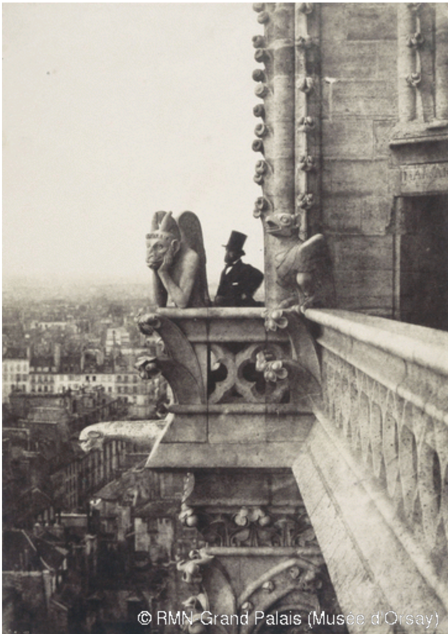
C. Nègre, Il vampiro, 1853

Vampiri (e pipistrelli) possono sopravvivere alla fine del mondo?