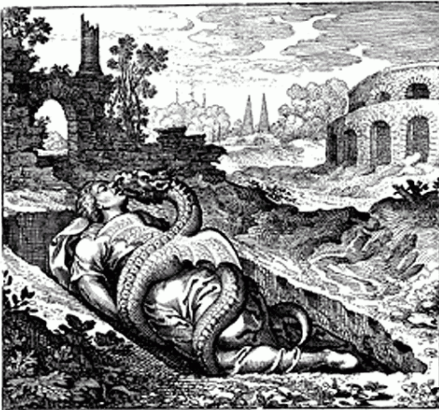
M. Maier, Atalanta Fugiens, Emblema L, incisione di M. Merian, 1617

Il collegamento con il pipistrello è alla base di una delle più antiche estensioni del termine vampiro, usato dal naturalista Buffon per designare una specie ( Desmodus rotundus ) che si riteneva aggredisse animali e persone nel sonno per succhiare loro il sangue. Questa associazione - rara nella tradizione ma che diventerà sempre più frequente soprattutto nella letteratura e nel cinema - ha un riscontro documentato nel folklore rumeno, secondo il quale un pipistrello, volando su un cadavere, poteva dare origine a un vampiro.