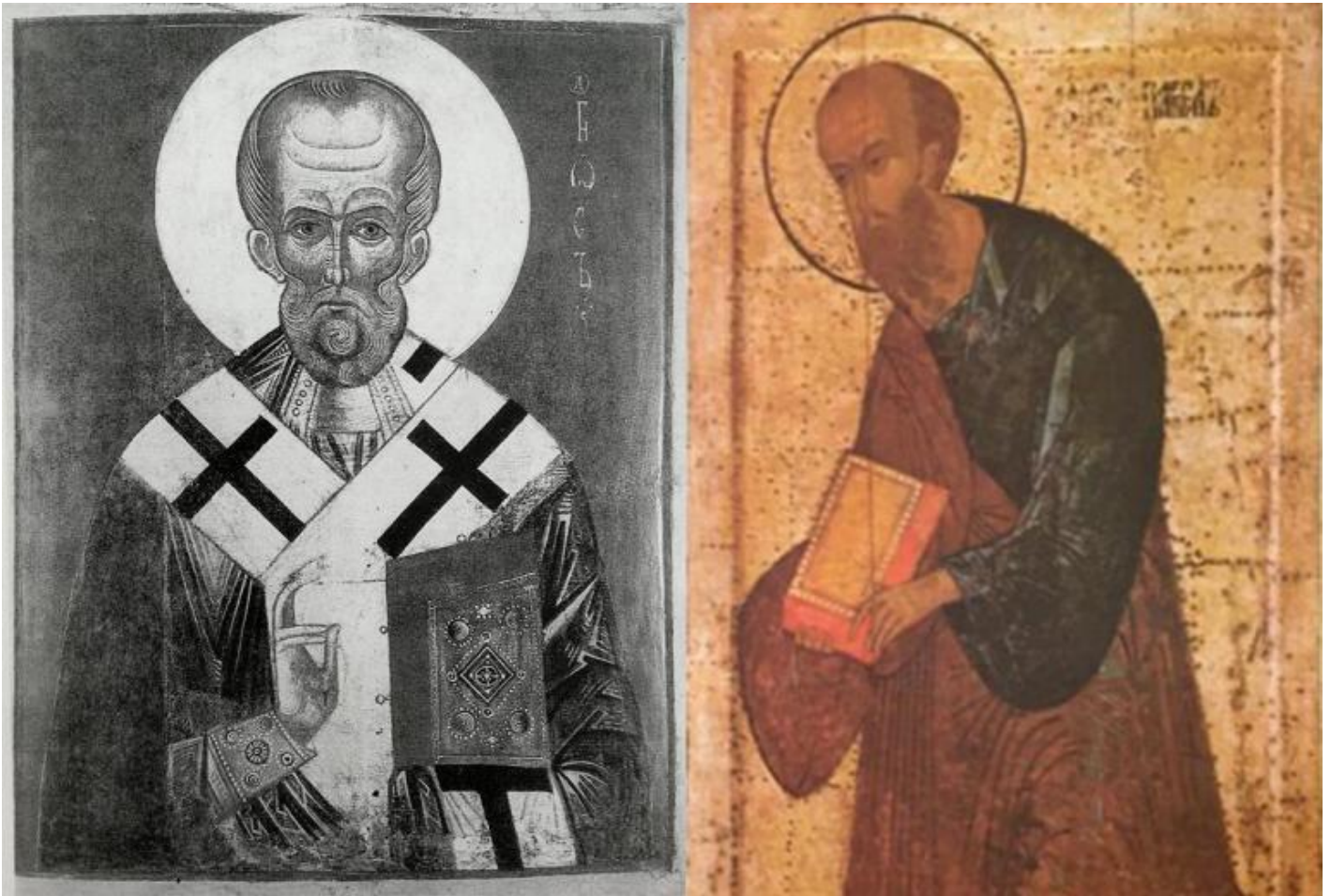
L'Apostolo Pietro, XII-XIV secolo, Galleria Tretiakov, Mosca / L'Apostolo Paolo, 1502 circa, Galleria Tretiakov, Mosca.

Florenskij s'impiglia nell'interpretazione dei passi di Vitruvio giungendo all'errata supposizione che la prospettiva "focalizzata" fosse nota nella Grecia del V secolo a.C., ma non sbaglia quando afferma che questa prospettiva è solo "uno dei possibili schemi di raffigurazione, che corrisponde non alla percezione del mondo nel suo insieme, ma semplicemente a una delle possibili interpretazioni del mondo" (p. 20). Non sbaglia neppure quando attribuisce alla prospettiva, sia essa "monocentrica" o "policentrica", una funzione simbolica.