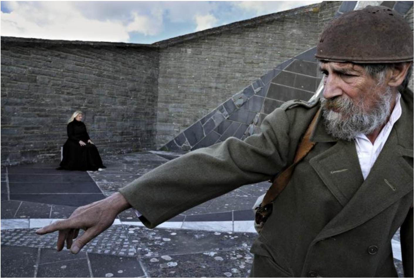
“Agamennone”, da Eschilo, 2010.

Le alternative possibili? «Ci siamo rivolti a vari comuni, per provare a trovare uno spazio alternativo. Alcuni hanno espresso tutta la loro solidarietà, altri, come Firenzuola, nel cui territorio è il Cimitero, hanno negato ogni dialogo. Stiamo discutendo col Comune di Bologna e con la Regione Emilia Romagna. Un'alternativa sempre possibile è spostare il nostro Pro e contra Dostoevskij a Monte Sole, nel parco che rievoca la strage nazifascista. Vi abbiamo già ambientato varie azioni, collaboriamo stabilmente con la Scuola di pace di Monte Sole. Ma non è facile riambientare in un altro luogo uno spettacolo pensato su uno spazio così connotato. Al Cimitero militare della Futa abbiamo anche dedicato un libro, Teatro di Marte , pubblicato in una nostra collana (si può richiedere scrivendo al sito www.archiviozeta.eu , ndr)».