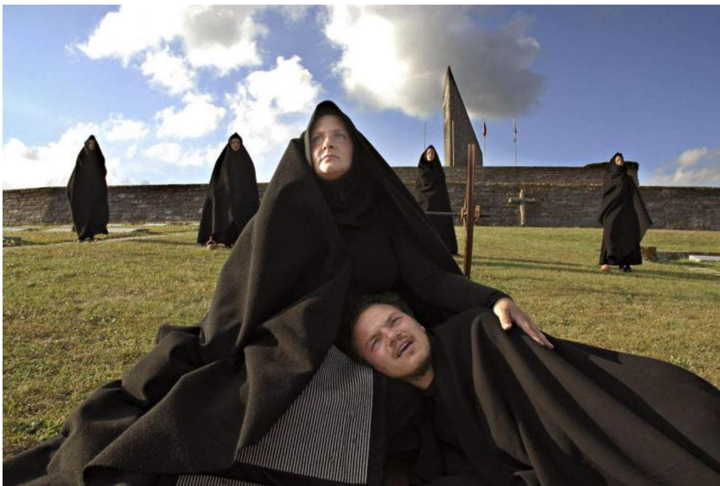
“Coefore”, da Eschilo, 2011.

È sorprendente questo spettacolo in mezzo ai boschi, in un luogo che ispira sentimenti contrastanti, la violenza cieca, per l'appunto, e la pace conquistata a prezzo di tante vite. È brechtiano, pasoliniano, ronconiano e perfino ispirato fortemente alle cartesiane, umanissime, aperte visioni ideologiche di quei geni che sono stati Jean-Marie Straub e Danièle Huillet, brechtiani radicali di fine novecento. È freddo, straniato, semplicemente, con grazia, destabilizzante. Ma è pure qualcosa di originale, un atto poetico che riduce il testo antico all'osso per andare a scalfirne le incrostazioni e portarlo a quello che contiene di ancora vivo, di perennemente bruciante. Un "teatro di parola" come lo sognava Pasolini, capace di diventare rito democratico, controversa analisi per via di fantasmi dell'immaginario del nostro stare, singolarmente e in comunità, nel mondo.