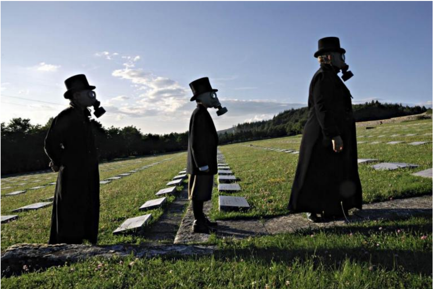
“Gli ultimi giorni dell’umanità”, da Karl Kraus, 2014.

Ma lo spettacolo questa estate non si farà. Prima di raccontare perché, provo a narrare il teatro fuori dell’ordinario di Archivio Zeta, riprendendo vecchi articoli del 2012, scritti con la felicità di aver scoperto qualcosa che veramente cambia lo sguardo.