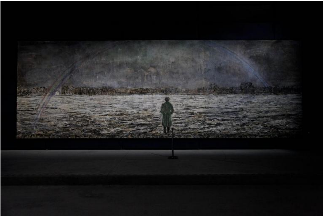
Die deutsche heilslinie, Anselm Kiefer, Hangar Bicocca.

Francesca Rigotti ha ben presente queste cose, ma sceglie di imboccare un'altra direzione, quella di dare sostanza al buio ponendolo allo stesso livello della luce senza con questo volerlo separare da essa e anzi mostrandone la pari dignità e la complementarità, come nella volta stellata, "che tiene insieme il buio e la luce... che si alternano nelle posizioni attore/sfondo in relazione alla prospettiva di chi guarda" (p. 113 ). E lo fa cominciando a pensare ciò che in esso vi è di positivo andando a rintracciarne semi e ricorrenze nella storia della cultura occidentale, attraverso esemplificazioni di grande spessore e fascino, con una scrittura limpida e varia, e a volte (giustamente, dato che si tratta anche di decostruire pregiudizi diventati abitudini di pensiero consolidate e irriflesse) persino maliziosa, con un'arguzia che purtroppo non è molto frequentata dai filosofi, forse per il timore di sminuire il lor pensiero, di apparire poco seri. Il pensatore non ride. A ridere è la servetta tracia, quell'oca giuliva.