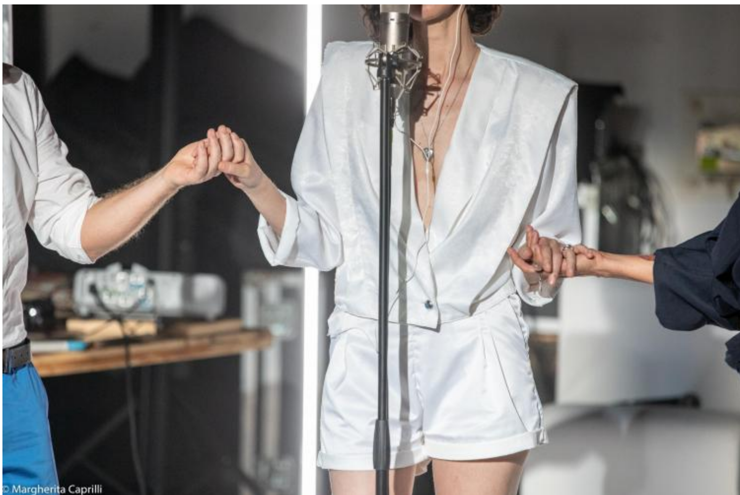
La mappa del cuore, Ateliersi, ph Margherita Caprilli.

Ai miei occhi di spettatrice lei, giocando su confini che si confondono, femminilità potente in un corpo androgino, mi è sembrato che tenesse qualcosa del "sono diversa" che attraversa le lettere: ti chiedo di