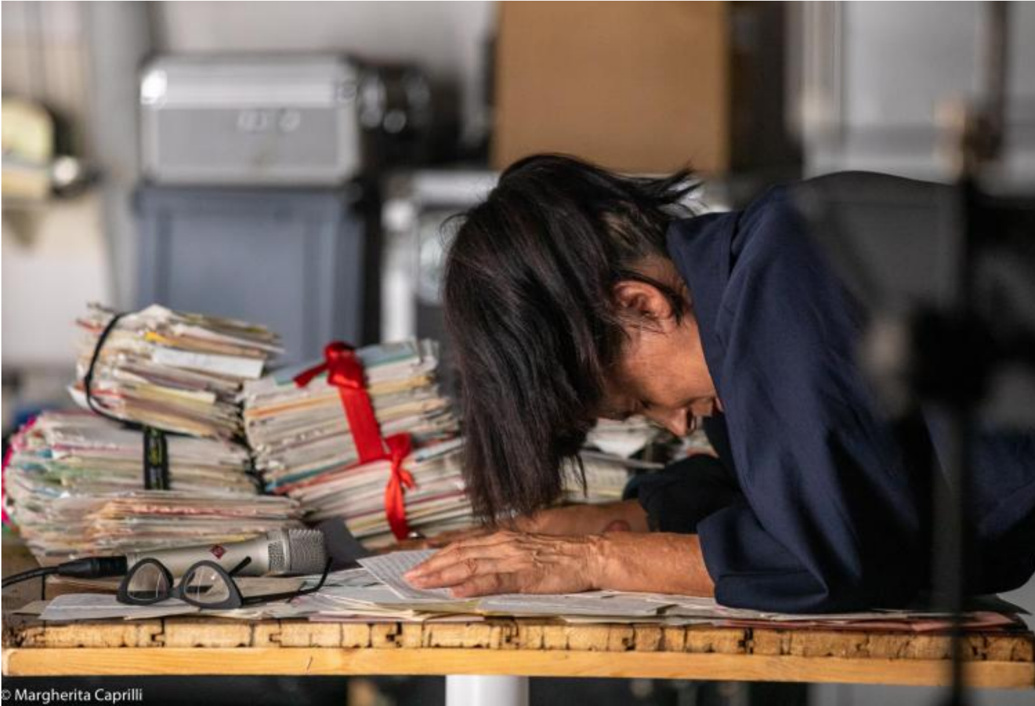
La mappa del cuore, Ateliers