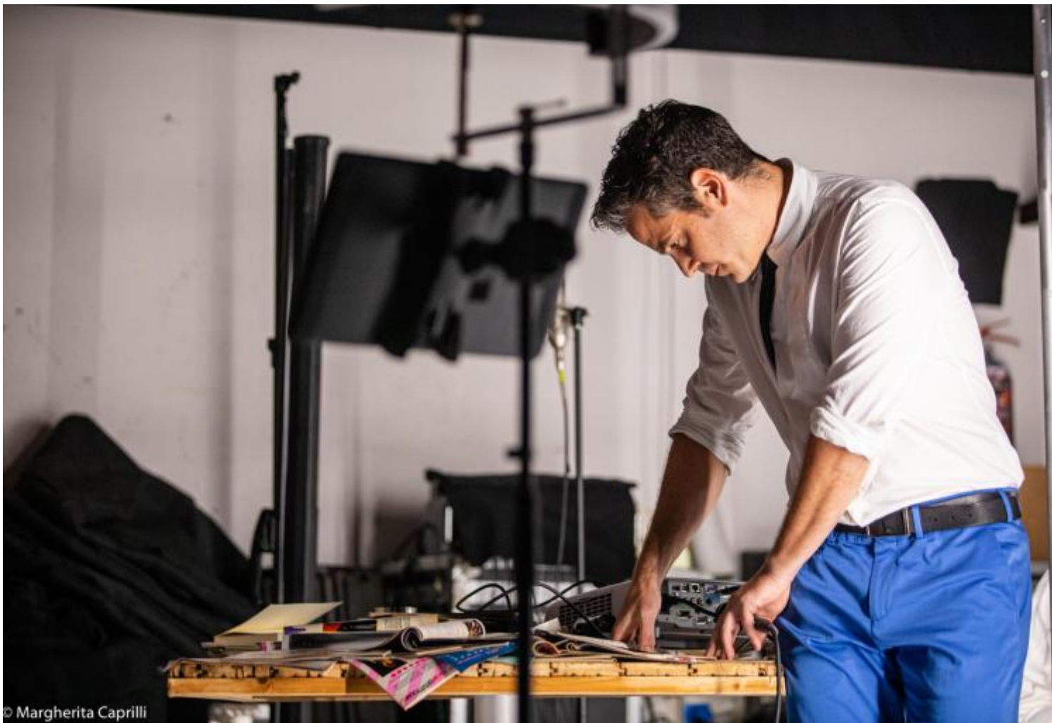
La mappa del cuore, Ateliersi, ph Margherita Caprilli.

LM: Volevo tornare sul tema della legittimazione di cui ha detto Andrea: erano gli anni in cui venivano meno i confini tra privato e pubblico, si modificavano profondamente. Il femminismo parla di personale-politico: scoprivamo che nella vita personale c'è un patrimonio di cultura che riguarda non solo il rapporto tra i sessi, ma esperienze universali dell'umano. Il femminismo è stato il fenomeno che ha raccolto questo cambiamento profondo in modo più esplicito.