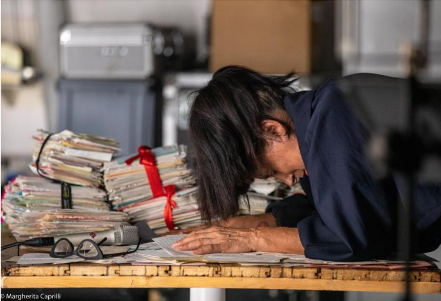
La mappa del cuore, Ateliersi, ph Margherita Caprilli.

le contrapposizioni, che tendono a ricomporsi in armonia. Venivo da dieci anni di femminismo, avevo l'attitudine all'ascolto delle vite, ma la tematica dell'amore nel femminismo non c'era stata ed era mancata l'attenzione a quell'età particolare che è l'adolescenza, età di passaggio dalla famiglia alla società, in cui sei anche un corpo che deve prendere forma in modelli imposti per secoli. Un'età delicata, dominata da senso di inadeguatezza e solitudine: chi dà ascolto a quel momento della vita? Forse, se ho avuto un'empatia tanto profonda, nonostante avessi più di trent'anni, è perché conservavo qualcosa della mia adolescenza, eredità dei miei anni faticosi nella casa contadina. Ho continuato a ritornare alle macerie della mia adolescenza, resto la figlia di quei genitori poveri che mi hanno dato il privilegio dello studio, un'adolescente a vita che non ha mai smesso di guardare film d'amore. E mi permetto di pensare che se Fiorenza e Andrea sono stati lettori così in sintonia è perché qualcosa della adolescenza lo portano addosso: basta guardarli.