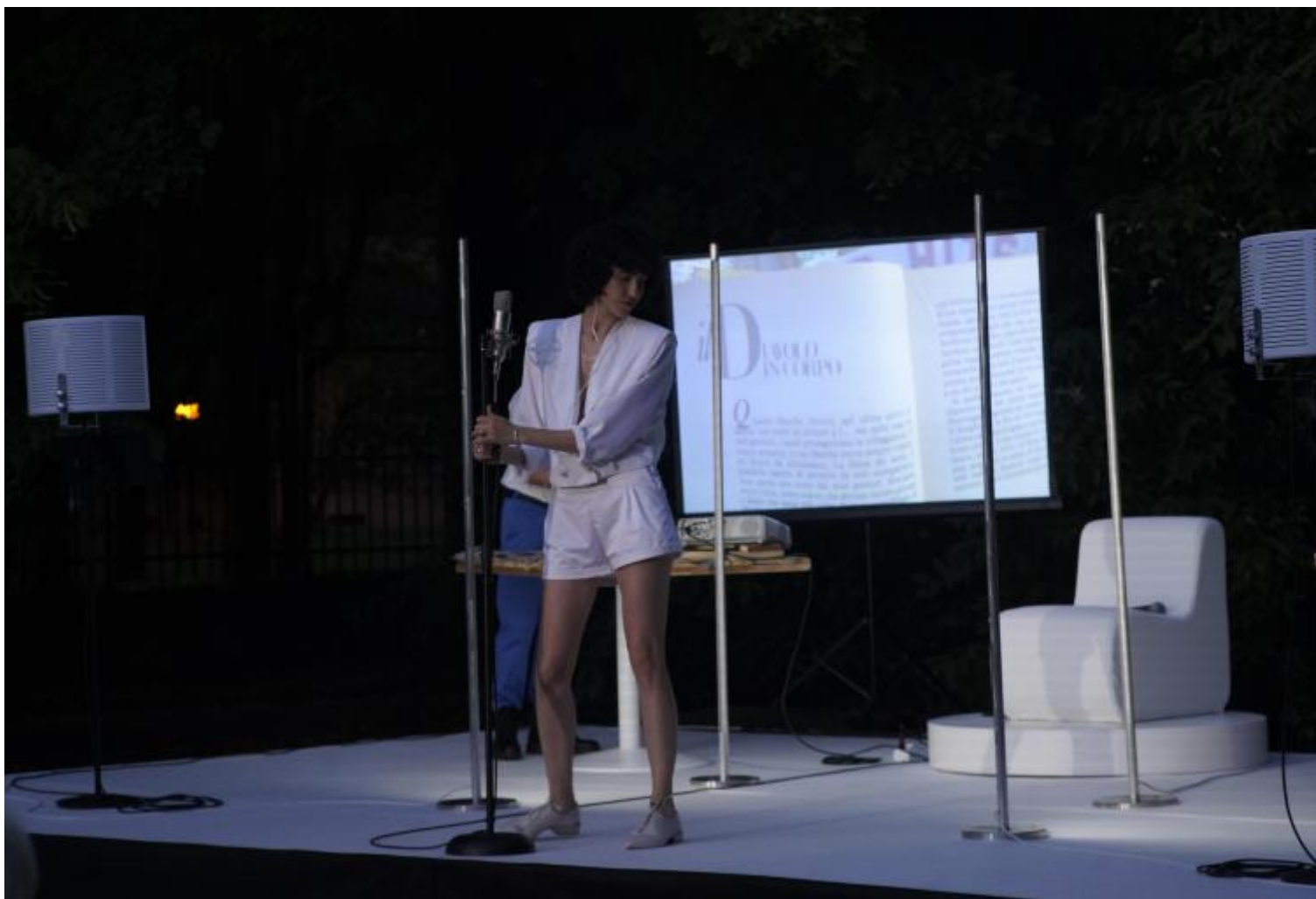
La mappa del cuore, Ateliersi.

E avendo i corpi, i grandi assenti da tanta parte del discorso culturale. E da qui mi pare che non posso non domandarvi della presenza in scena di Francesca.