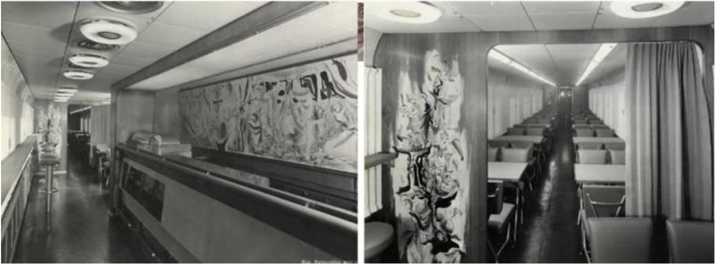
In alto: copertina del libro di Giulio Verne, Dalla Terra alla Luna, Edito da Sonzogno; pubblicità francese dell'ETR 330, detto Settebello; veduta del treno al suo ingresso alla Stazione Centrale di Milano. Sotto: il bar e la sala ristorante.

Nel Settebello il tradizionale marrone che aveva caratterizzato le livree dei treni FS nei decenni precedenti venne sostituito da due colori raffinati e innovativi, un grigio nebbia di fondo con due fasce verde magnolia sulle fiancate, una all'altezza dei finestrini e l'altra sull'estremità inferiore. Ma quel treno si distingueva soprattutto per il frontale bombato, simile a quello dei Jet, specialmente americani, lungo il cui profilo correva un vetro panoramico. Al suo interno era alloggiato un belvedere con un salottino di prima classe dotato di undici posti a sedere a cui i viaggiatori potevano accedere a turno. Sopra di esso, in posizione leggermente arretrata, si trovava la cabina di guida che, sebbene avesse finestrini più piccoli del normale, offriva un'ottima visuale ai macchinisti, proprio grazie alla sua altitudine.