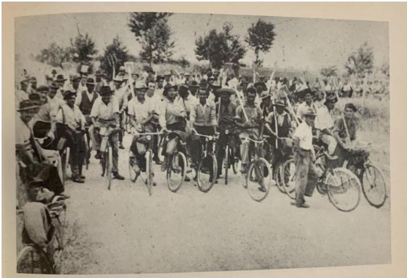
Sciopero bracciantile nelle campagne ferraresi, 1949.

con la Fantastica (invocata nella prefazione della Grammatica della fantasia ), con suggestioni del surrealismo e con l'incontro e l'ascolto di bambini e ragazzi, creeranno il Rodari che conosciamo, quello appunto delle Favole al telefono e della Grammatica della fantasia .