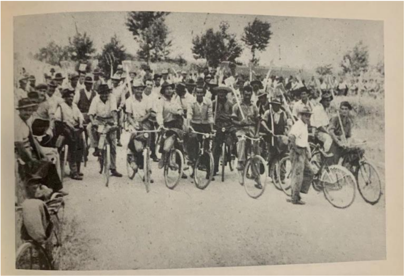
Sciopero bracciantile nelle campagne ferraresi, 1949.

Ma finora mi sono concentrato ad accennare a questioni di definizione e di contesto. Il Manuale per me ha un ben altro fascino.