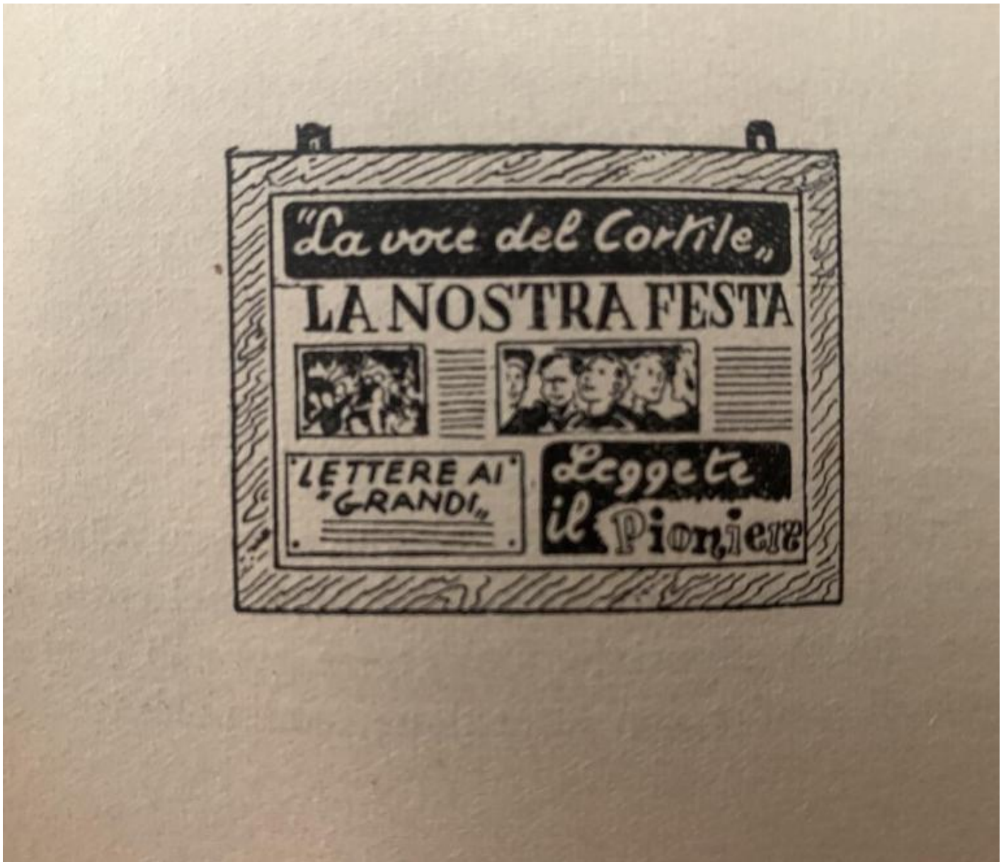
Esempio di giornale murale, dal "Manuale del pioniere".

Nel Manuale del pioniere Rodari avanza idee che prefigurano un nuovo tipo di pedagogia, abbastanza in sintonia con punte avanzate del pensiero didattico come quello del francese Celestin Freinet e il coevo (1951) Movimento di cooperazione educativa.