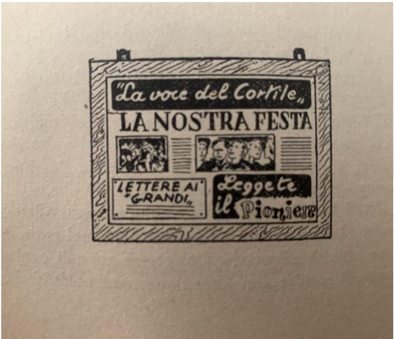
Esempio di giornale murale, dal "Manuale del pioniere".

attraverso le realizzazioni sociali e civili, ma anche con la cultura e un'organizzazione diversa della vita, che mettesse l'individuo e la società e non il profitto al centro. Quel libro e gli altri in case che una volta erano di poveri braccianti analfabeti o con poca scuola racconta lo stesso impegnato compitare le lettere dell'alfabeto per imparare a leggere e a scrivere, e il susseguente conoscere e ragionare, di cui parla Giuseppe Di Vittorio. Racconta un'Italia che voleva staccarsi da servitù ancestrali anche con l'istruzione, la conoscenza. Ecco, il Manuale lo colloca in questo quadro, come riflessione su un'educazione diversa dei futuri cittadini.