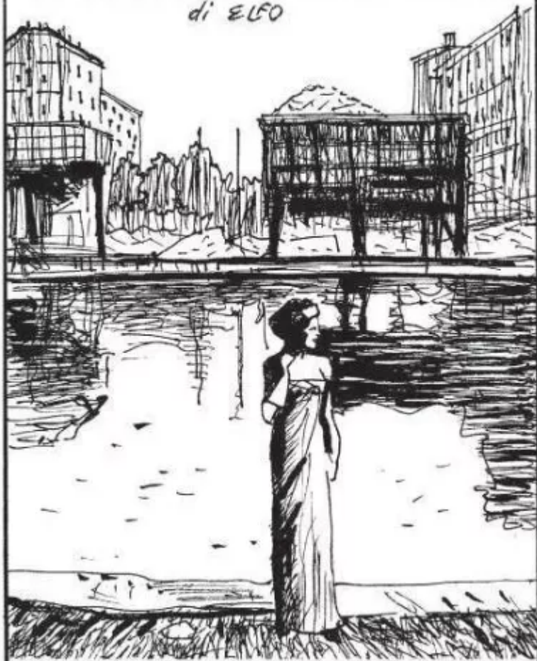
Milano. Da una foto di Ugo Mulas. Modella sulla Darsena, 1958.