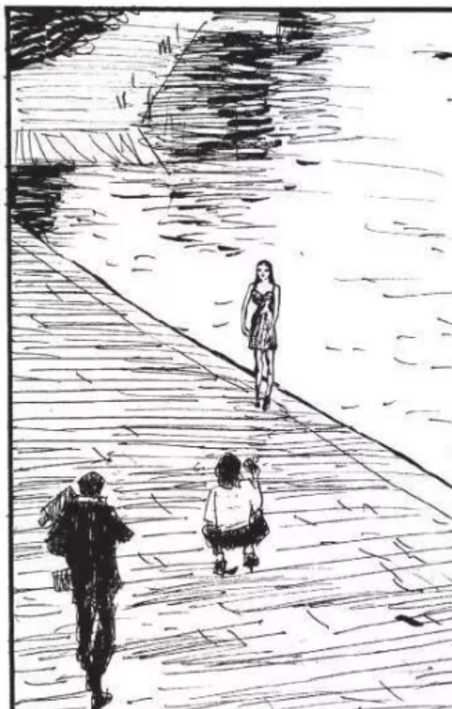
Modella sulla Darsena, 2017.