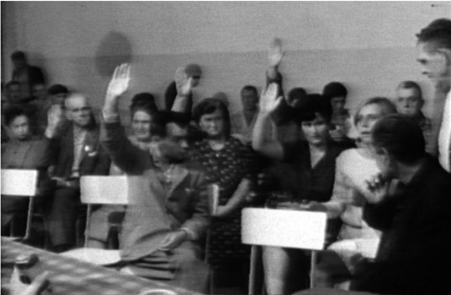
Assemblea all'interno dell'ospedale psichiatrico di Gorizia, tratta la La favola del serpente