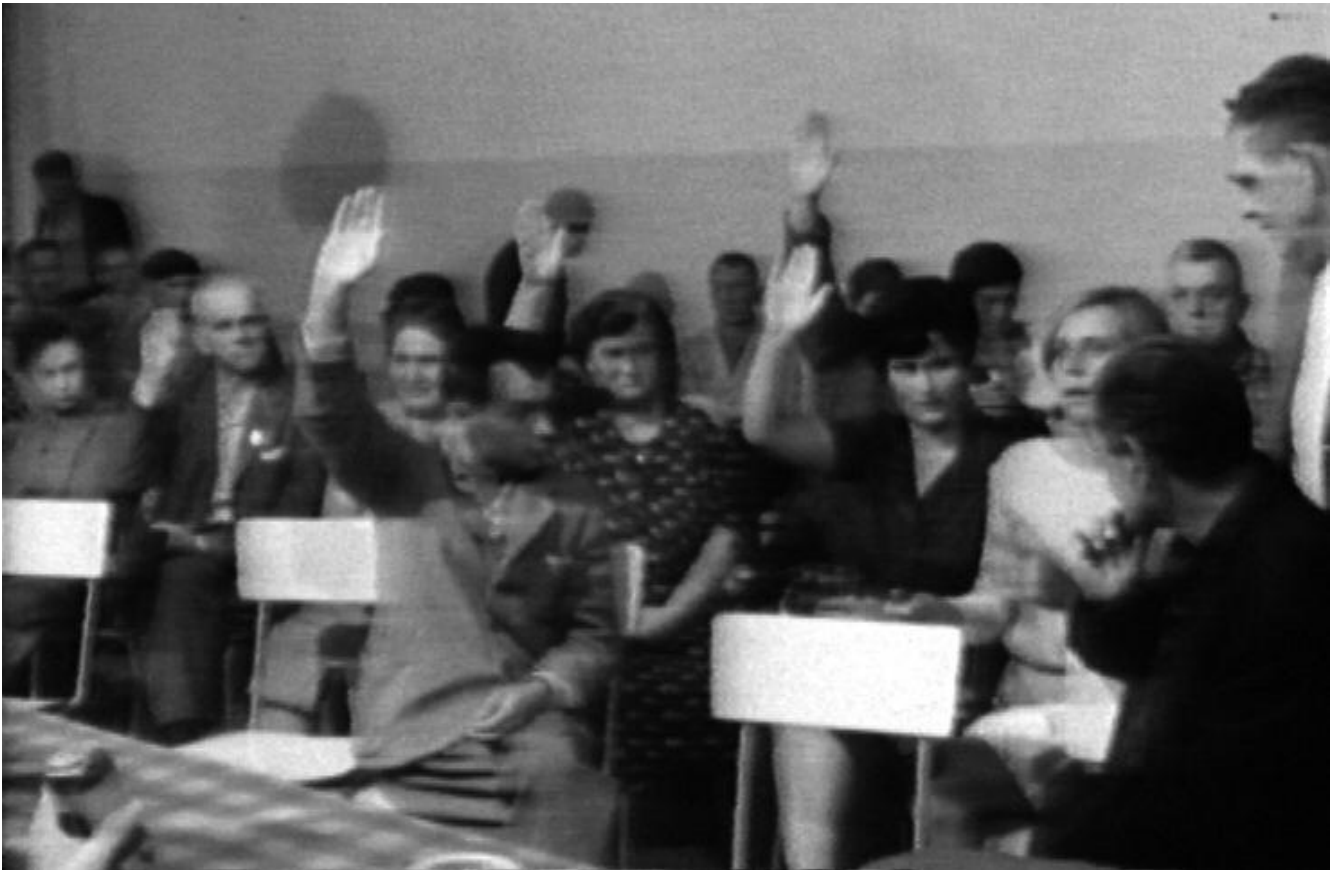
Assemblea all'interno dell'ospedale psichiatrico di Gorizia, tratta la La favola del serpente