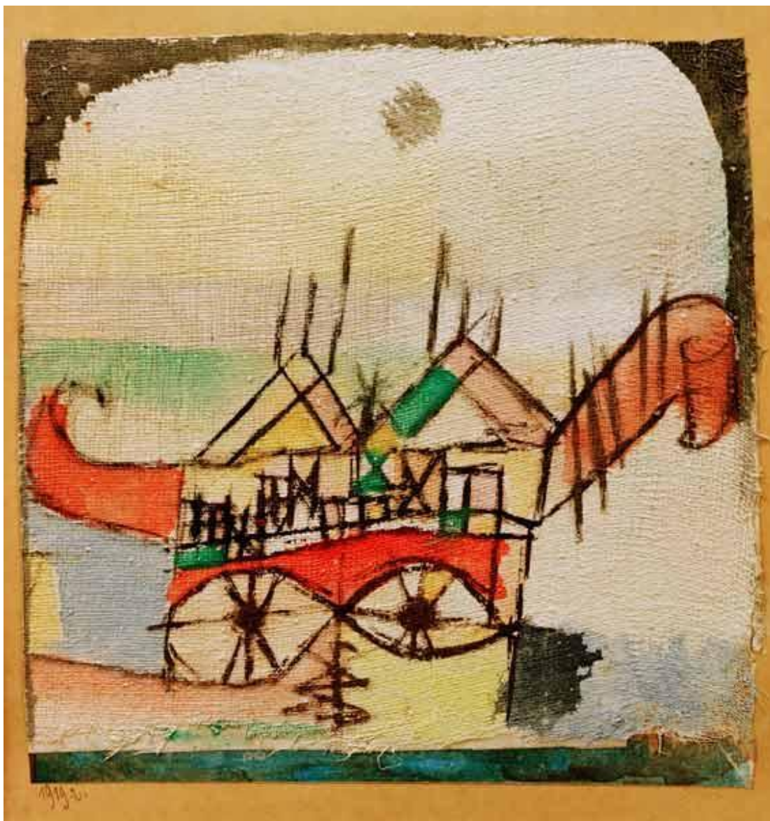
Paul Klee, Sphinxartig , acquarello su garza e carta, 1919.

è stato e resta maestro indiscusso. E ha mostrato bene, ai tanti che vedono nella semiotica solo una «scienza dei segni», come recita il dizionario (congelando una disciplina in un sintagma inadeguato a restituire anche il solo pensiero di Ferdinand de Saussure), o peggio ancora un prontuario per la decifrazione di codici, o una macchina per fabbricare fredde strutture, che la semiotica è piuttosto un modo per rendere conto del fatto che ogni oggetto, ogni evento, e ogni opera d'arte – ogni testo, nella sua irriducibile specificità – non replica significati univoci, fissi e già dati, ma è il risultato di una fine tessitura ( textus , appunto) di campi di forze e di senso che si può cogliere e descrivere, per poi accorgersi che è proprio grazie a quel « veder doppio » che attinge alla struttura senza dimenticarsi della singolarità che si può comprendere meglio anche la superficie, così ricca, delle cose.