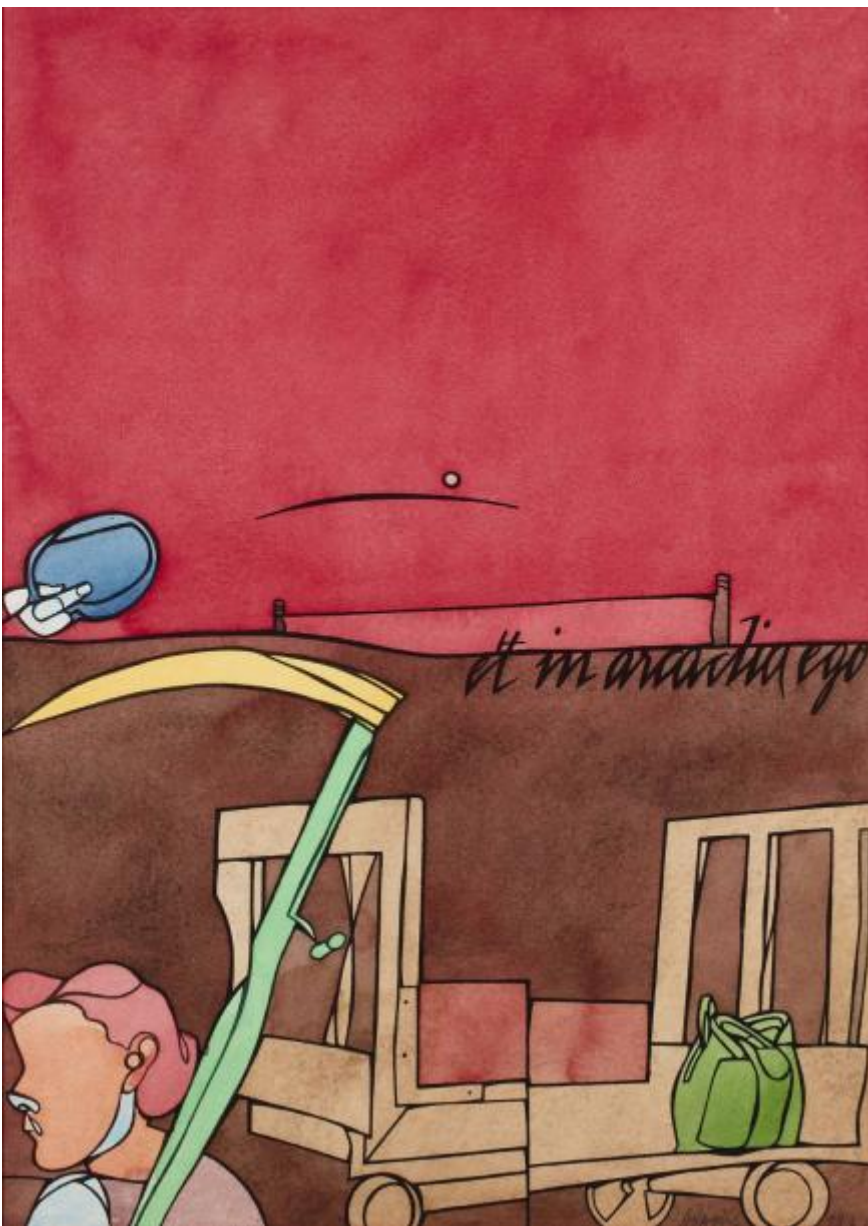
Valerio Adami, Et in Arcadia Ego , acquerello su carta, 1977.

Per questa ragione, annota Fabbri, per accostarsi al meglio, dall'esterno, a questa linea così ricca che non ha bisogno di «accessori analitici», «le migliori letture sono quelle che hanno esplicitato, per quanto possibile, la sottigliezza e la grazia dei dispositivi che costruiscono la “maniera” di Paul Klee. E che hanno potuto reperire non l'unicità ma la molteplicità di senso, non una generica ambiguità o reversibilità, ma la rigorosa ed esplicita stratificazione dei significati».