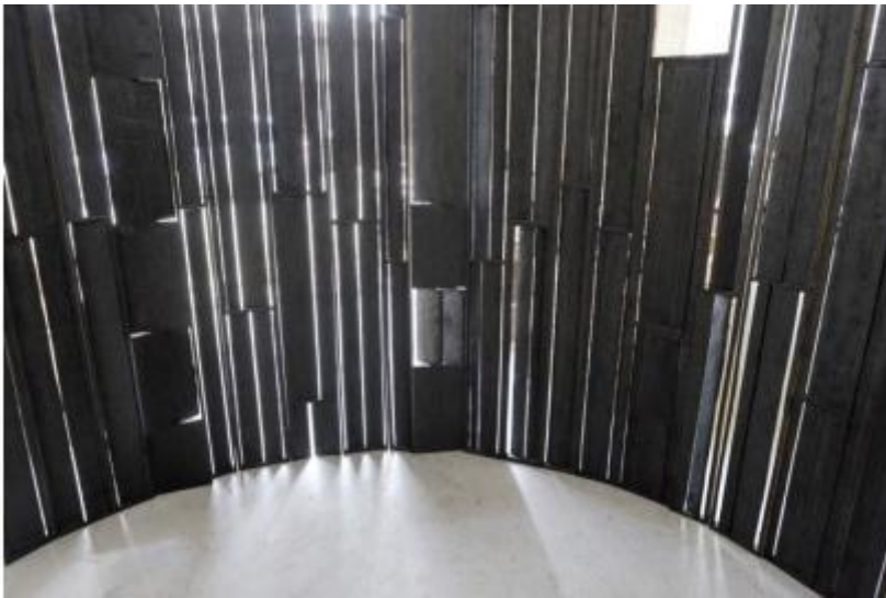
Nunzio, Sarai D'Ombra, legno, 2013.

Su Valerio Adami, per esempio, pittore e amico di semiologi e della semiotica, incessante combinatore di linguaggi e di segni, come nelle Sinopie , sua raccolta di taccuini, e in Et in Arcadia Ego , Fabbri si lascia andare a una vera e propria dichiarazione di poetica della sua propria ricerca: «Mi interessa, m'appassiona di più, ipotizzare o immaginare che l'attività del disegnatore, del pittore abbia un senso complessivo nel suo fare e nel suo dire su questo fare. Spetta al semiologo, alla sua maniera e ai suoi modi, intendere come Adami si serva non di un vocabolario iconologico preordinato, di unità di senso precedenti al testo, commisurate a una realtà oggettiva o soggettiva preesistente. E crei invece un lessico di segni, immanente ai suoi affreschi, quadri e disegni che sta a noi disimplicare.»