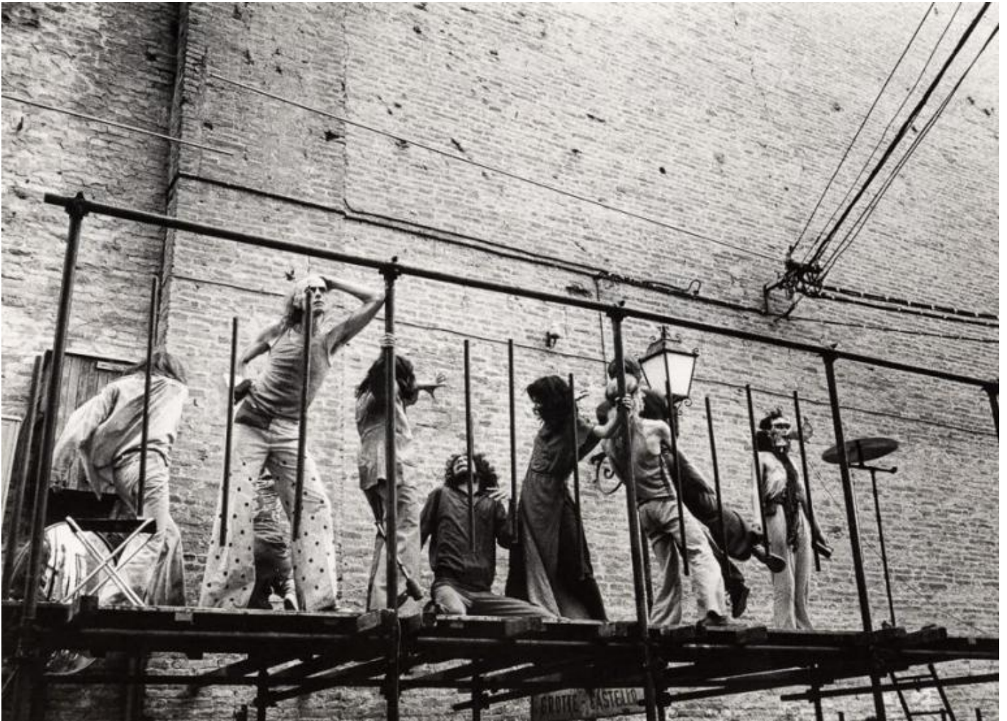
1980 - Il Living Theatre allo Sferisterio.