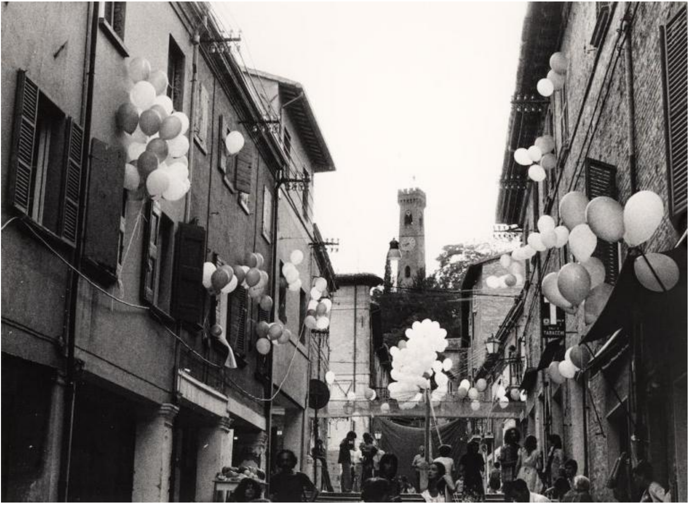
1978 – Il teatro in verticale, dall'archivio del Festival.

Dopo vengono gli anni di altre aperture: con Antonia Attisani che porta Laurie Anderson (tra gli altri) e introduce un teatro meno “antropologico” e più “freddo”, metropolitano, internazionale. Con il progetto, realizzato solo di recente in realtà, di dare continuità annuale al festival. Con la direzione di Ferruccio Merisi e il ritorno di Bacci e poi ancora il ritorno di Attisani, con uno sguardo curioso a nuove formazioni, giovani, imprevedute e imprevedibili (siamo agli albori degli scossoni sociali degli anni '90).