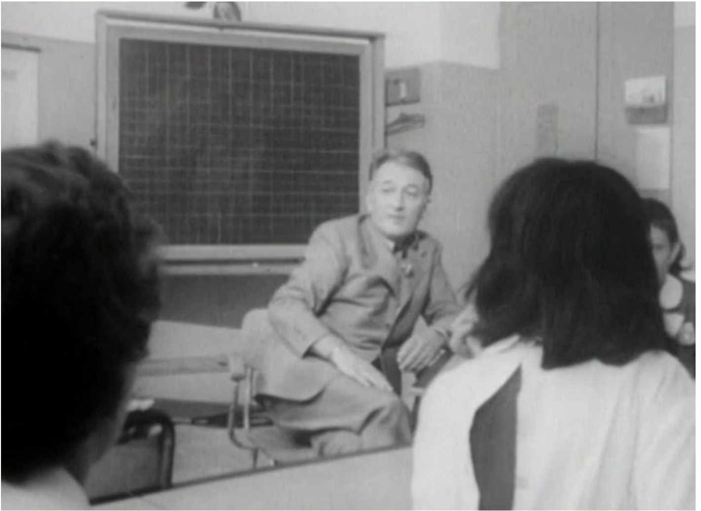
A scuola con Gianni Rodari (1975).