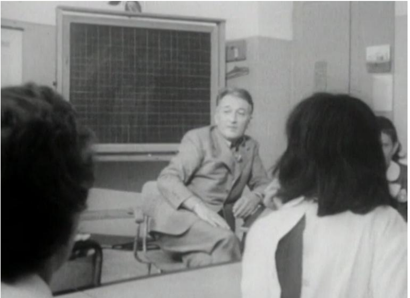
A scuola con Gianni Rodari (1975).

di tutti i giorni si riducano, o come nelle Favolacce dei fratelli D'Innocenzo si appiattiscano sullo stesso orizzonte che compete a un trafiletto di cronaca nera. Favole e fiabe hanno bisogno dei bambini, o più precisamente di tutto ciò che col passare dei secoli, sulla base degli studi di Philippe Ariès e di molti altri, possiamo dire che la società ha proiettato sulla propria idea di infanzia, prendendo a poco a poco le distanze da un mondo che spesso ha finito per racchiudere in gabbie dorate, e nei casi peggiori per disconoscere e mistificare. Un travaso del genere, per usare un'abusata metafora pedagogica, rischia di assomigliare allora all'abbandono di un abito dismesso, destinato alla fissità di una soffitta, più che all'atto di trasmissione che nell'idea rodariana della "favola al telefono" diviene gesto di amore e liberazione attraverso la fantasia - e questo spiega forse perché ancora oggi risulta spontaneo guardare al libro di Rodari come a un dono proveniente da un altro mondo, a qualunque età si leggano o ascoltino le sue storie.