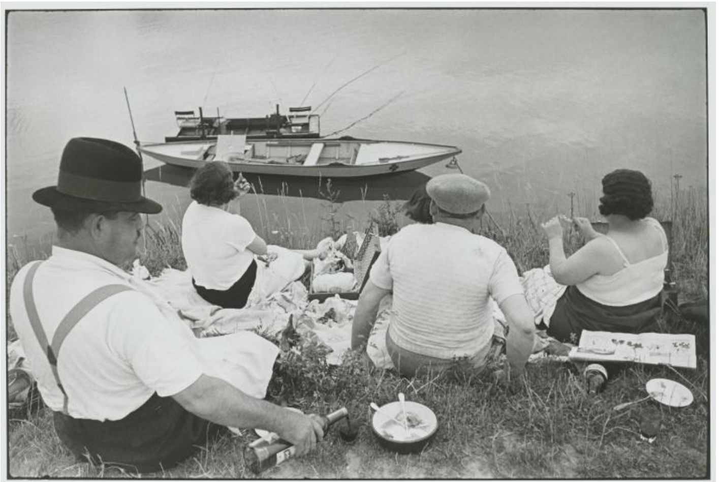
Henri Cartier-Bresson Dimanche sur les bords de Seine, France, 1938, épreuve gélatino-argentique de 1973 © Fondation Henri Cartier-Bresson / Magnum Photos.

Eppure, a ben riflettere, la potenzialità eversiva risiede nell’esatto opposto dell’enunciato. Dinanzi al perfetto equilibrio delle sue immagini scompare ogni aspetto legato alla cattura dell’istante, alla violenza insita nell’atto del colpire, si neutralizza l’immagine del fotografo come cacciatore. Di fronte alle sue immagini di reportage, si comprende come sia possibile arricchire lo spirito e dilettere i sensi. La facoltà che i teologi medievali attribuivano all’arte, ovvero docere et delectare , diventa l’anima delle sue immagini. Le domande che sorgono sono sempre le stesse: dove si trova il confine tra etica ed estetica? E l’estetica è superiore all’etica? In questo caso non vi è differenza: la giustizia coincide con la giustezza. “L’uomo e la sua vita, così breve, così fragile, così minacciata. [...] Io mi occupo quasi esclusivamente dell’uomo. I paesaggi sono eterni, io vado di fretta”, afferma Cartier-Bresson.