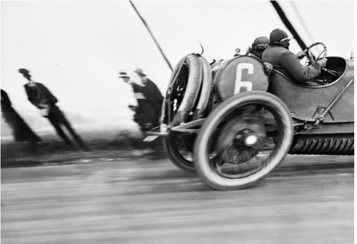
Jacques Henri Lartigue, Grand Prix de l'Automobile Club de France detta anche L'automobile deformata, 1913 ma diffusa da Lartigue nel 1912.