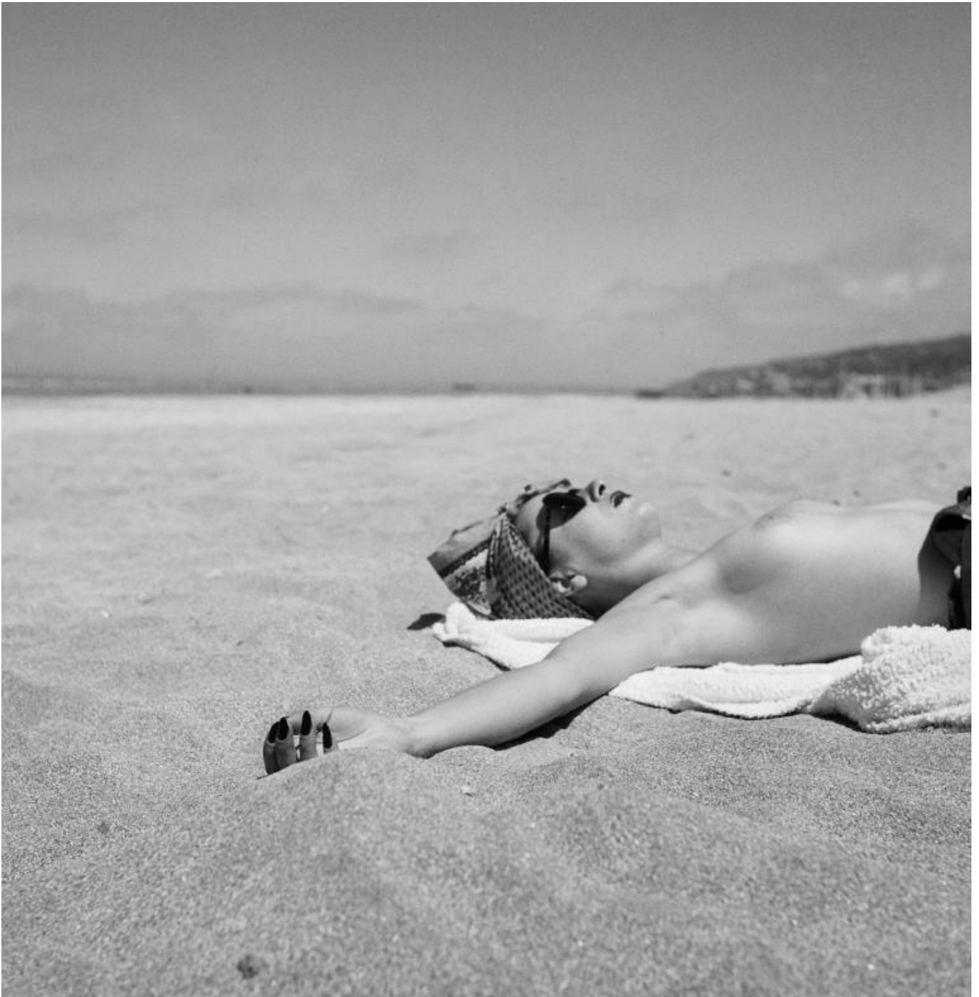
Jacques Henri Lartigue, Coco, Deauville, 1938.

La sua opera toglie peso alle figure umane, agli animali, alle città. La fotografia, che lui stesso definisce «arte del transitorio», non ha nulla di “pietoso” o di fisso. Lartigue sfugge a Medusa, non la guarda negli occhi. Come Perseo, vola con sandali alati e la leggerezza del suo sguardo solleva i soggetti delle sue immagini, li trae verso l’alto, ne evidenzia gli slanci, ne dispiega le forme. Estenua la materia senza annientarla. Le sue immagini sono eteree, fatte quasi di nulla: i merletti degli abiti femminili, le velette che coprono i visi, gli abiti gonfi di pieghe. E, ancora, una palla sospesa sopra la testa della domestica Dudu, una ruota d’automobile che sembra deformata da una potenza invisibile. Ogni elemento sembra fatto d’aria, è facile sollevarlo da un suolo che sembra addirittura non esistere, sfidando in ogni dettaglio la legge assoluta della gravità. Immagini cariche di mistero, tanto più attrattive in quanto prive di consistenza. Non ci sono tragedie, morti, sofferenza e nemmeno l’intenzione di trasmettere chissà quale messaggio edificante, non siamo