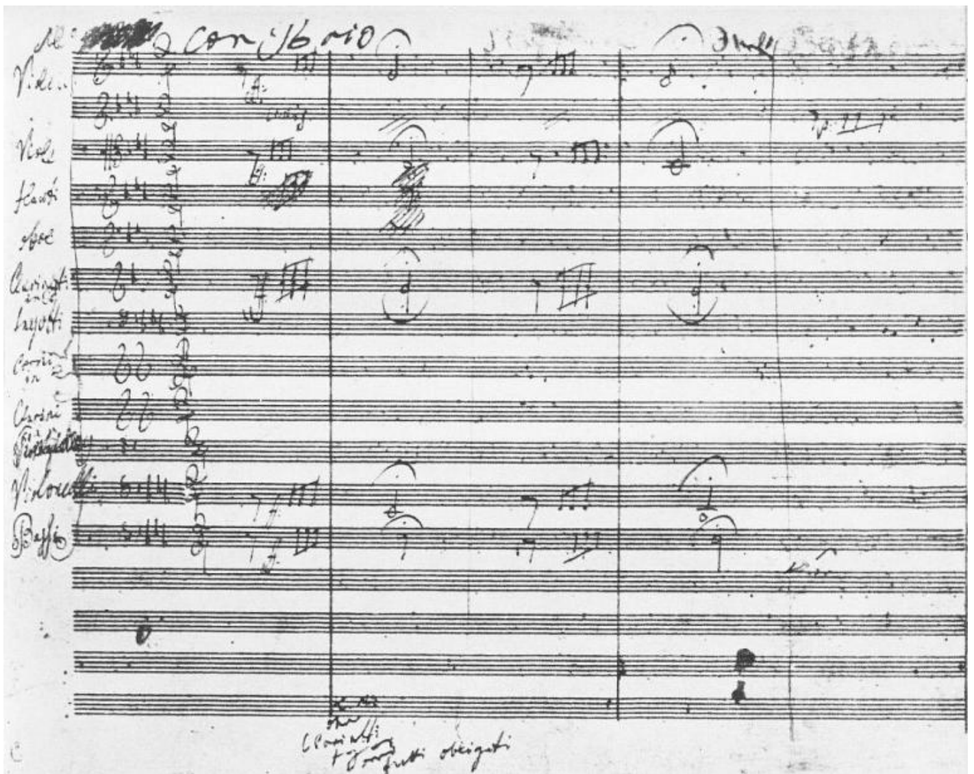
La prima pagina dell'autografo della Quinta Sinfonia.

A ricevere questa investitura è la forma che Haydn e Mozart avevano condotto alle supreme vette dell'eleganza. Si tratta di un'investitura che affida a questo genere la somma potenza retorica (nel senso tecnico del termine), capace di suggestionare tanto i compositori tedeschi dell'Ottocento: il senso di un'eloquenza nuova che l'orchestra riesce per la prima volta a esprimere compiutamente. In questo capolavoro il linguaggio dei colori orchestrali, con i loro "pesi" e le loro specificità, e la dialettica dei temi, degli sviluppi, delle elaborazioni e dei rimandi, conquistano una monumentalità – rispecchiata anche nell'inaudita lunghezza, oltre 50 minuti – che svela e realizza la potenza del pensiero creativo.