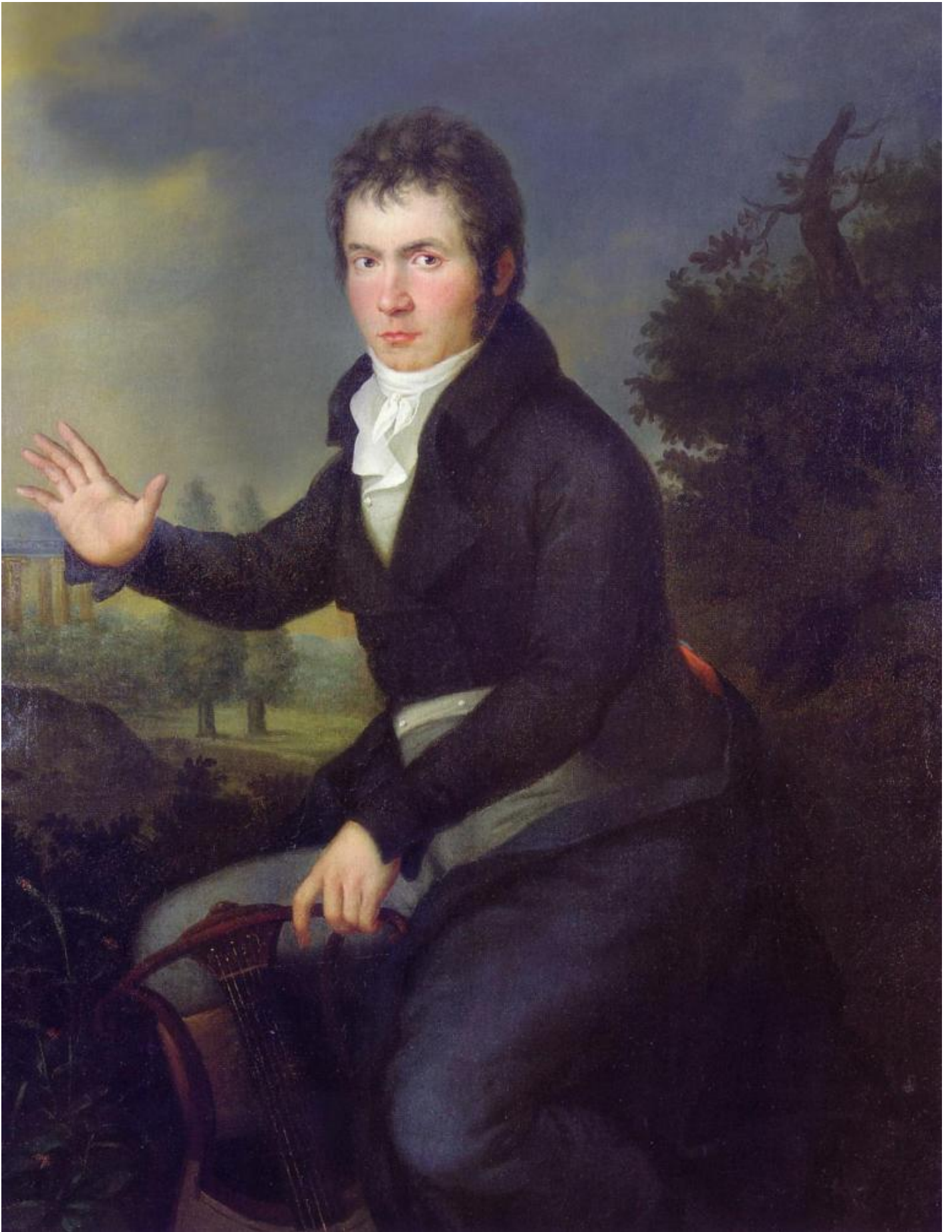
Josef W. Mähler: ritratto di Beethoven poco dopo la prima dell'Eroica (1804-05).