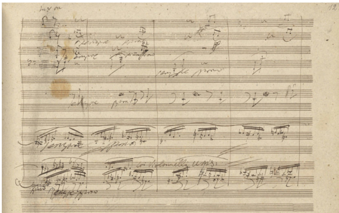
Una pagina dell'autografo della Nona Sinfonia.

I successivi passaggi del linguaggio sinfonico beethoveniano trovano un primo punto di sintesi, straordinario per equilibrio e profondità, nella Settima (1813), capolavoro di densità polifonica integrale che annuncia le vertigini contrappuntistiche del tardo stile. Ad essa si affianca cronologicamente una Sinfonia quasi sperimentale come l' Ottava , ironico ritorno alla "oggettività" che non a caso sarebbe molto piaciuto al neoclassicismo novecentesco.