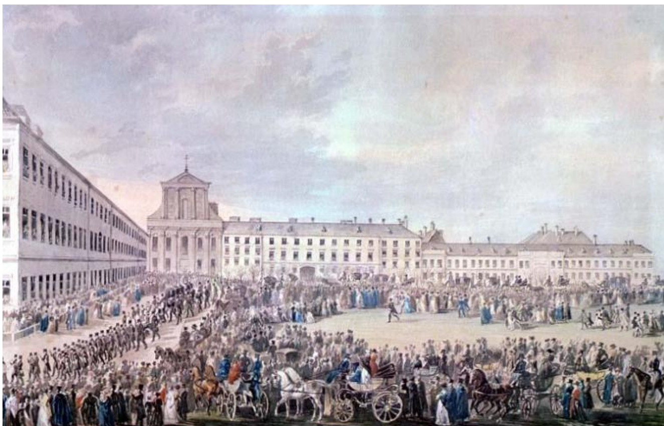
Franz Xaver Stöber, I funerali di Beethoven (29 marzo 1827).

cercare di intendere che cosa Beethoven pensasse “nella” sua musica.