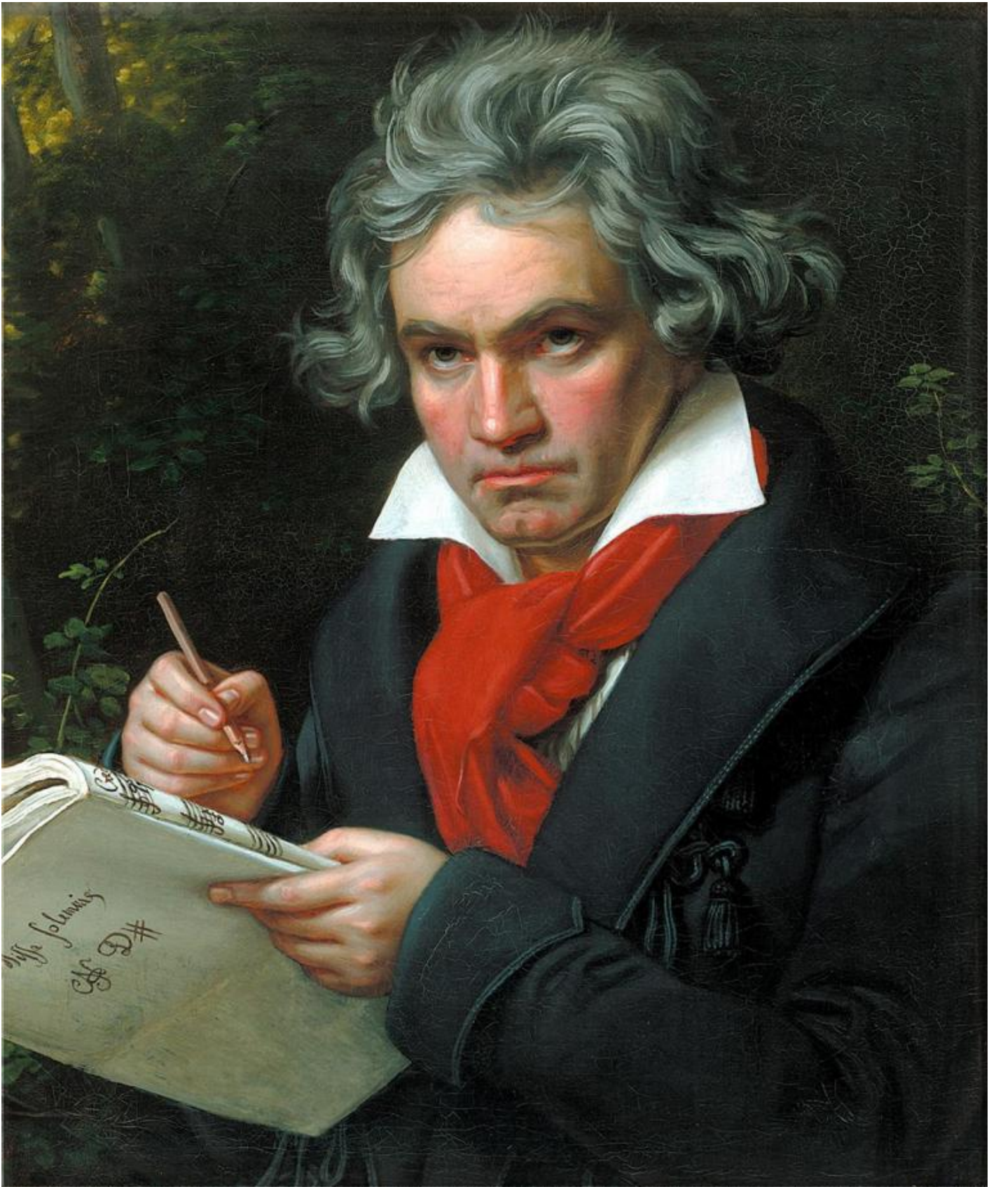
Joseph Stieler: ritratto di Beethoven, 1820.

Questa orgogliosa autonomia determina conseguenze molto importanti anche sul piano prettamente artistico. In Beethoven, il mondo della musica e quello delle idee sono complementari e paralleli. Al secondo compete una funzione quasi maieutica rispetto ai valori puramente creativi, che però vengono sempre accuratamente