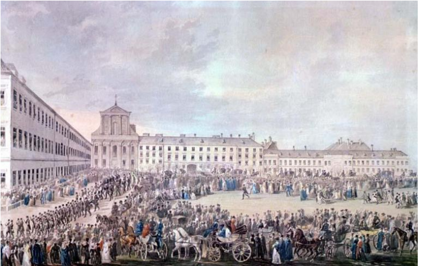
Franz Xaver Stöber, I funerali di Beethoven (29 marzo 1827).

Franz Grillparzer, il poeta che pronunciò l'elogio funebre del compositore il 29 marzo 1827 a Vienna, davanti a una grande folla, lo aveva capito benissimo: è vano cercare di intendere che cosa Beethoven pensasse “nella” sua musica.