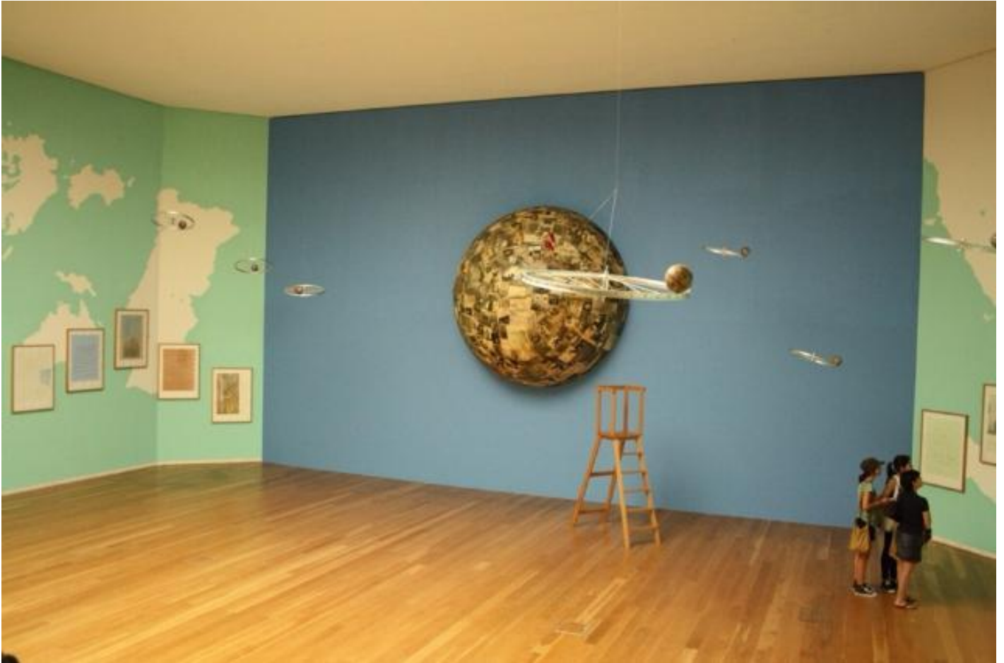
In itinere, Sala dos Mapas, Fundação de Serralves, Porto, 2011.

L'opera di Barrias è dichiaratamente letteraria, a volte scritta su pareti, più spesso pensata per simboli. Il tema dei passaggi è ispirato dal Walter Benjamin dei "Passages di Parigi", le architetture commerciali-creature di sogno della collettività che qui sono tradotte in labirinti e percorsi. Nella mostra di Serralves un percorso di frontiera, la Camera Chiara, conduce all'Apertura. È un tema benjaminiano, come dimostra il testo di Barrias che accompagnava quella mostra: "Avanti viaggiatore, osserva, guarda le rovine che ti accerchiano. Senti nelle tue ali la tempesta che ti spinge inesorabilmente verso il futuro?... Apri le tue ali e avanza, viaggiatore! Tu non potrai più tornare. Tu non potrai evitare la grande tempesta che soffia dal paradiso".