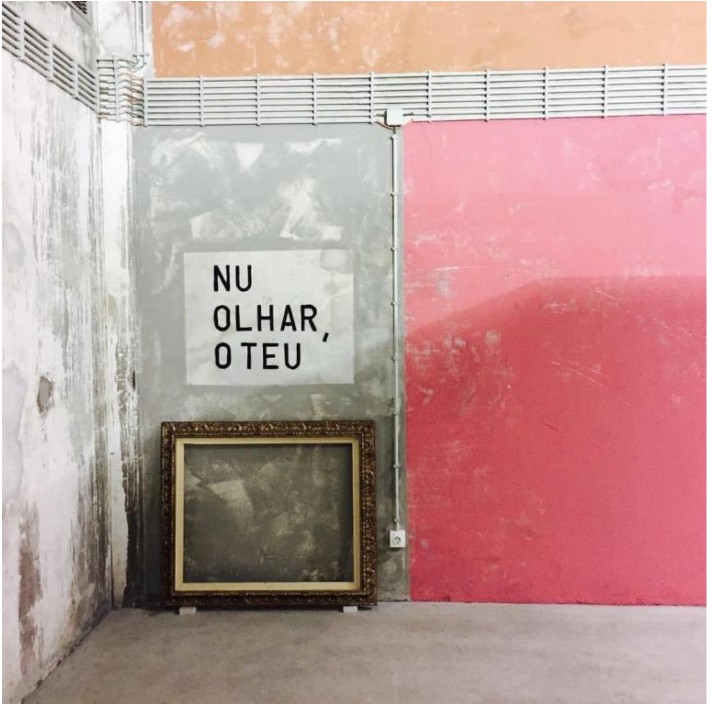
Catedral, Centro de Arte de São João da Madeira, 2016.

Non gli sono mancati i riconoscimenti. Alla Biennale di Venezia del 1984 Barrias rappresenta il Portogallo con “Nottiario”. Alla Triennale di Milano del 2014 presenta “Ombra delle cose future”, tema “teologico” paolino laicamente tradotto in un’arca che raccoglie e salva gli oggetti del paesaggio mediterraneo.