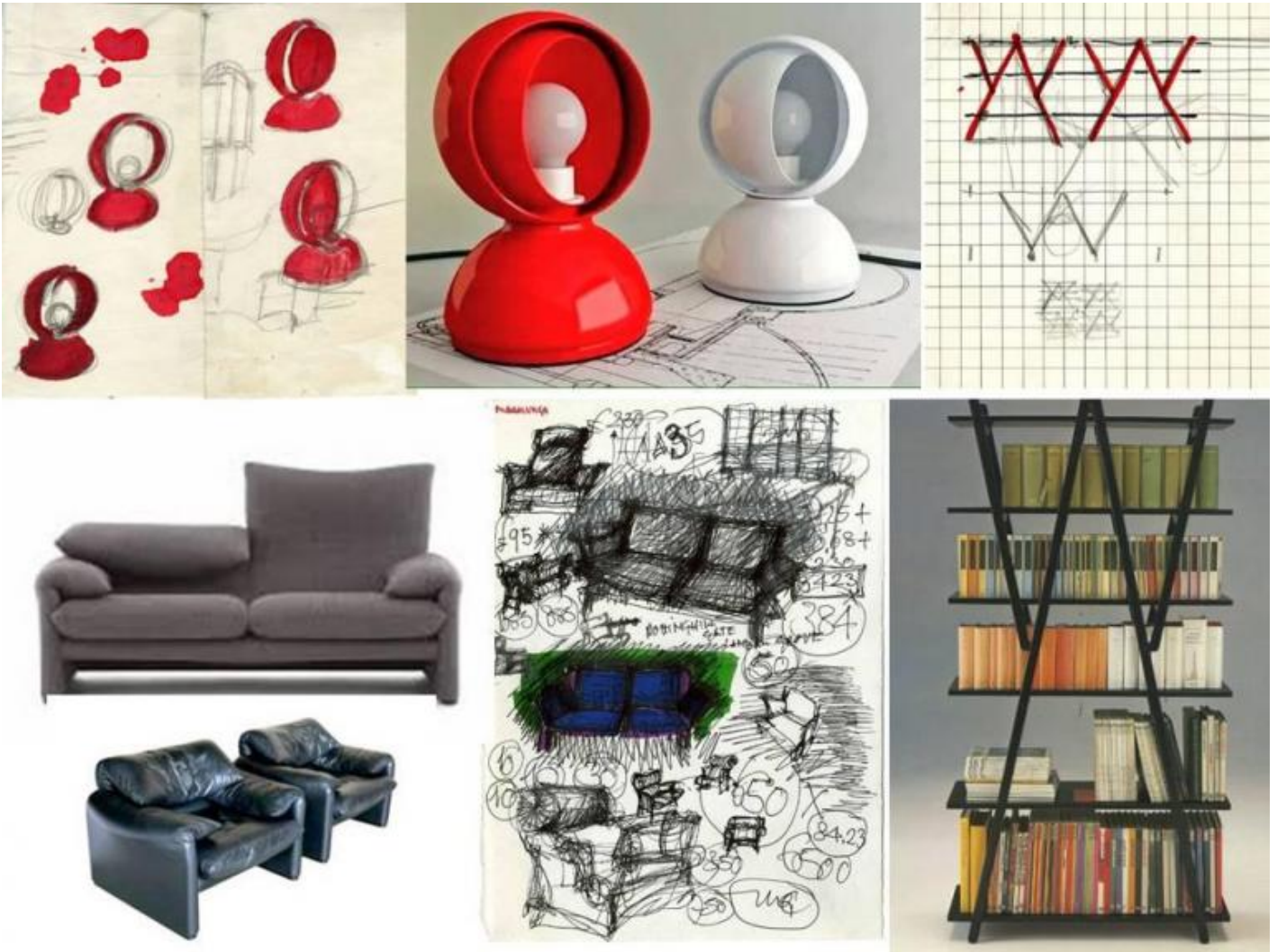
Vico Magistretti, schizzi per lampada Eclisse; lampada Eclisse (Artemide, 1965, Compasso d'Oro 1967); schizzo per libreria Nuvola Rossa, libreria Nuvola Rossa (Cassina, 1977); Poltrone e divano Maralunga (Cassina, 1973, Compasso d'oro 1979); schizzo di progetto per divano e poltrona Maralunga.

Di pezzi di design ne ha progettati moltissimi e tanti sono divenuti dei must, fin dal suo primo, del 1959-1960, la famosa sedia Carimate (prodotta da Cassina), concepita come arredo del Golf club che egli aveva da poco realizzato nella ridente località brianzola (con Guido Veneziani). Seguirono poi la lampada Eclisse (Artemide, 1965, Compasso d'Oro 1967), la sedia Selene (Artemide, 1969), la sedia Golem (Poggi, 1969), il divano Maralunga (Cassina, 1973, Compasso d'oro 1979), la lampada Atollo (Oluce, 1977, Compasso d'oro 1979), la libreria Nuvola Rossa , (Cassina, 1977), la sedia Pan (1980, Rosenthal Studio Line), il tavolo Vidun (De Padova, 1986), la sedia Silver (De Padova, 1988) ed altri, il cui elenco sarebbe davvero troppo lungo (per una conoscenza della sua intera produzione, sia architettonica che di design, si rimanda al sito della Fondazione).