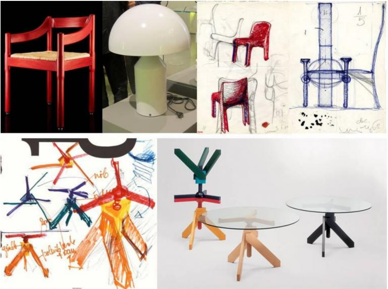
Vico Magistretti. Sopra: sedia Carimate (Cassina, 1959-1960); lampada Atollo (Oluce, 1977, Compasso d'oro 1979); schizzo per sedia Selene (Artemide, 1969); schizzo per sedia Golem (Poggi, 1969). Sotto: schizzo per il tavolo Vidun; tavolo Vidun (De Padova, 1986).