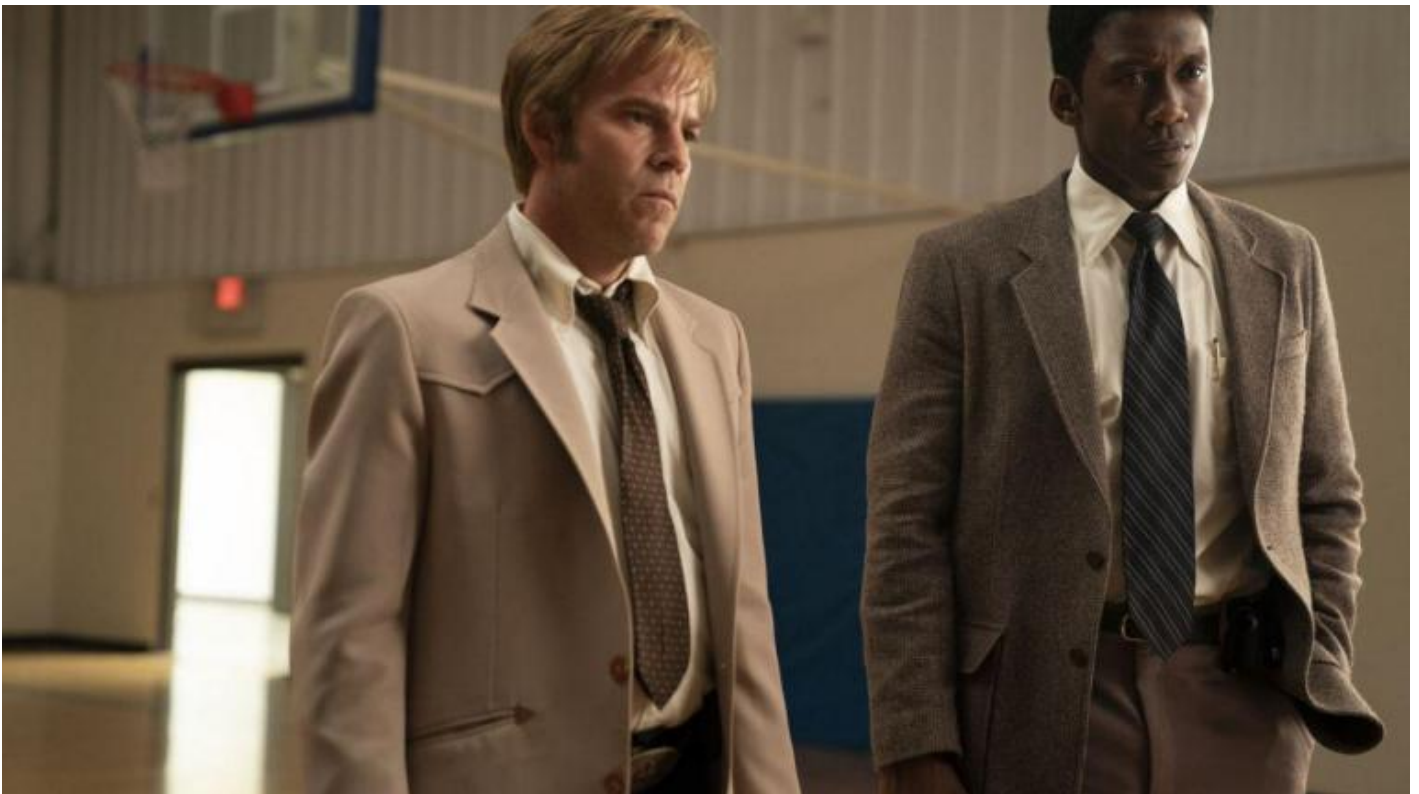
Stephen Dorff e Mahershala Ali in "True Detective" (terza stagione, 2019).

Una semina raccolta subito, due anni dopo, da un'altra serie eccezionale e folle: Too Old to Die Young (2019), del visionario Nicolas Winding Refn. Qui l'indagine si fa quasi spirituale, trascendentale, in linea con l'estetica sfidante e appagante del brillante filmmaker danese. L'identità forte del detective come risolutore viene messa completamente in crisi. Il cammino dell'eroe, un poliziotto che indaga sull'uccisione del suo partner, lo porta ad attraversare le tenebre del mondo; e alla fine ad abbracciare un percorso che potremmo definire, più che di indagine, di trascendenza. Attraverso dieci puntate intitolate ciascuna come uno dei Trionfi dei tarocchi, dal Diavolo (prima puntata) al Mondo (l'ultima), in un omaggio non casuale all'esoterismo di Alejandro Jodorowsky.