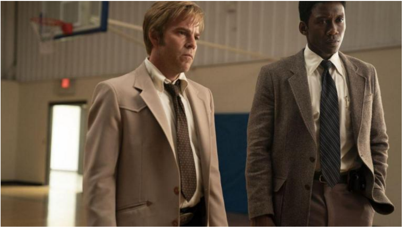
Stephen Dorff e Mahershala Ali in "True Detective" (terza stagione, 2019).

E arriviamo a True Detective (tre stagioni dal 2014). La serie che più ha contribuito a ridefinire la figura del detective nel nostro tempo, o meglio a ricrearla, darle nuova forma. Restituendoci, nelle sue tre stagioni, un detective che indaga sul mondo indossando lenti che sono quasi filosofiche . E lenti filosofiche concettualmente postmoderne: perché mentre indaga sul mondo, indaga su se stesso. Lo vediamo nella prima folgorante stagione, che racconta un'indagine lunga una vita. E in cui il protagonista, uno stazionato detective, arriva a dire: "Non voglio più sapere niente. Questo è un mondo in cui niente viene mai risolto". O a definire il proprio ruolo, la propria funzione, il mondo intero in questi termini: "Tutti hanno qualcosa che non va, tutti vogliono una confessione e una catarsi, e tutti siamo colpevoli".