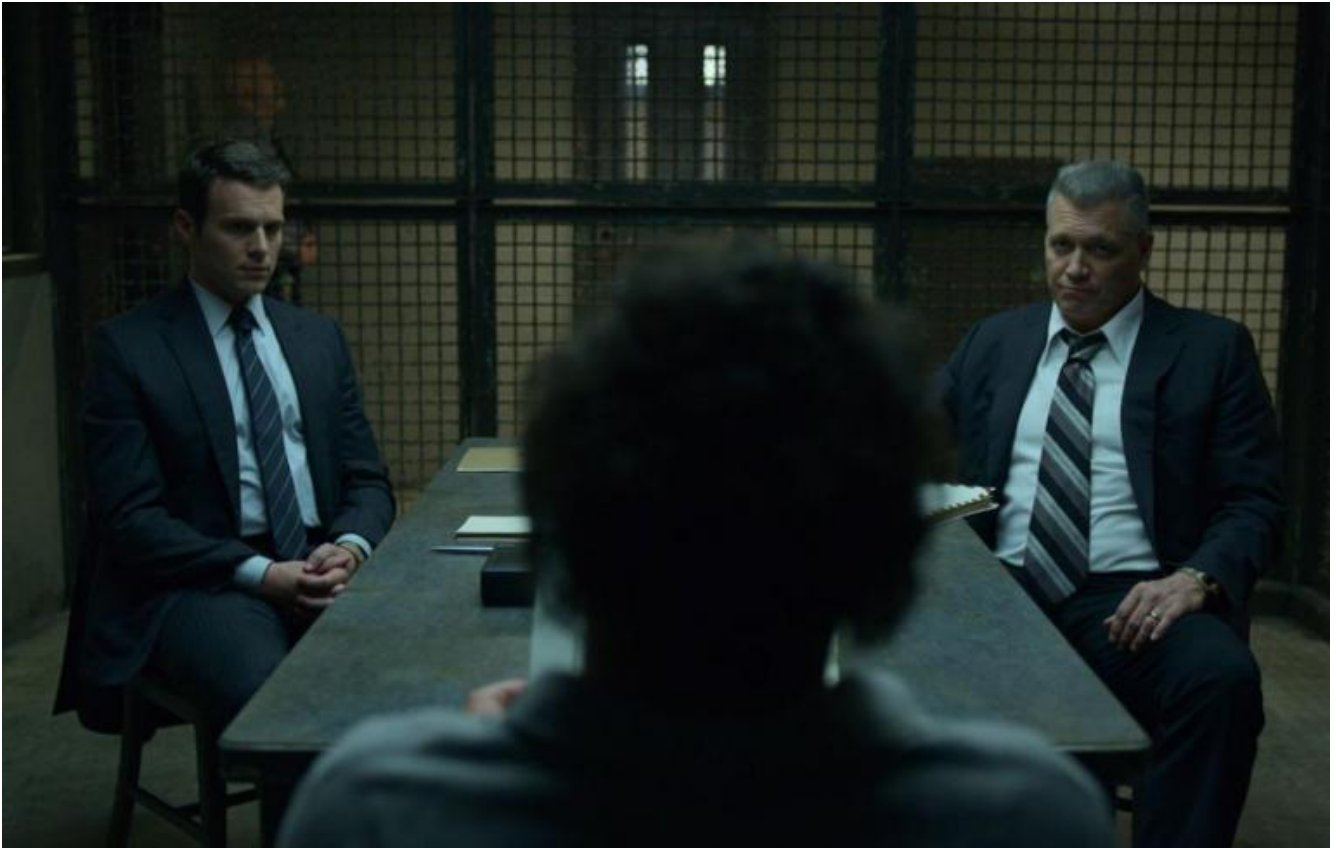
Jonathan Groff e Holt McCallany in "Mindhunter".

rassicuranti del nostro immaginario. Gli esempi potrebbero essere molti, ma cito quattro serie tv emblematiche. Twin Peaks , Mindhunter , Too Old to Die Young , True Detective .