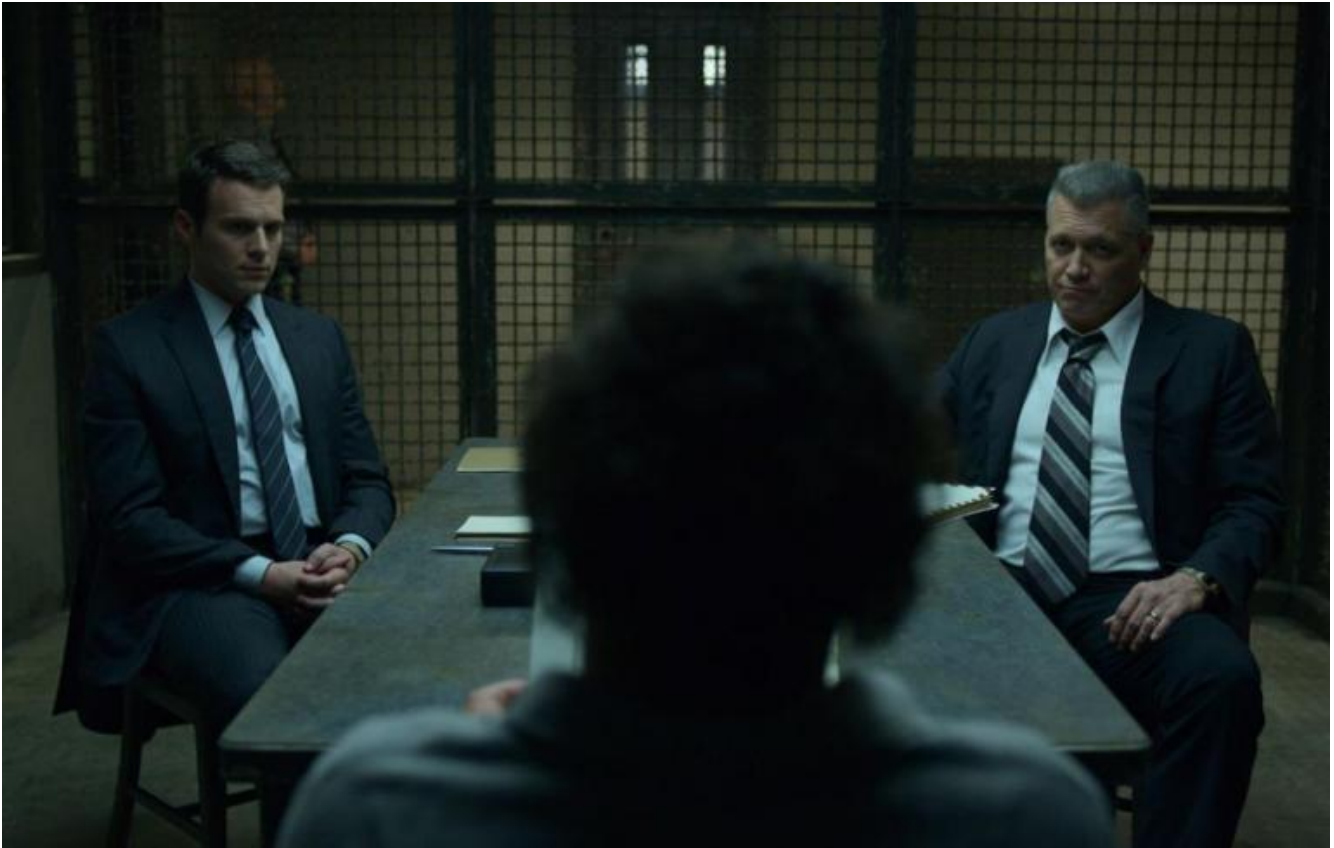
Jonathan Groff e Holt McCallany in "Mindhunter".

rassicuranti del nostro immaginario. Gli esempi potrebbero essere molti, ma cito quattro serie tv emblematiche. Twin Peaks , Mindhunter , Too Old to Die Young , True Detective .