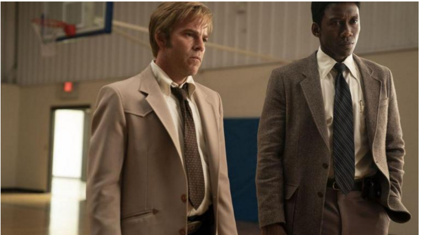
Stephen Dorff e Mahershala Ali in "True Detective" (terza stagione, 2019).

Una semina raccolta subito, due anni dopo, da un'altra serie eccezionale e folle: Too Old to Die Young (2019), del visionario Nicolas Winding Refn. Qui l'indagine si fa quasi spirituale, trascendentale, in linea con l'estetica sfidante e appagante del brillante filmmaker danese. L'identità forte del detective come risolutore viene messa completamente in crisi. Il cammino dell'eroe, un poliziotto che indaga sull'uccisione del suo partner, lo porta ad attraversare le tenebre del mondo; e alla fine ad abbracciare un percorso che potremmo definire, più che di indagine, di trascendenza. Attraverso dieci puntate intitolate ciascuna come uno dei Trionfi dei tarocchi, dal Diavolo (prima puntata) al Mondo (l'ultima), in un omaggio non casuale all'esoterismo di Alejandro Jodorowsky.