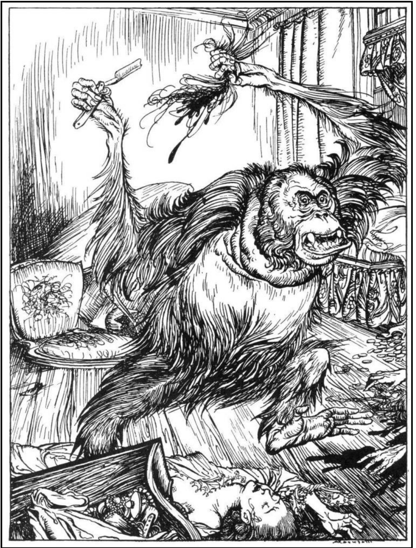
Illustrazione (1935) di Arthur Rackham per "I delitti della Rue Morgue".