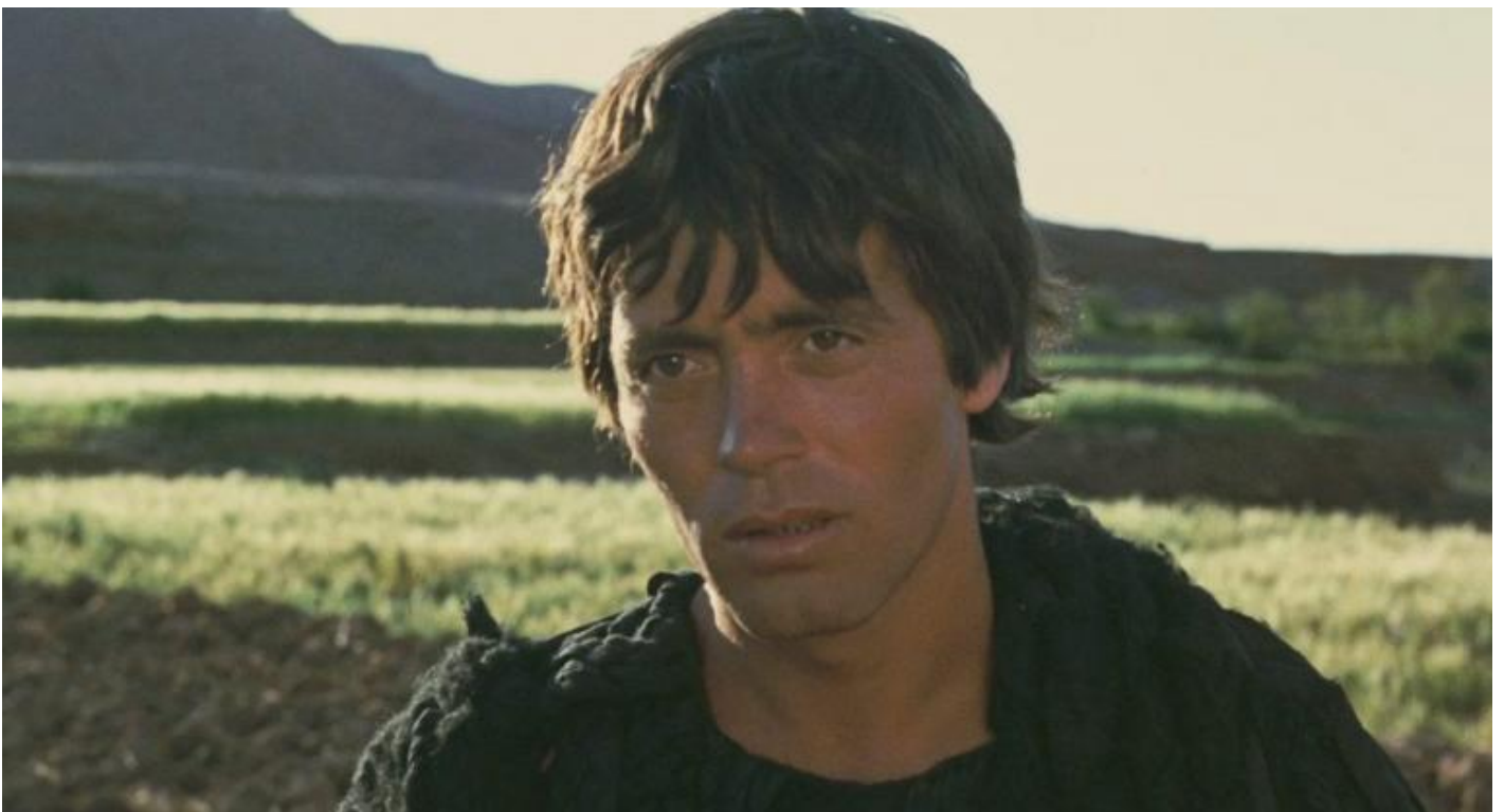
Franco Citti in “Edipo Re” (1967) di Pier Paolo Pasolini.

L'indagine sul delitto diventa così un'indagine sul mondo e un'indagine su se stessi: del detective su se stesso, e dello spettatore su se stesso. Un'indagine su se stessi da cui si finisce per risultare quasi sempre sconfitti. Sembra la trama di Edipo Re! La tragedia di Sofocle ha quasi 2500 anni, e per certi aspetti è la prima detective story della nostra letteratura. Edipo, re di Tebe, è costretto da una serie di accadimenti a indagare sull'uccisione del precedente sovrano, di cui ha preso il posto. L'omicidio è avvenuto moltissimi anni prima e non è stato mai chiarito. È, in termini attuali, un cold case . Il buon Edipo interroga testimoni, ricostruisce le tempistiche, poco alla volta chiarisce il quadro. E, alla fine della sua indagine, scopre di essere il colpevole che sta cercando: era stato lui ad uccidere, tanti anni prima, senza saperlo, il re di Tebe. Ignorando che fosse suo padre.