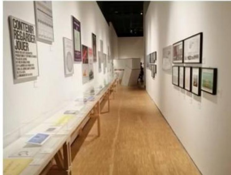
Alcuni scorci della mostra Enzo Mari curated by Hans Ulrich Obrist in Triennale