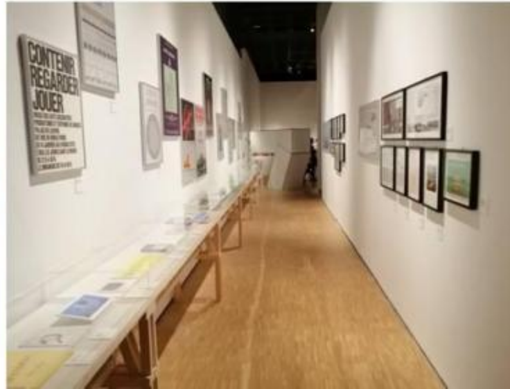
Alcuni scorci della mostra Enzo Mari curated by Hans Ulrich Obrist in Triennale