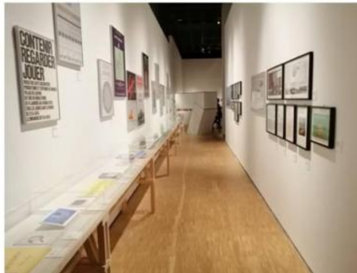
Alcuni scorci della mostra Enzo Mari curated by Hans Ulrich Obrist in Triennale