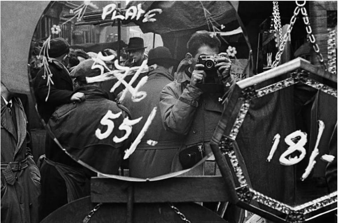
F. Horvat, Londra autoritratto al Brick Lane Market, 1955.

Abbiamo avuto appassionanti confronti sui nostri approcci, così diversi per quanto apparentemente vicini, e sul nostro comune sostanziale disinteresse per la fotografia di moda. Per entrambi noiosa e ripetitiva e, paradossalmente, tra le meno creative.