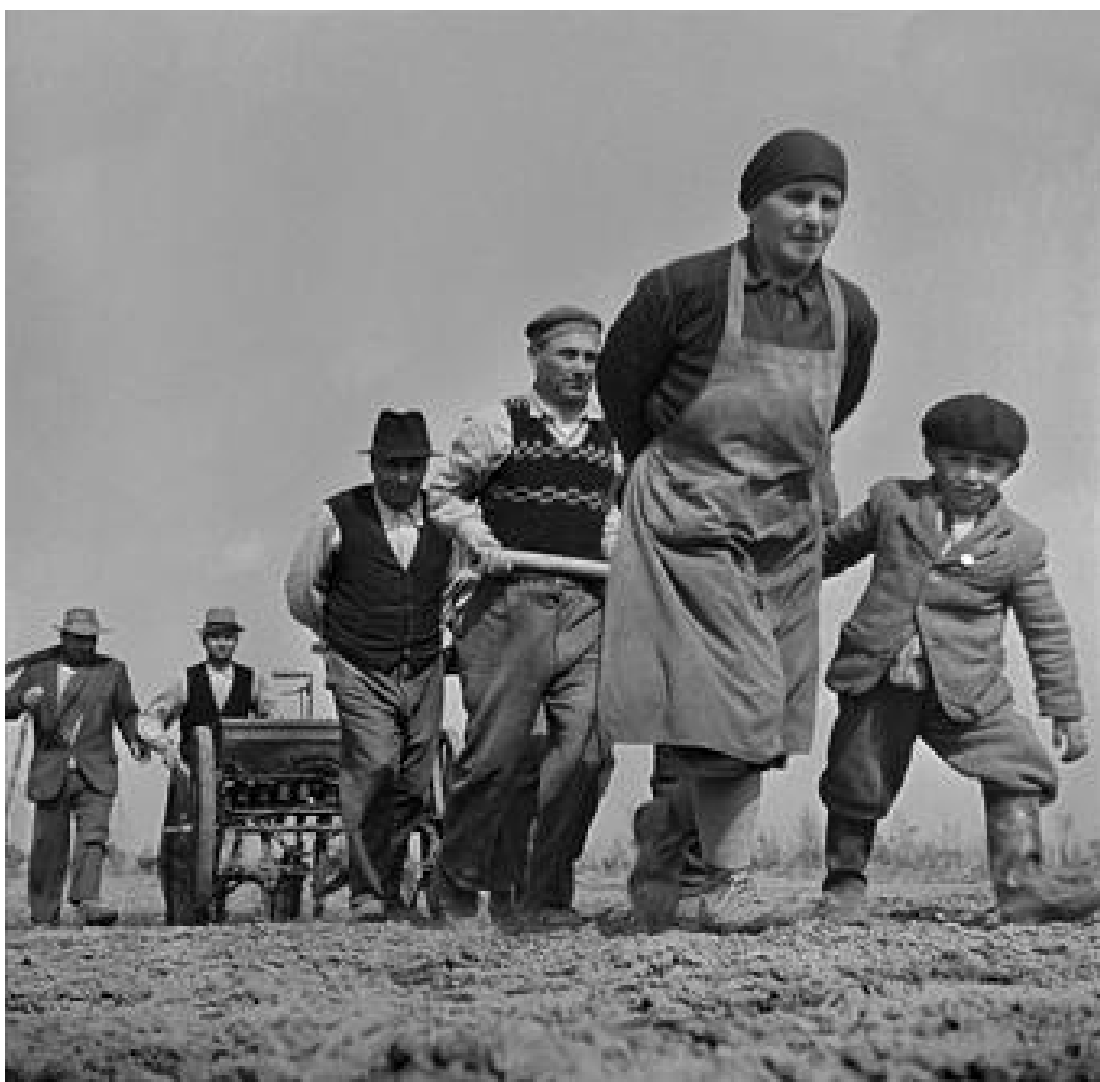
F. Horvat, Polesine, 1950.

A proposito di questa ossessione del controllo, ricordo che ad Atene mi disse che secondo lui la differenza più grande tra le nostre foto di moda era che io cercavo l'azzardo, appunto, mentre a lui interessava soprattutto il controllo dell'immagine.