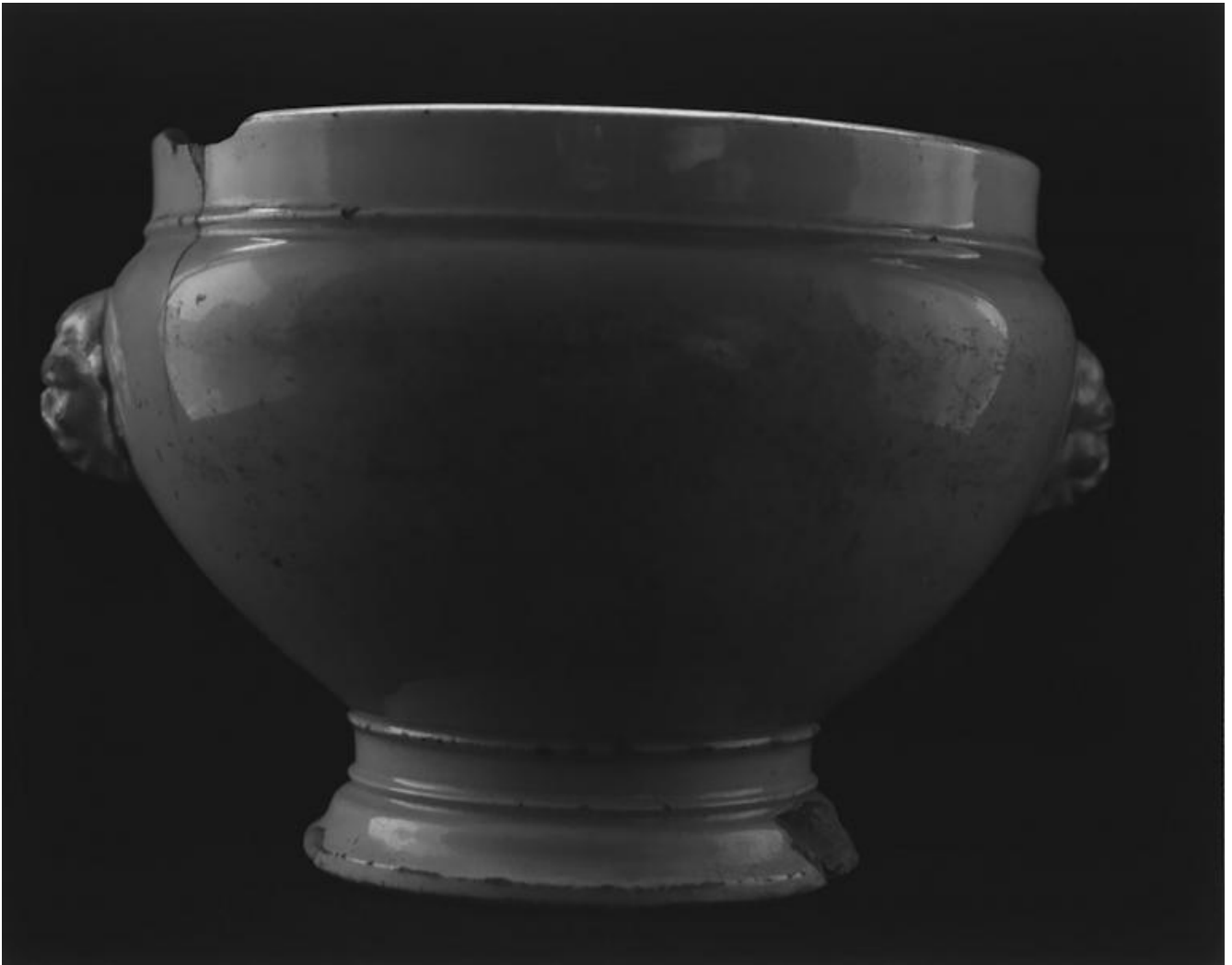
Franco Vimercati, Senza titolo (Zuppiera), 1991 gelatin silver print 17.7 x 22.5 Ed. 6 + 3 AP

La risposta forse sta in un terzo elemento, la serialità. Marco Scotini, il curatore della mostra in corso alla galleria di Raffaella Cortese a Milano, nel saggio introduttivo al catalogo riporta un appunto a penna di Vimercati dell'agosto 1991: "il vero 'contenuto' del mio lavoro è la ripetizione. La ripetizione ostinata, cattiva o assente, malinconica o violenta, ma solo e sempre ripetizione. In ogni caso, il non voler dare spettacolo, il non essere accomodante, grazioso, ragionevole. Il non voler proporre quesiti intelligenti, raffinati esercizi di stile. Cerco di essere il più semplice possibile proprio perché la protesta sia il più efficace possibile. Deve essere secca e penetrante come un chiodo senza dispersione di nessun genere".