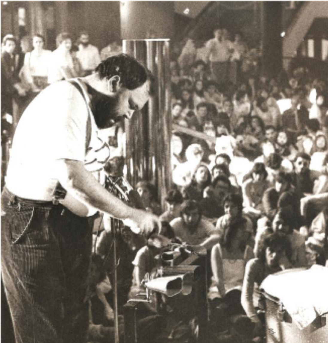
Seconda settimana internazionale della performance, Palazzo dei Congressi, Bologna, 1978.

Si nota ovunque, persino nel verso più malmesso, il residuo di un'urgenza ancora raccoglibile. Scrive Fontana nella sua introduzione: «poesia come tensione, dunque, e come padronanza, come necessità, come aspirazione a conoscere il senso profondo del reale, come sfida all'intelligenza per giocare a rifare il mondo. Poesia da udire, da leggere, da guardare, poesia da stringere, da palpare, [...] da vivere, da amare, da cantare, ma anche da bere e da mangiare.»