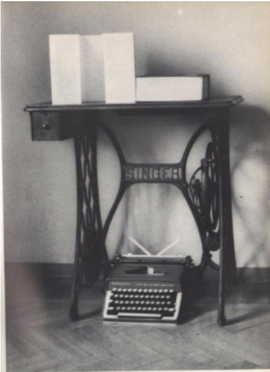
Carlo A. Sitta, "L'enigma di Isidore Isou", in "Verso la Poesia Totale".

Con inattualità vorremmo che qui s'intendesse il sopravvivere di un disassestamento che Verso la poesia totale porterebbe sempre con sé come quanto non può accordarsi col presente delle cose, né ora né mai. Siamo chiamati una volta tanto nella regione dello scrimolo, del diastema tra tempi sfasati, tra tempi tagliati di avvenire e reminiscenza. Scrive Georges Didi-Huberman in L'immagine insepolta (Bollati Boringhieri, 2006): «In primo luogo, la sopravvivenza anacronizza il presente: smentisce violentemente le evidenze dello Zeitgeist , quello "spirito del tempo" sul quale si fonda tanto spesso la definizione degli stili artistici.». Il verso del titolo alluderebbe proprio a questa esperienza operativa dell'eccesso, a questa «resistenza al tempo d'epoca» per cui la poesia totale cesserebbe di risuonare soltanto qualora si rassegnasse a uno sviluppo storico: «Il poeta sa che la poesia è qualcosa che lo riguarda sempre meno.».