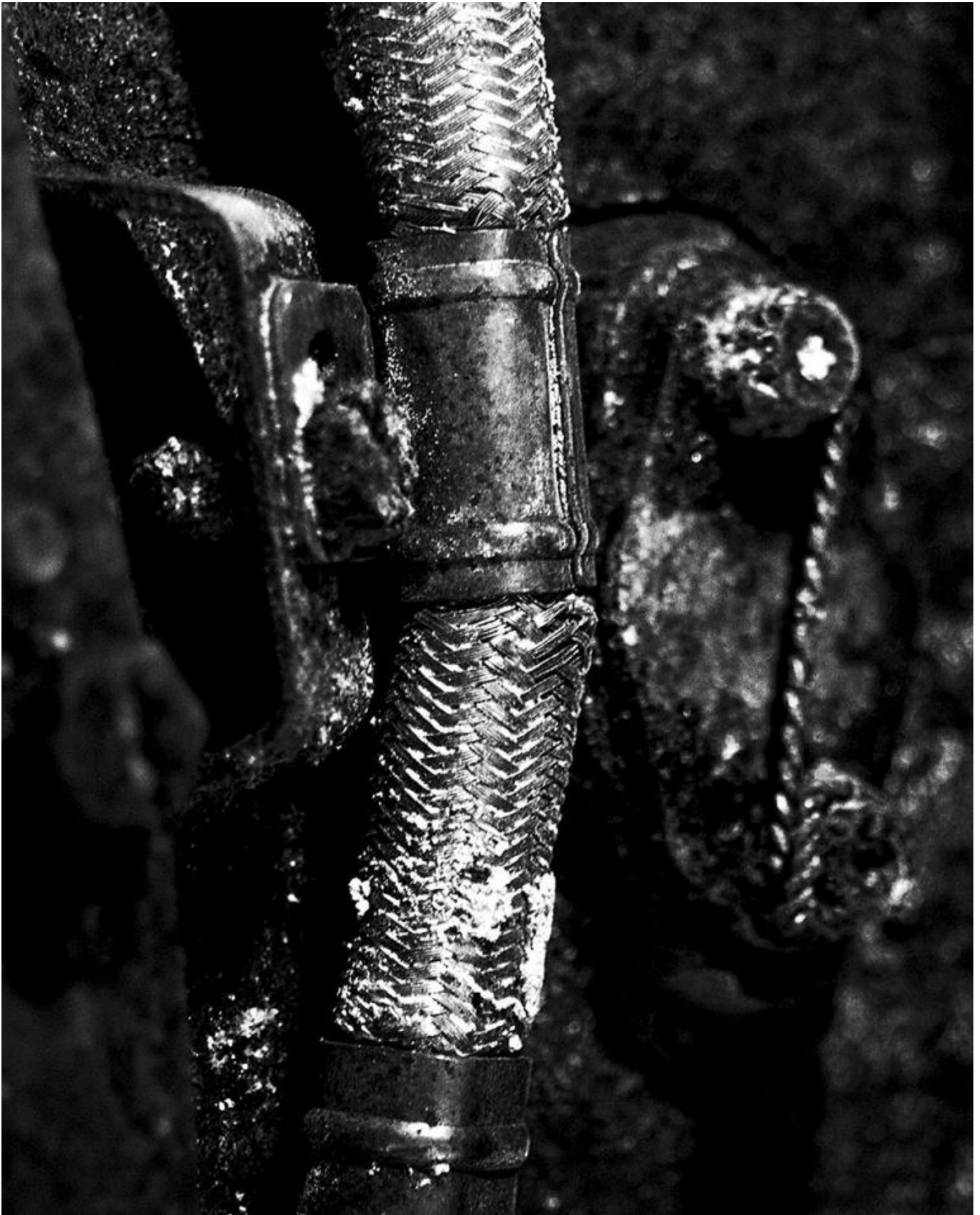
Nino Migliori Stragedia, 2007-2020

Le 81 immagini vengono proiettate casualmente sugli schermi, contemporaneamente, ogni tanto ritornano, ogni tanto con una prospettiva