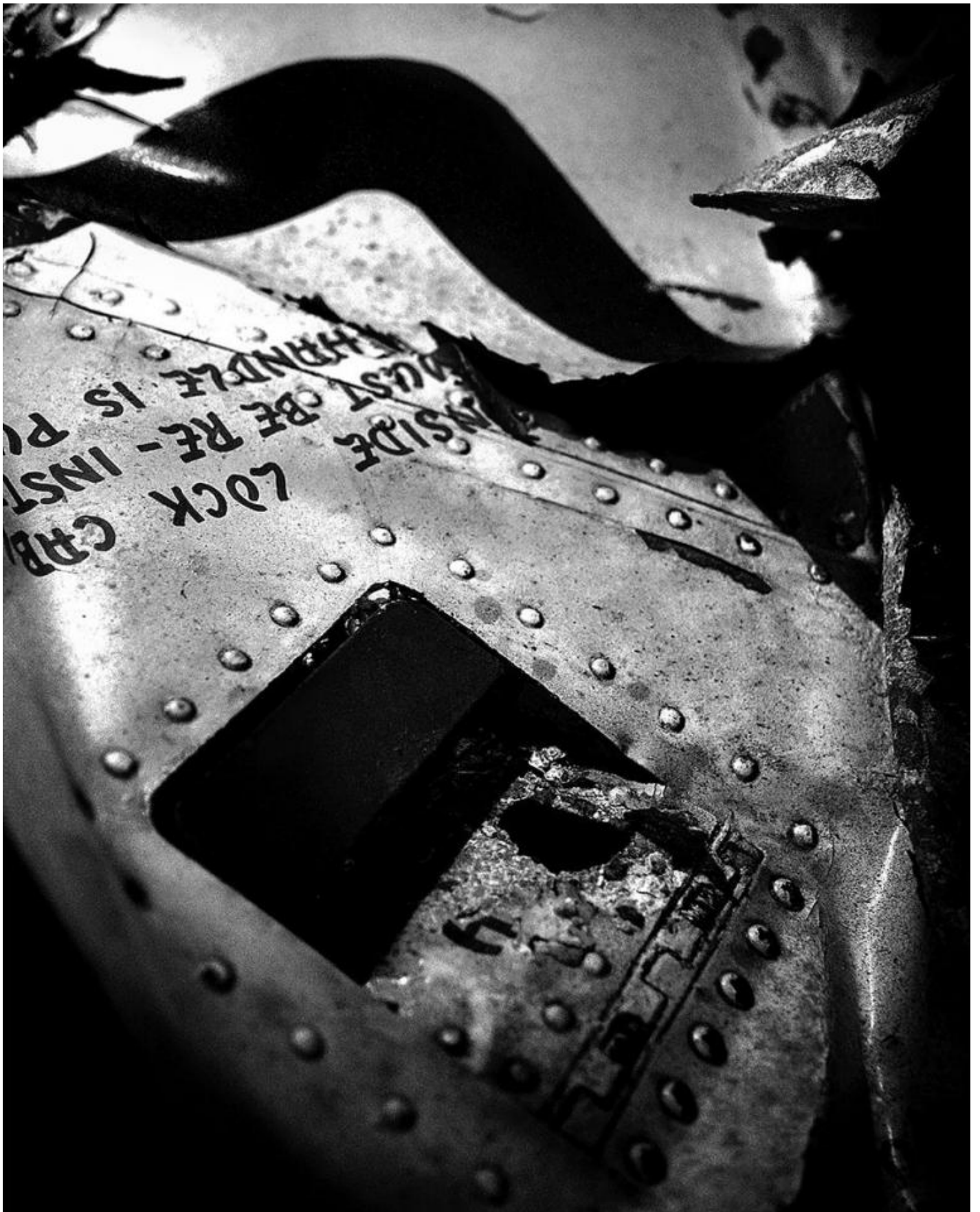
Nino Migliori Stragedia, 2007-2020