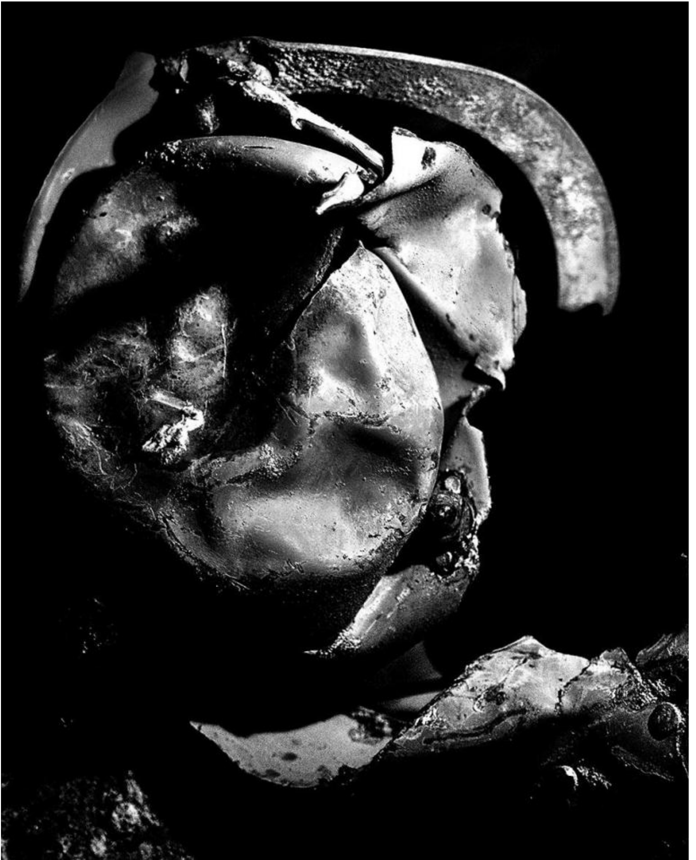
Nino Migliori Stragedia, 2007-2020