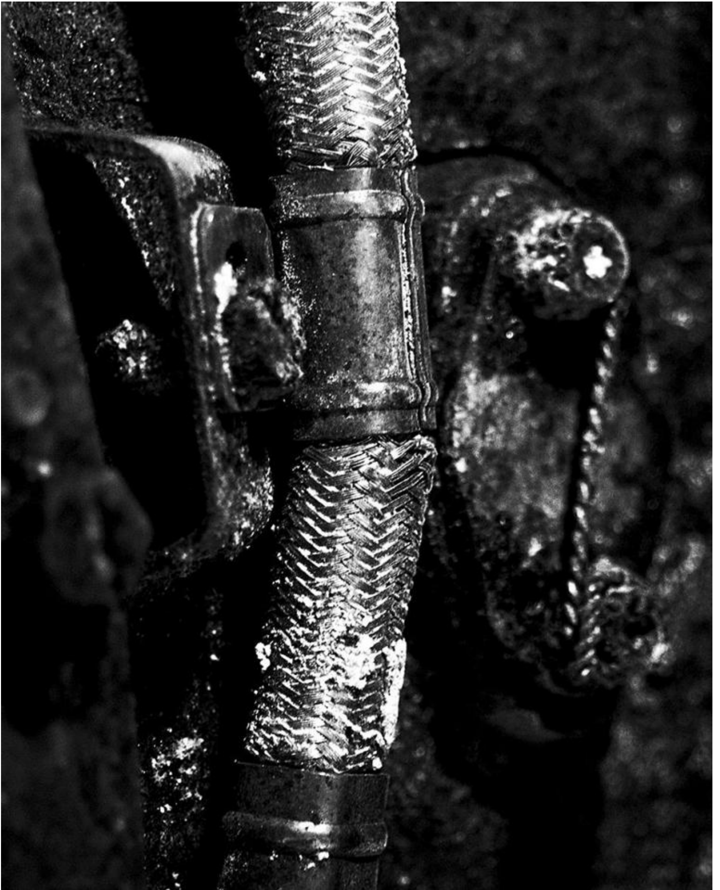
Nino Migliori Stragedia, 2007-2020