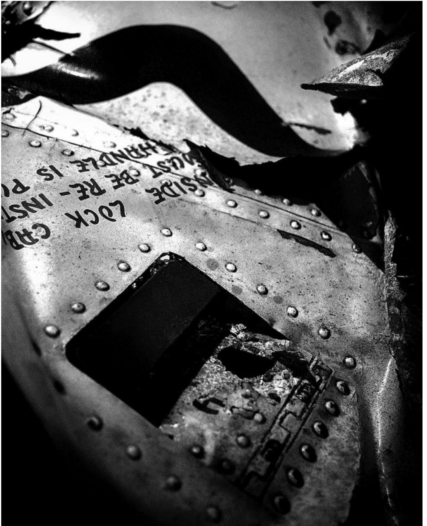
Nino Migliori Stragedia, 2007-2020