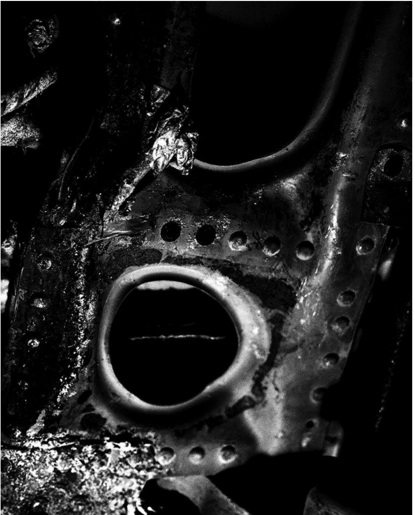
Nino Migliori Stragedia, 2007-2020

L'installazione di Boltanski lascia lo spettatore con una verità emotiva sull'accaduto: lo fa sentire impotente. La stessa sensazione, ma diversamente