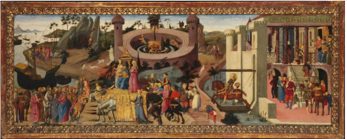
Biagio d'Antonio, Scene dalle storie degli Argonauti, fine XV sec., Metropolitan museum, New York.