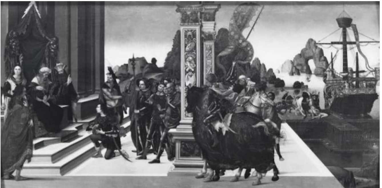
Maestro del 1487, Partenza degli Argonauti, 1487, National Gallery, Londra.

La ragione di questa predilezione sembrerebbe quella, alquanto curiosa secondo la nostra mentalità, che individuava in Medea un simbolo di fedeltà coniugale, pronta a tutto pur di difenderla; nonché, mi vien da aggiungere, un monito al marito perché osservi il patto coniugale, se si pensa a cosa Medea è stata capace di fare quando ha scoperto il tradimento di Giasone, con il tradizionale strascico grandguignolesco che miti e tragedie non si fanno scrupolo di raccontare in ogni dettaglio, nell'eterna vicenda che vede come prime vittime i figli, come dimostra la cronaca nera di tutti i tempi, con la differenza che le stragi, oggi, sembrano appannaggio quasi esclusivo dei padri, deboli e isterici quanto violenti.