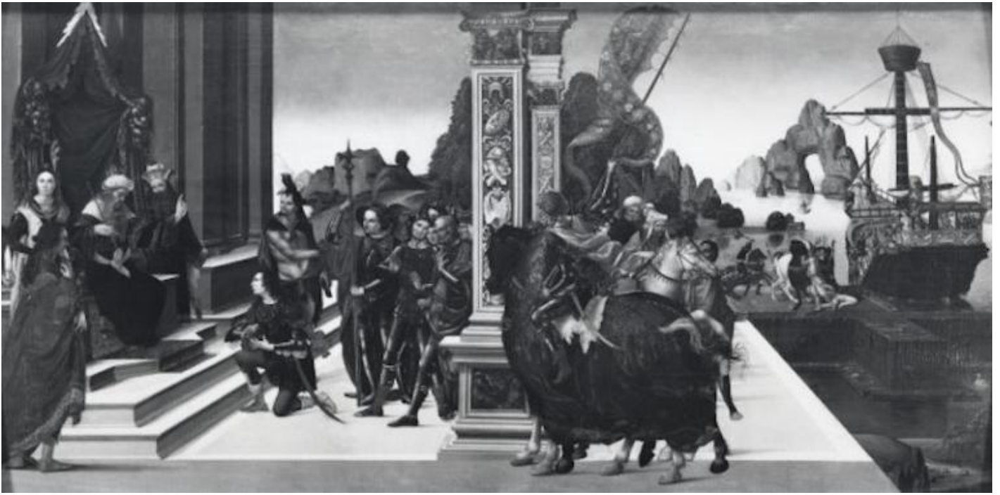
Maestro del 1487, Partenza degli Argonauti, 1487, National Gallery, Londra.

La ragione di questa predilezione sembrerebbe quella, alquanto curiosa secondo la nostra mentalità, che individuava in Medea un simbolo di fedeltà coniugale, pronta a tutto pur di difenderla; nonché, mi vien da aggiungere, un monito al marito perché osservi il patto coniugale, se si pensa a cosa Medea è stata capace di fare quando ha scoperto il tradimento di Giasone, con il tradizionale strascico grandguignolesco che miti e tragedie non si fanno scrupolo di raccontare in ogni dettaglio, nell'eterna vicenda che vede come prime vittime i figli, come dimostra la cronaca nera di tutti i tempi, con la differenza che le stragi, oggi, sembrano appannaggio quasi esclusivo dei padri, deboli e isterici quanto violenti.