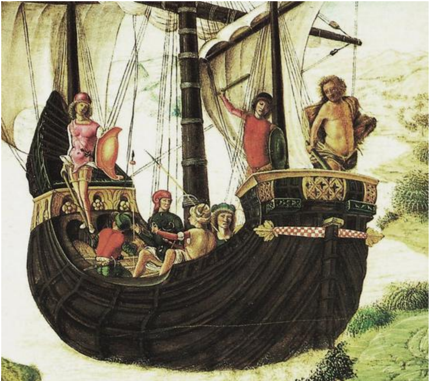
Lorenzo Costa, La spedizione degli Argonauti, 1485, dettaglio, Museo Civici Eremitani, Padova.

E ciò che si vede dipinto è una scena drammatica e insieme incantata. Una nave apparentemente grandissima, per quanto scarsamente popolata tenendo conto che gli Argonauti erano cinquanta, si sta allontanando da riva sospinta da venti favorevoli. Il mare è calmo, nessuna avvisaglia di pericolo o di tempesta, come nelle marine bibliche o olandesi sovraccariche di insegnamento religioso o allegorico, o in Turner, sovraccarico di nient'altro che non sia gloriosa pittura.