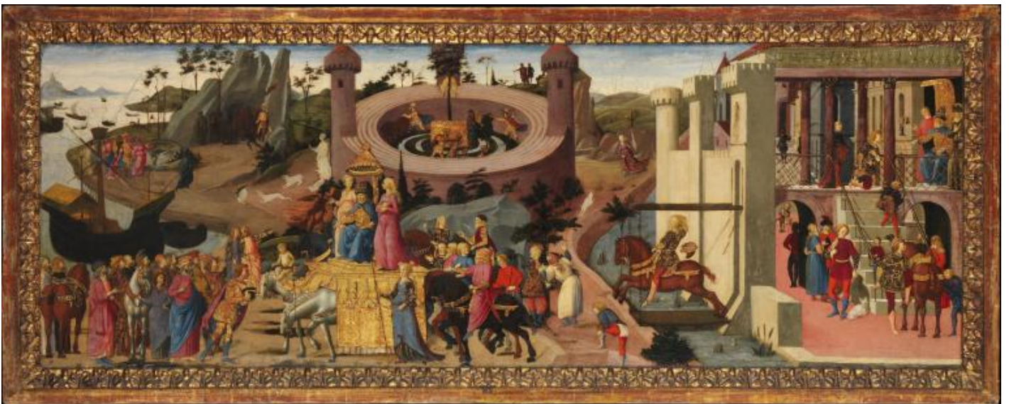
Biagio d'Antonio, Scene dalle storie degli Argonauti, fine XV sec., Metropolitan museum, New York.