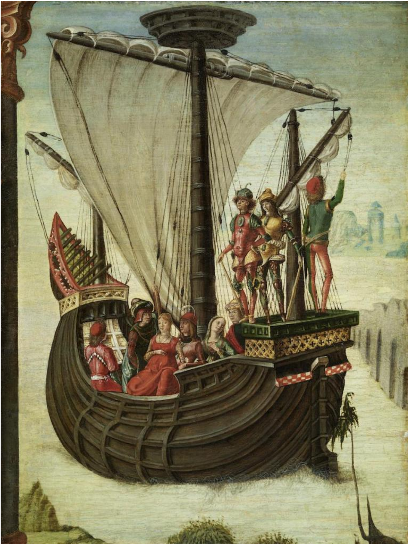
Lorenzo Costa (Attr. de' Roberti), Gli argonauti lasciano la Colchide , Museo Thyssen-Bornemisza Madrid.