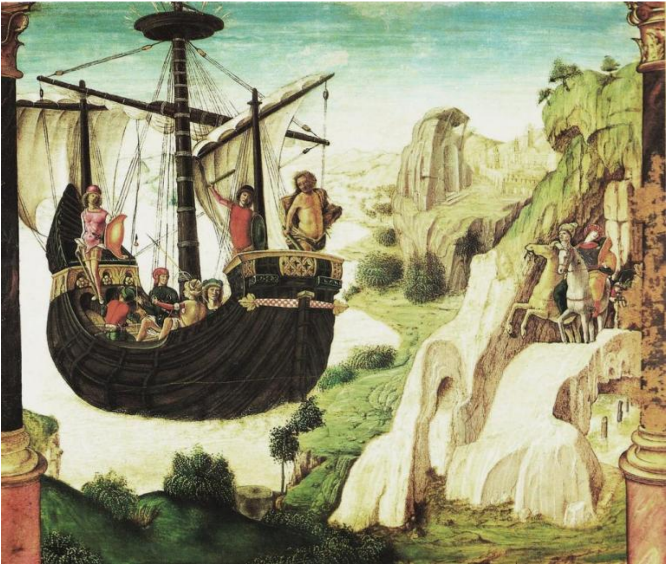
Lorenzo Costa, La spedizione degli Argonauti, 1485, Museo Civici Eremitani, Padova.

dell'oro di una sopravvivenza dignitosa e pacifica. Ma coloro che il mare reclama a sé, con la connivenza degli uomini, oggi raramente hanno tumuli, sacrifici offerti agli dei, rituali che li accompagnino nell'Ade e ne conservino la memoria come per gli Argonauti morti durante il loro viaggio. Vanno a fondo, le ossa spolpate come già Fleba il fenicio 3000 anni prima, o galleggiano sul mare, portati a spalla dalle onde verso riva, come se solo così possano trovare un porto. Favore degli dei non ne hanno, nessuna Argo che li trasporta e protegge.