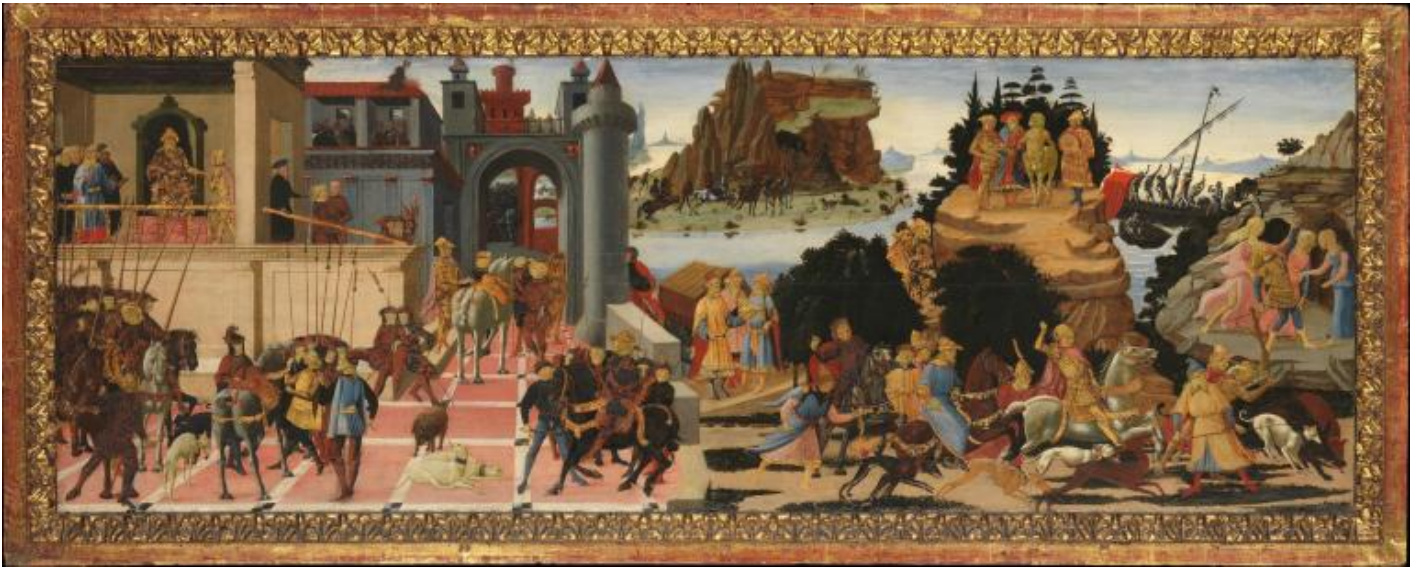
Jacopo del Sellaio, Scene da storie Argonauti, 1465, Metropolitan Museum, New York.