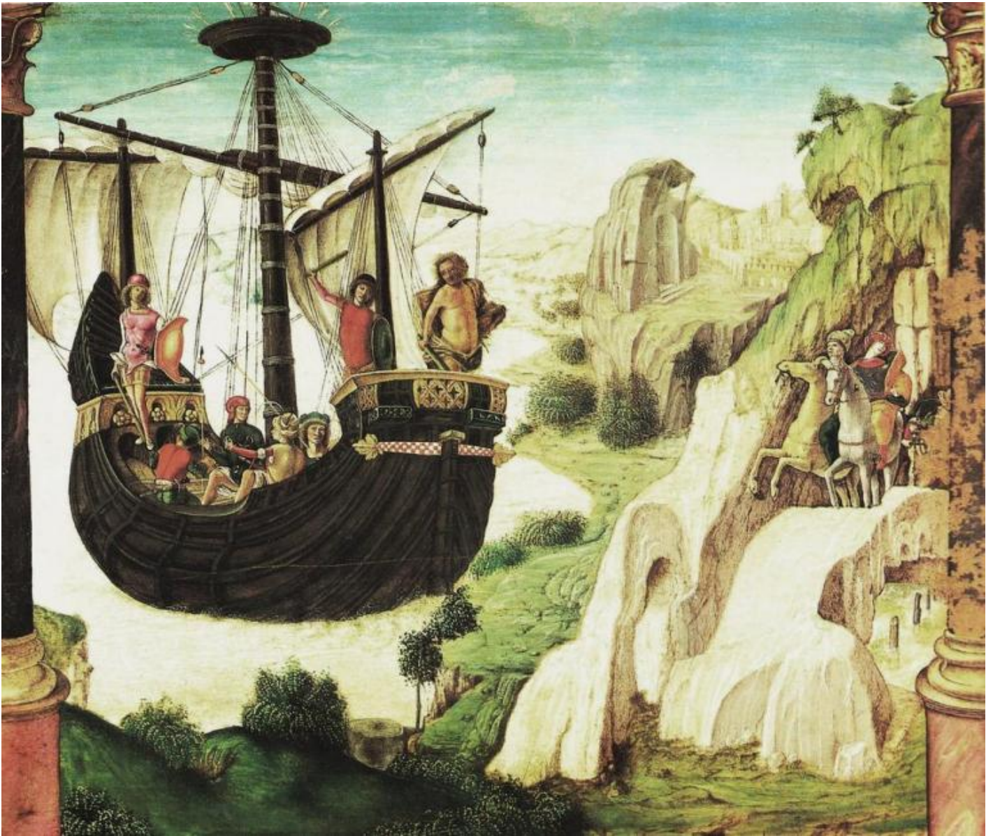
Lorenzo Costa, La spedizione degli Argonauti, 1485, Museo Civici Eremitani, Padova.

Argo è il soggetto principale, almeno dal punto di vista visivo che in un quadro è ciò che conta, di un'incantevole tavoletta che si può ammirare al museo di Padova, e che si trova riprodotta ormai pressoché ovunque si parli del viaggio degli Argonauti.