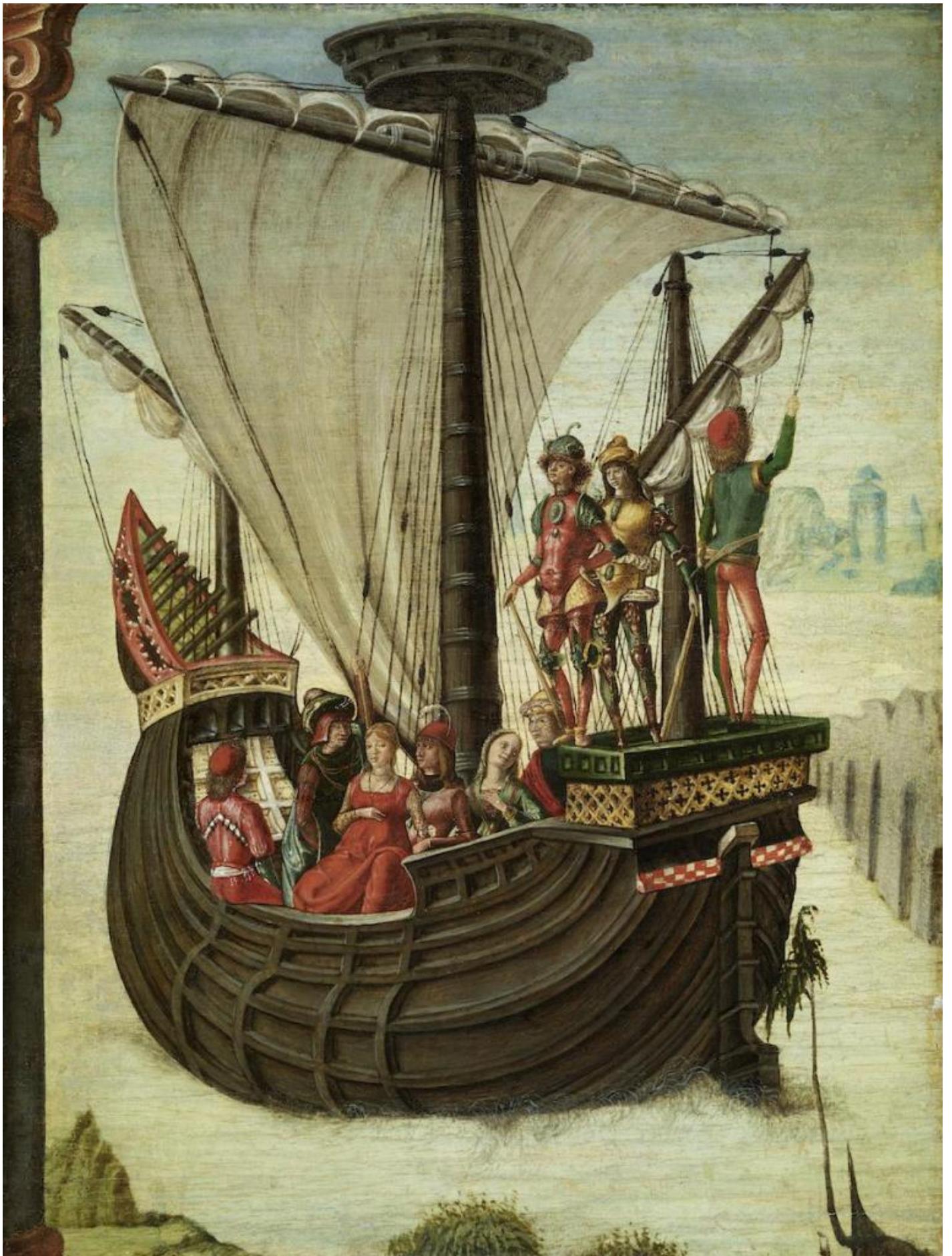
Lorenzo Costa (Attr. de' Roberti), Gli argonauti lasciano la Colchide, Museo Thyssen-Bornemisza Madrid.