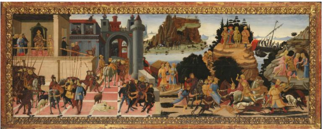
Jacopo del Sellaio, Scene da storie Argonauti, 1465, Metropolitan Museum, New York.

La tavoletta, di circa mezzo metro di lato (46x53), apparteneva al secondo di una coppia di cassoni nuziali realizzati attorno al 1485 per le nozze di un appartenente alla famiglia patrizia bolognese Guidotti, decorati da sei immagini che narravano la storia degli Argonauti ora disperse in vari musei (vedi la ricca scheda della tavola di Paola Tosetti Grandi nel catalogo della mostra Da Bellini a Tintoretto ). Il soggetto era un tema ricorrente della decorazione di questi mobili nuziali, di cui restano vari esempi come quello di Jacopo del Sellaio, del 1465, o quello attribuito a Biagio d'Antonio, entrambi al Metropolitan, o quello, coevo al nostro, che appartiene alla Serie di pannelli con storie degli Argonauti dipinti per il matrimonio di Lorenzo Tornabuoni con Giovanna di Maso degli Albizzi , riprodotti qui sotto