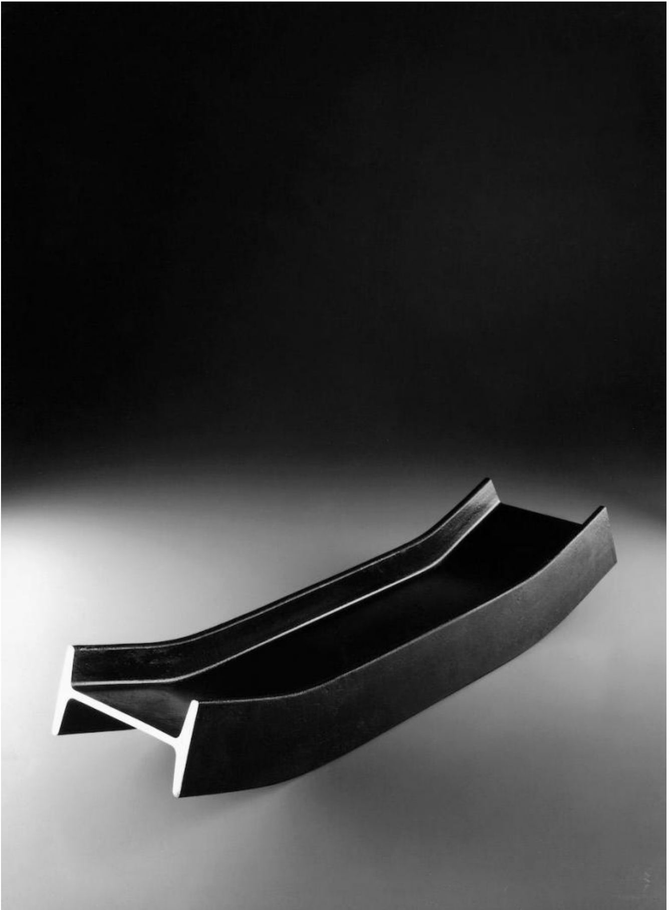
Serie putrella, 1958.