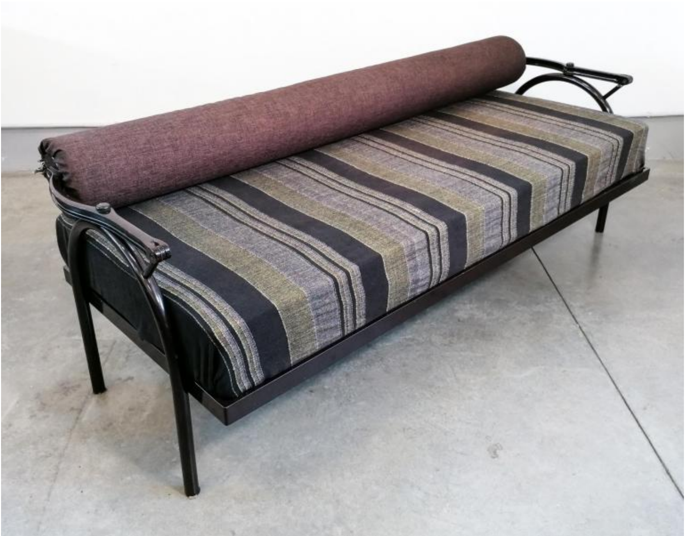
Divano Day-night, Design Enzo Mari per Driade, 1971.

Sino a quel punto ha realizzato opere pittoriche, esperimenti visivi e concettuali, una serie di oggetti per Danese, copertine e interni per libri, sedie, allestimenti modulari per esposizioni e librerie. Si trova in un punto decisivo della sua carriera di designer, dopo aver cominciato e interrotto quella di artista e pittore. Riflette lungamente su quel fallimento, che gli pare emblematico, come racconta a Hans Ulrich Obrist. Intanto il divano è finito nel suo studio dove passano a trovarlo alcuni dei leader del movimento studentesco per cui Mari simpatizza. Il giudizio dei giovanotti sembra unanime: ma tu che fai oggetti così eleganti, gli chiedono, come mai hai progettato un mobile così brutto? Il designer interroga i suoi ospiti su come immaginino un divano letto. Le risposte descrivono un letto che somiglia a quelli prodotti in Brianza per gli sceicchi arabi: rotondo, diametro quattro metri, specchio superiore, televisore, filodiffusione. Il tutto gli provoca un gran nervoso. Come mai le persone, si domanda, capiscono il prosciutto, il parmigiano-reggiano