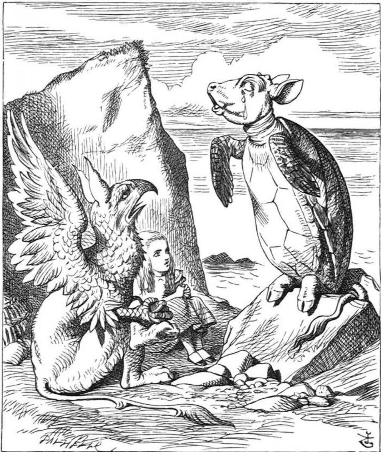
Illustrazione di Tenniel (1865).

Fu proprio l'illustrazione di Tenniel, che ritrae questo incredibile ibrido fra una tartaruga e un vitello ritto su due zampe su uno scoglio, con la testa volta verso il cielo, le pinne inerti a penzolini e lo sguardo rigato di lacrime perso nell'infinito, a