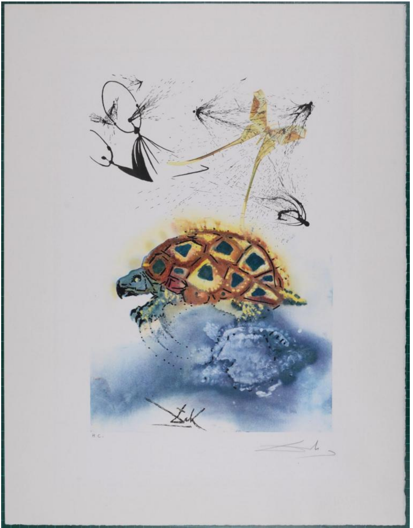
La Finta Tartaruga di Salvador Dalí (1969).