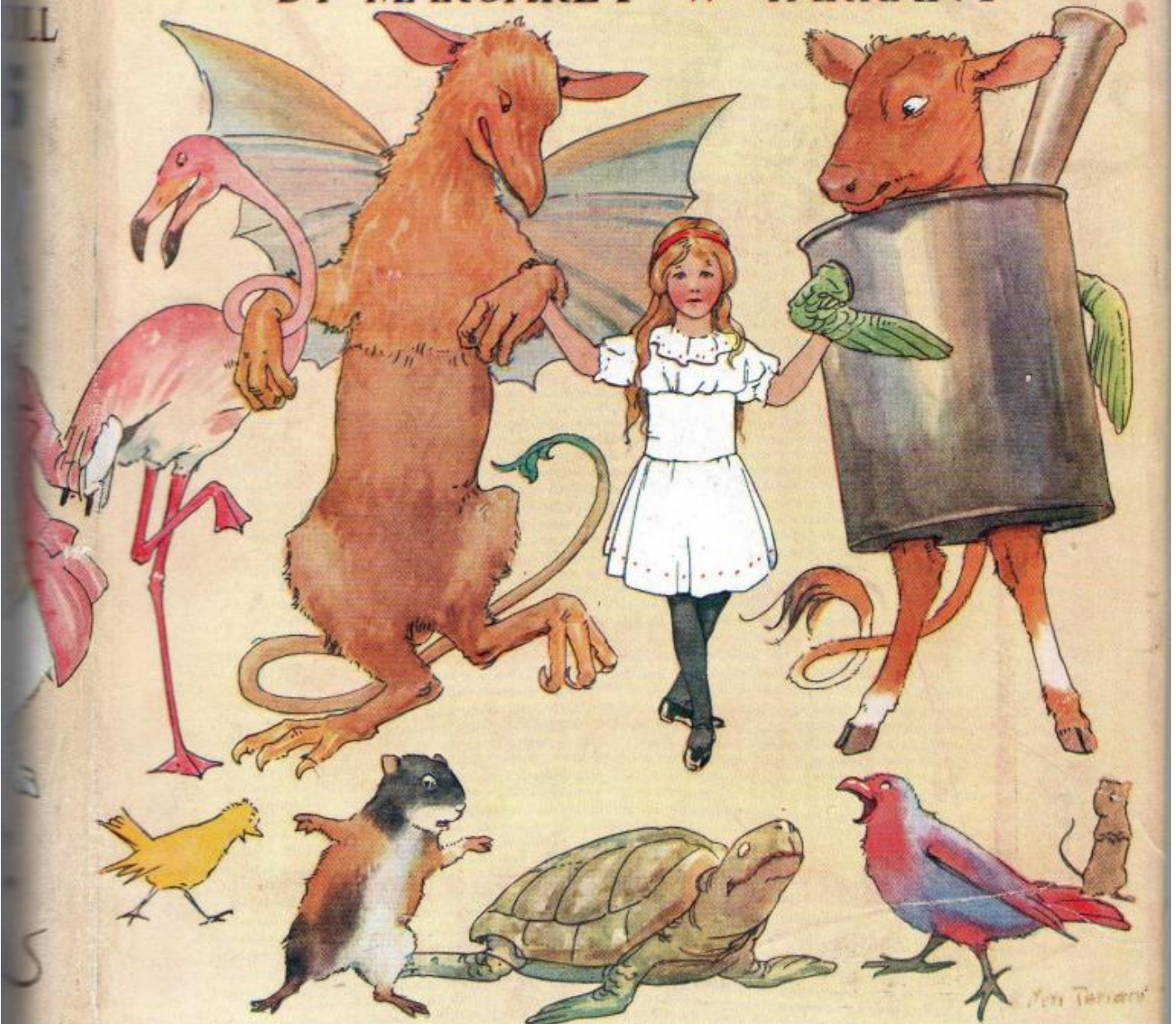
La copertina dell'edizione del 1916, illustrata da Margaret Tarrant.

WITH · 48 · COLOURED · PLATES BY · MARGARET · W · TARRANT