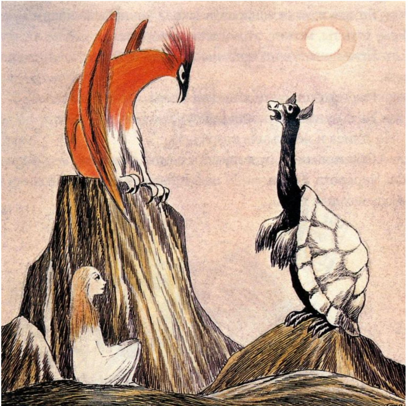
Tove Jansson (1959).

Segnaliamo infine una bella illustrazione di Tove Jansson, celeberrima creatrice dei Moomin , che nel 1959 la ritrae con un collo da giraffa, e un'inattesa incursione nel mondo dei supereroi, all'interno della serie antologica Astro City di Kurt Busiek, Brent Eric Anderson e Alex Ross, che nel 1999 ospita un pittoresco supercriminale chiamato appunto Mock Turtle.