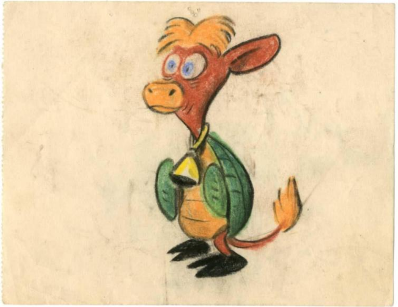
Bozzetto di Bill Peet.