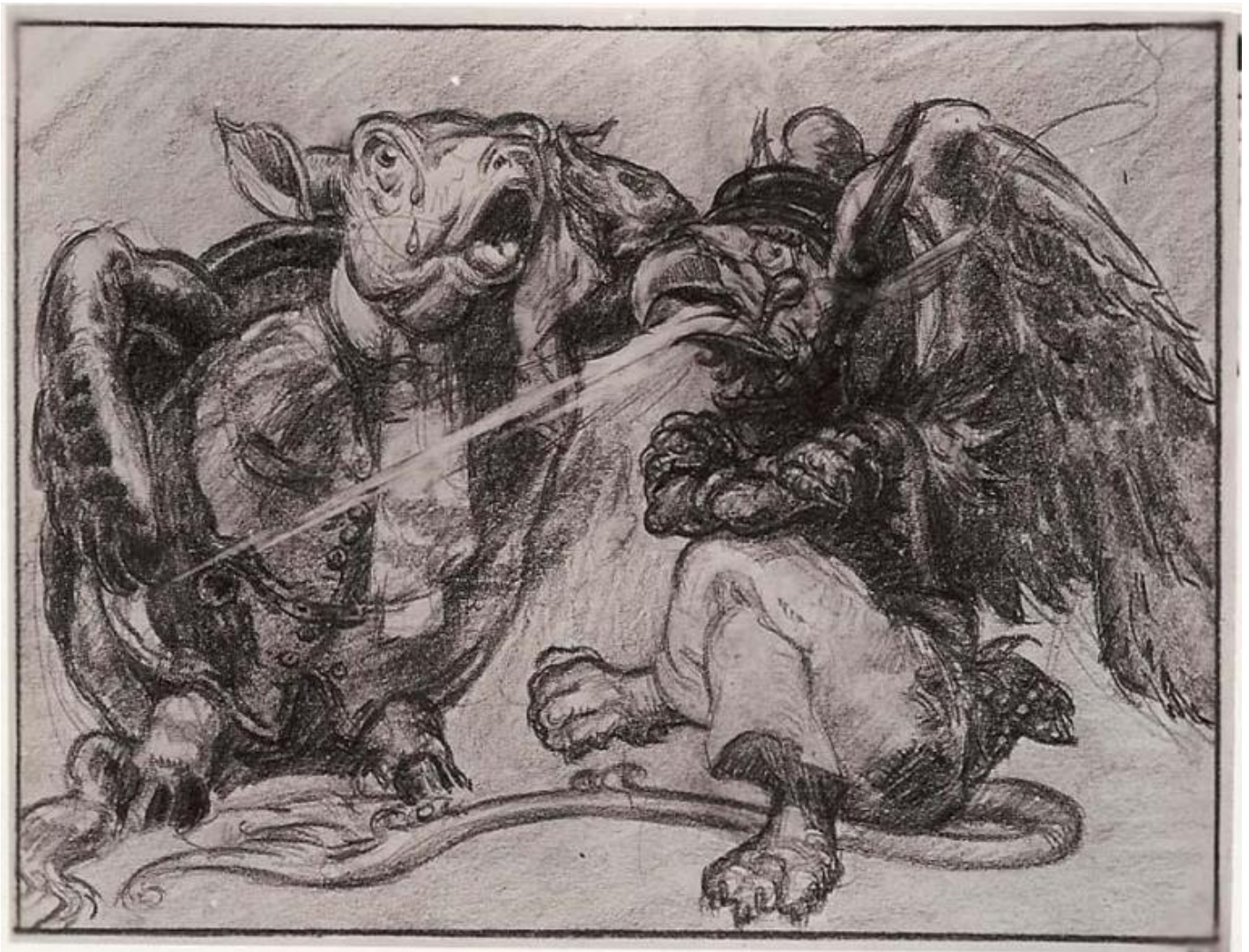
La Finta Tartaruga e il Grifone disegnati da David Hall.

La Disney utilizzerà comunque il personaggio, con due diversi character design ad altezza di bambino, in uno spot televisivo del 1956 che pubblicizza il dolce Jell-O e, una ventina d'anni più tardi, in un fumetto sulla rivista Disneyland Magazine . In quest'ultima avventura, la creatura trova una nuova ragione di vita innaffiando i fiori della Regina di Cuori con le sue lacrime, una volta tanto provvidenziali.