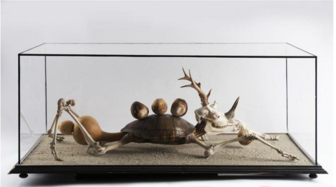
Modello della Finta Tartaruga realizzato da Jan Švankmajer (1988).

Nel nuovo millennio la Finta Tartaruga dirada le apparizioni. Tuttavia, se nel deludente Alice in Wonderland (2010) di Tim Burton fa solo un cameo in un quadro appeso alla parete, trova un inatteso picco di popolarità in un videogioco della Electronic Arts, Alice Madness (2000) e nel suo seguito Alice Madness Returns (2011), in cui è uno dei personaggi secondari che affidano alla protagonista missioni da compiere. Mentre nel primo gioco il look segaligno del personaggio, simile a un minotauro col guscio, non è troppo convincente, undici anni dopo, grazie a un ottimo restyling , troviamo un'eccellente tartaruga, corpulenta e macrocefala, con tanto di occhi malinconici, pipa e feluca da ammiraglio.