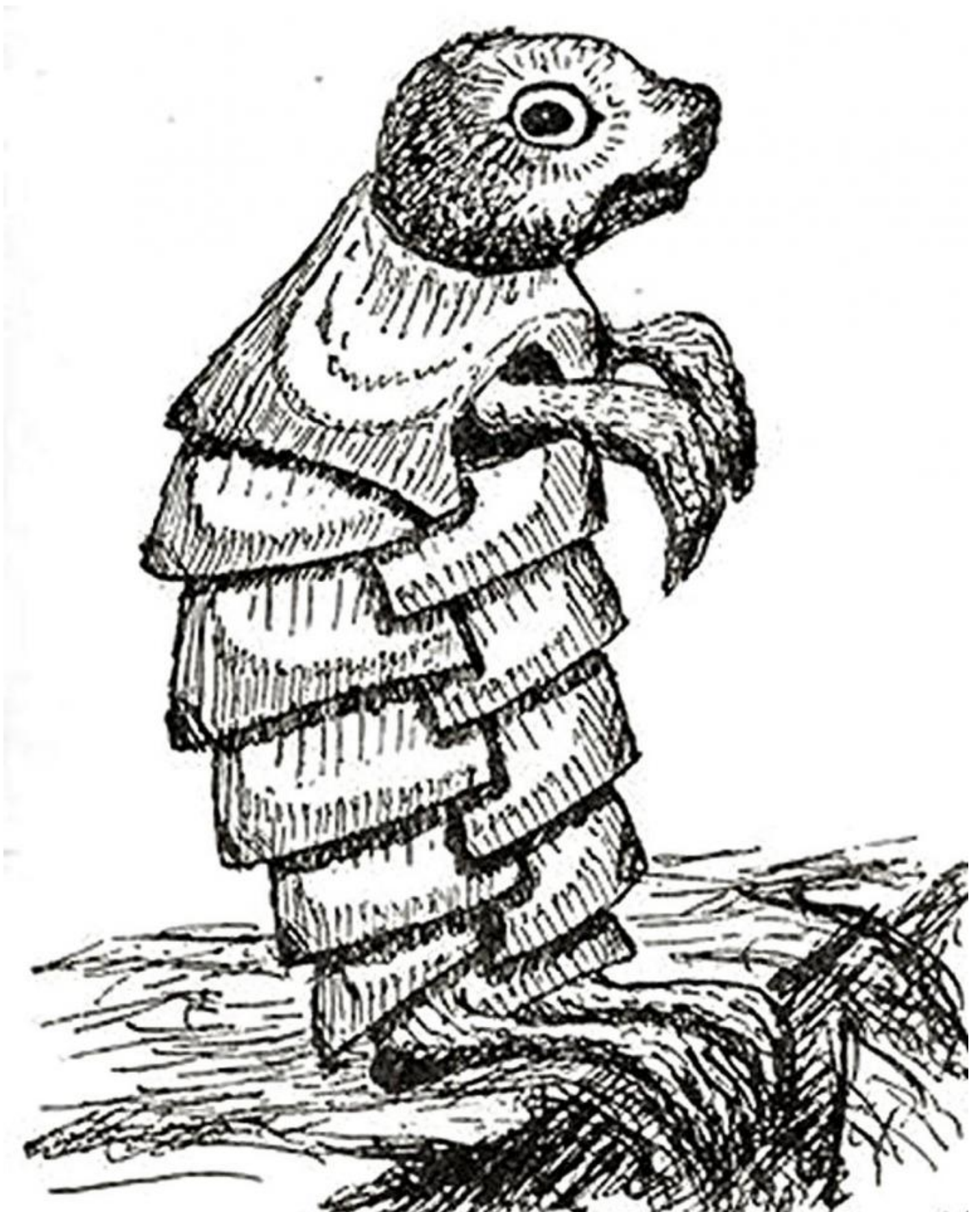
La Finta Tartaruga nei bozzetti di Carroll (1864).