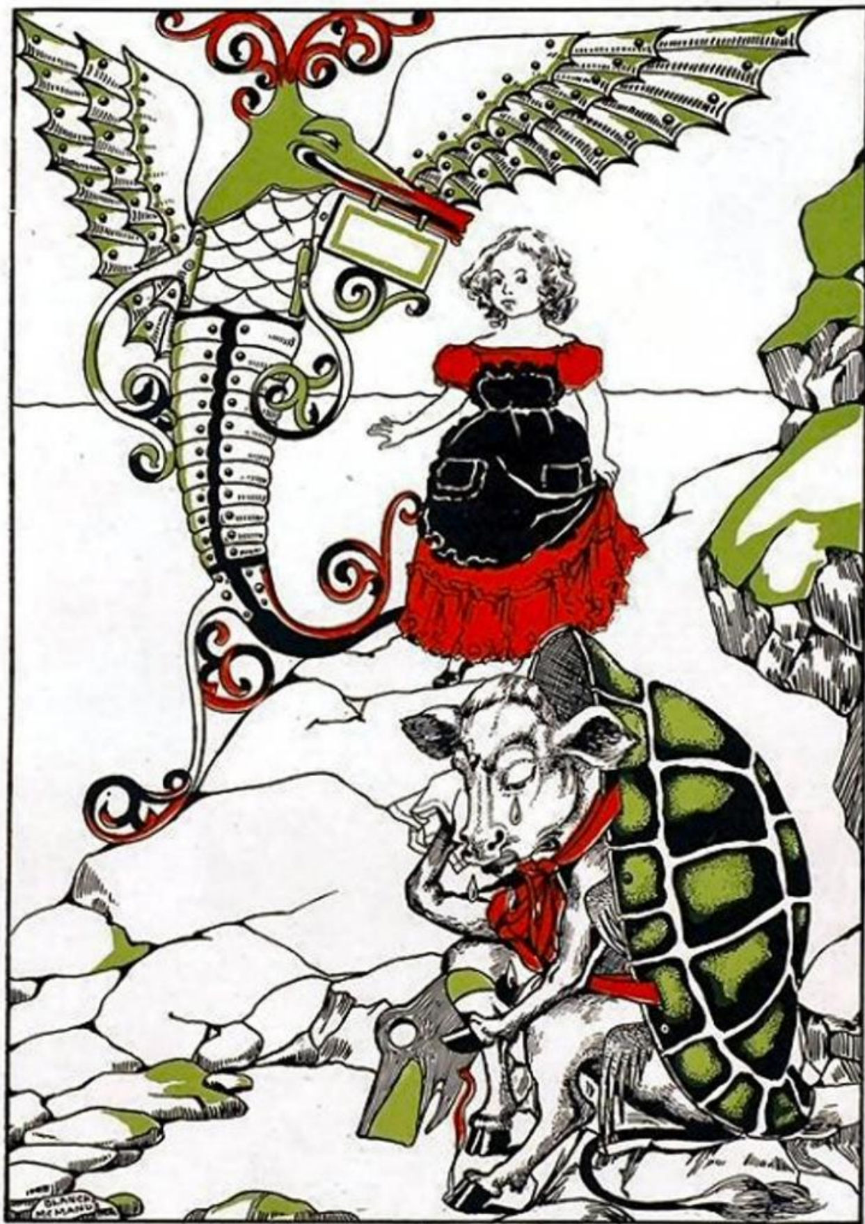
La Finta Tartaruga di Blanche McManus (1899).