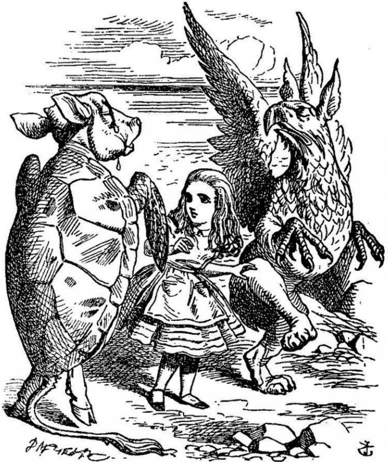
Alice e il Grifone incontrano la Finta Tartaruga. Illustrazione di John Tenniel (1865).

Agli occhi del lettore contemporaneo il personaggio appare piuttosto astratto e fumoso. A cominciare dal nome, basato su un gioco di parole ormai datato, oltre che intraducibile. La “finta zuppa di tartaruga” ( mock turtle soup ) era infatti un celebre piatto dell’Età Vittoriana, una variante a base di frattaglie di vitello della ben più pregiata zuppa di tartaruga verde: Carroll gioca quindi sulla posizione dell’aggettivo mock (finto, falso), che può riferirsi tanto alla zuppa quanto alla tartaruga stessa. Il carattere del personaggio, invece, con