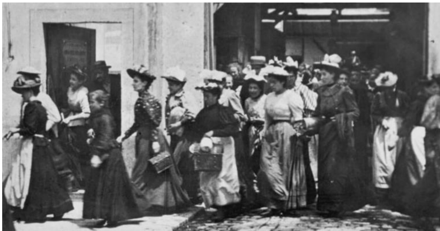
“La Sortie de l'usine Lumière” (1895).

Il libro si dipana attorno a tre nuclei tematici – tempo, media e immagine – con numerosi esempi tratti da un'ampia cultura del visuale, in particolare dei media e dell'immagine in movimento: fra i casi citati troviamo Harun Farocki, Hito Steyerl, Cao Fei, Ed Atkins, Liam Gillick, Superflex, Forensic Architecture, Alterazioni Video, Elisa Giardina Papa, ma anche Francois Truffaut, Ermanno Olmi e Pier Paolo Pasolini, Black Mirror e BoJack Horseman . Estremo analizza tanto la rappresentazione del lavoro quanto le logiche che presiedono al funzionamento degli apparati e dei protocolli che trasformano “la classe creativa in cognitariato”.