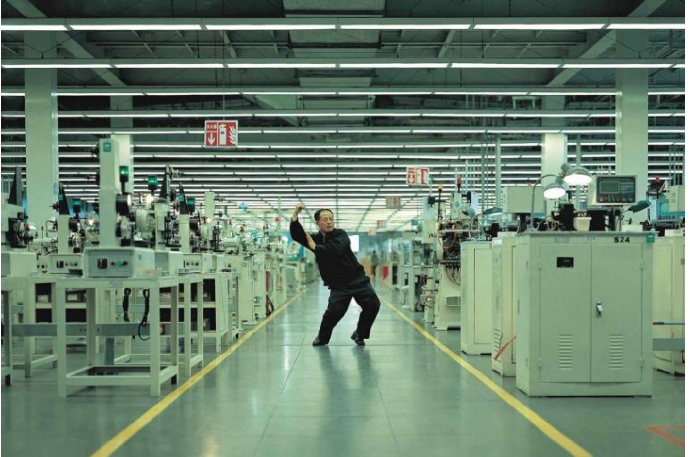
Cao Fei, “Whose Utopia” (2006).

La prima immagine su cui si sofferma è La Sortie de l'usine Lumière , l'uscita degli operai dalla fabbrica Lumière di Lione, atto di nascita del cinematografo ma anche prima mise en scène della storia del cinema: le riprese infatti sarebbero state effettuate di domenica, cosa che spiega l'abbigliamento degli operai. La scena è la principale fonte di ispirazione per Arbeiter verlassen die Fabrik (1995) in cui Harun Farocki, a distanza di cento anni, mostra il lavoro non solo come un fatto economico ma anche “as the very condition of what it means to remain human” (Elsaesser, 2004) ed esplora l'incontro tra una tecnologia e un luogo – il cinema e la fabbrica – (Farinotti, 2017) a cui offre una nuova cornice, quella del museo, in cui per Estremo sembra compiersi il processo di completa smaterializzazione del lavoro e dell'esistenza.