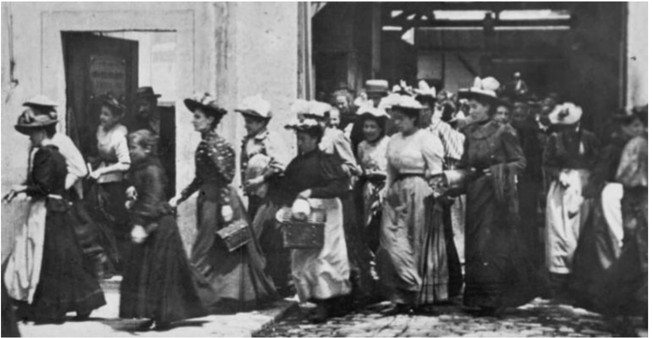
“La Sortie de l'usine Lumière” (1895).

La prima immagine su cui si sofferma è La Sortie de l'usine Lumière , l'uscita degli operai dalla fabbrica Lumière di Lione, atto di nascita del cinematografo ma anche prima mise en scène della storia del cinema: le riprese infatti sarebbero state effettuate di domenica, cosa che spiega l'abbigliamento degli operai. La scena è la principale fonte di ispirazione per Arbeiter verlassen die Fabrik (1995) in cui Harun Farocki, a distanza di cento anni, mostra il lavoro non solo come un fatto economico ma anche “as the very condition of what it means to remain human” (Elsaesser, 2004) ed esplora l'incontro tra una tecnologia e un luogo - il cinema e la fabbrica - (Farinotti, 2017) a cui offre una nuova cornice, quella del museo, in cui per Estremo sembra compiersi il processo di completa smaterializzazione del lavoro e dell'esistenza.