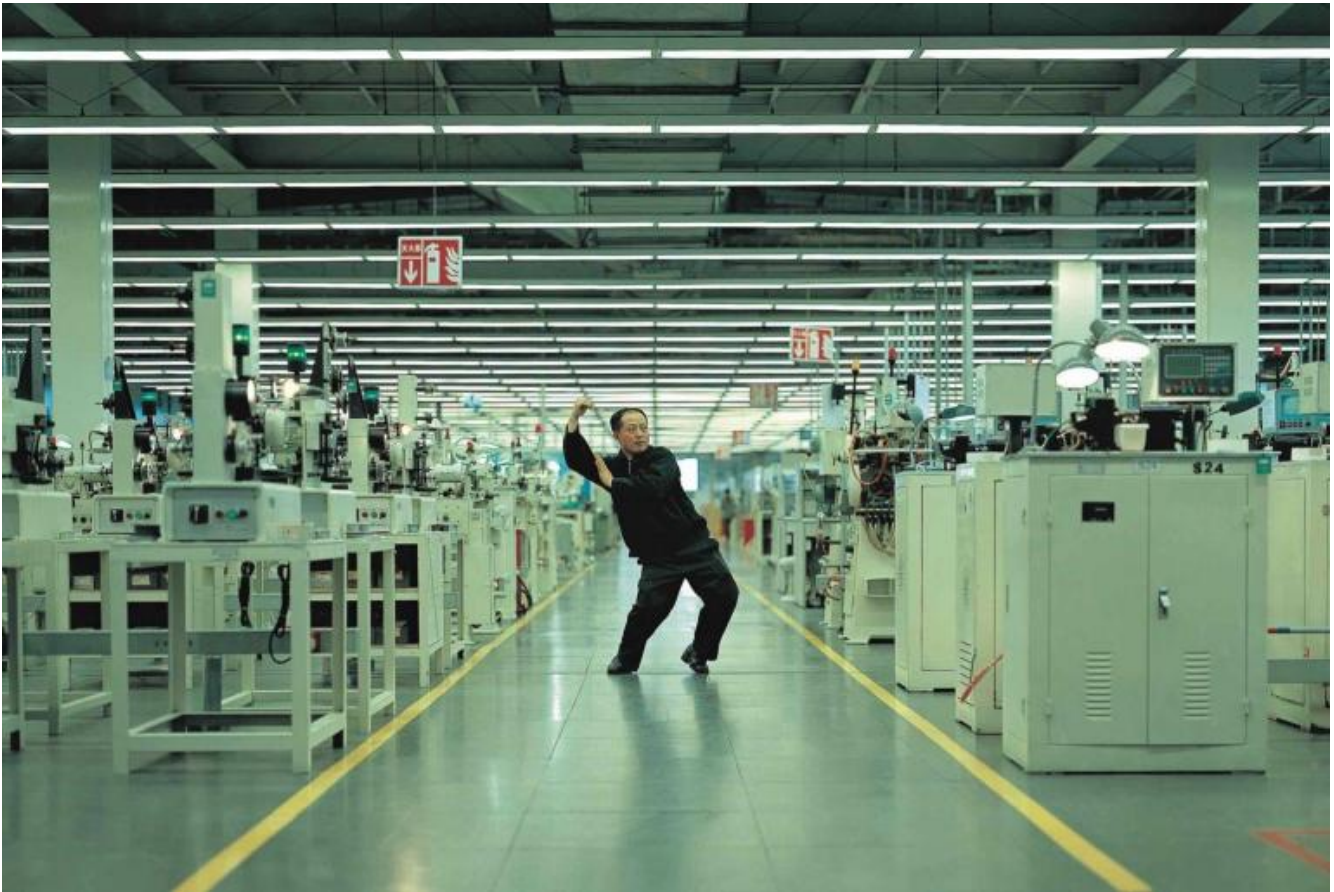
Cao Fei, "Whose Utopia" (2006).

Cattedrale dell' "economia estetica", lo spazio dell' arte necessita di nuove profanazioni: l' autore cita ad esempio Cao Fei che in Whose Utopia (2006) invita le operaie e gli operai della Osram (nei pressi di Hong Kong) a interrompere il ritmo della produzione impegnandosi in liberatorie pratiche coreutiche; mentre in The Working Life (2013) dei Superflex, l' ipnoterapeuta danese Tommy Rosenkilde interpella il pubblico, accompagnandolo nella presa di coscienza del nesso tra la sua fragilità psicologica ed esistenziale e la precarietà che contraddistingue il lavoro nello scenario neoliberale. Please, stop! Just sitting there, lazy, useless, unproductive... Così Rosenkilde esorta la nuova forza lavoro dello sguardo a forme di resistenza improduttive e anti-efficientiste in grado di inceppare la macchina della produzione immateriale. Un' interpellazione, questa, che richiama subito alla mente l' arringa iniziale del più consapevole ragionier Total in La proprietà non è più un furto (1973) di Elio Petri: