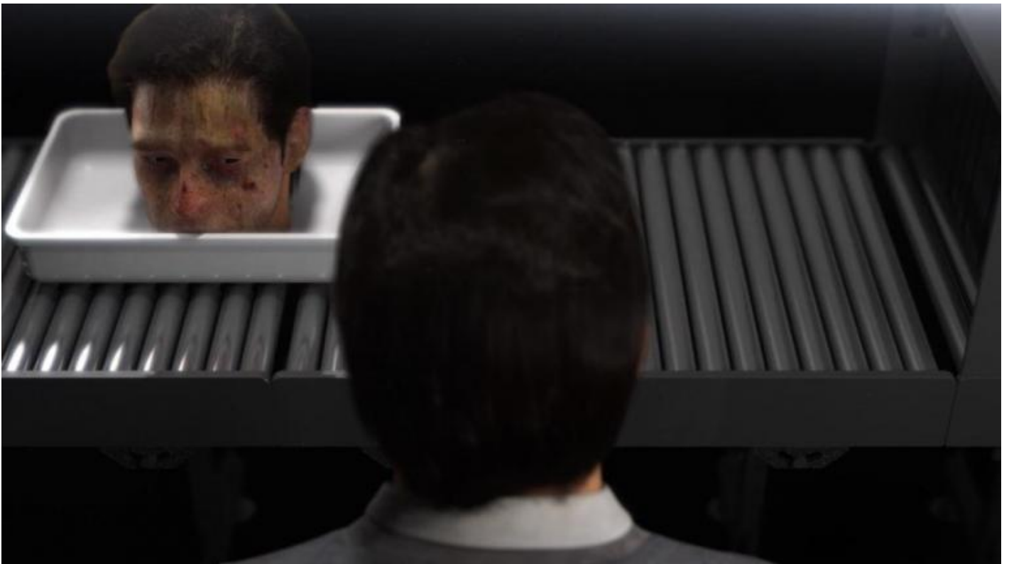
Ed Atkins, "Safe Conduct" (2016).

La messa a sistema delle energie creative delle lavoratrici e dei lavoratori si realizza in particolare nella colonizzazione del tempo libero e della sfera emotiva via social media, in cui l'etica del lavoro si riversa definitivamente trasformata in estetica dell'edonismo, in un circuito chiuso e continuo di ripetizione dell'identico e di strategie governamentali in grado di risucchiare la molle esistenza della classe creativa, come accade agli avatar di Ed Atkins .