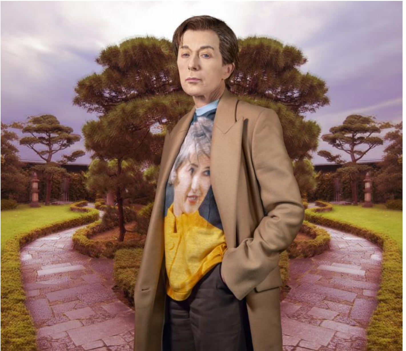
Cindy Sherman, Untitled 602, 2019.

L'opzione che io difendo non è quella di ridescrivere il mondo dal punto di vista delle donne: non saprei nemmeno dire quale sia questo punto di vista, ma, qualunque cosa sia, temo che non valorizzi le singolarità e non ho alcuna intenzione di sposarla [...] è la stessa categoria di «donna», in quanto presupposto, a richiedere una genealogia critica delle complesse risorse politiche e discorsive che, a loro volta, la costituiscono. (Judith Butler, ivi. )