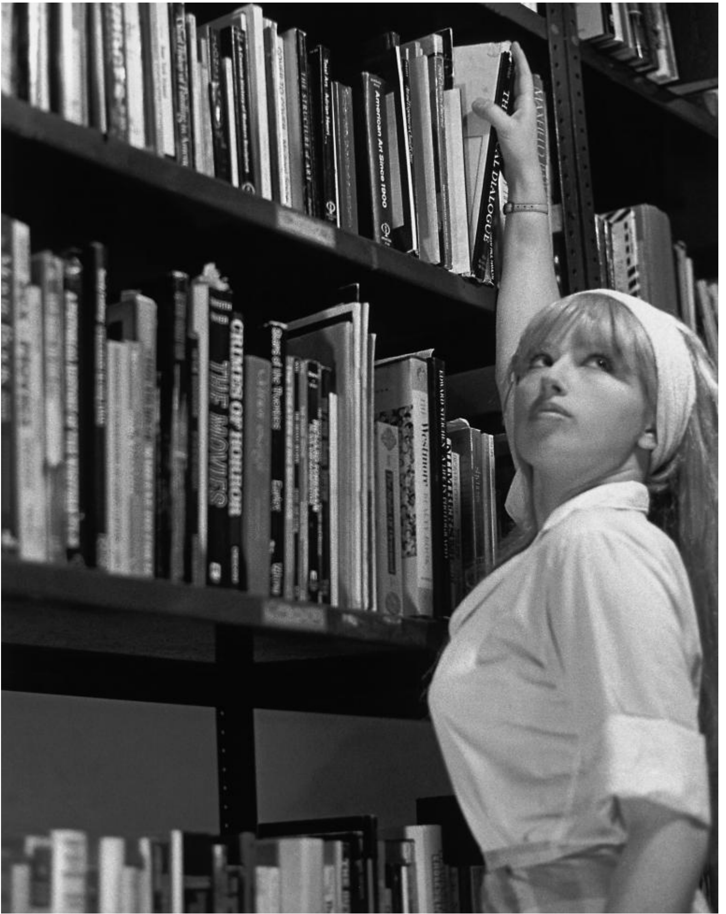
Cindy Sherman, Untitled Film Stills 84, 1978.