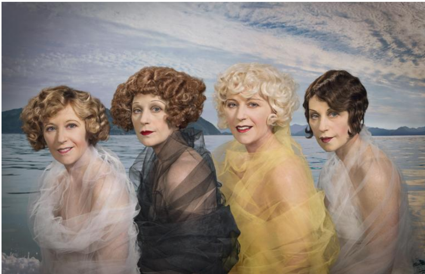
Cindy Sherman, Untitled 584, 2017-18.

Butler, “Atti performativi e costituzione di genere”)