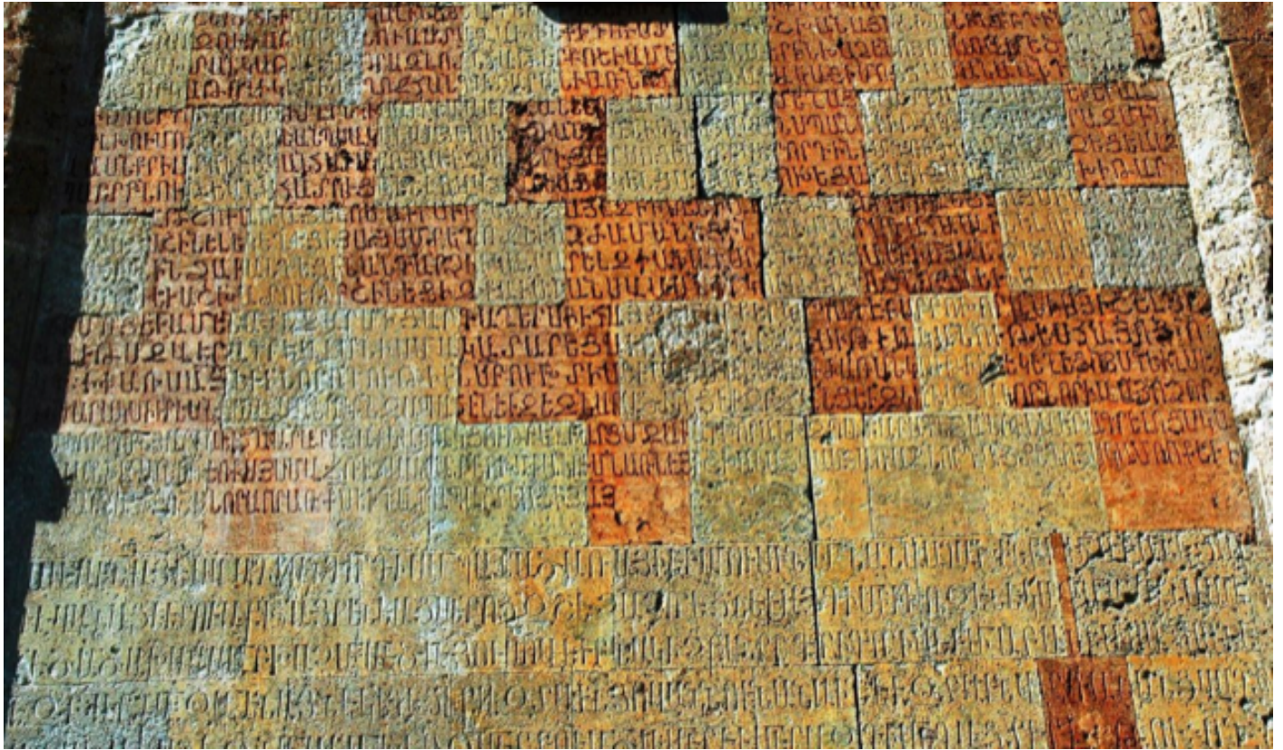
Davitank?, iscrizione murale.

Quando, verso la fine del decimo secolo, tribù turcomanne e turche cominciarono a penetrare nel Caucaso del sud, esse non vi incontrarono, secondo ogni verosimiglianza, abitanti che scrivessero ancora l'armeno. Gli scambi tra i turchi e gli armeni furono, invece, intensi, come testimoniano i prestiti armeni relativi alla religione, a diverse attività professionali e alla famiglia in azerbaigiano e in turco, per esempio torun (nipote), orinak ? örnek (esempio), xa ? ? haç (croce). Fu in ambienti urbani armeni che i turchi appresero anche le tecniche di costruzione.