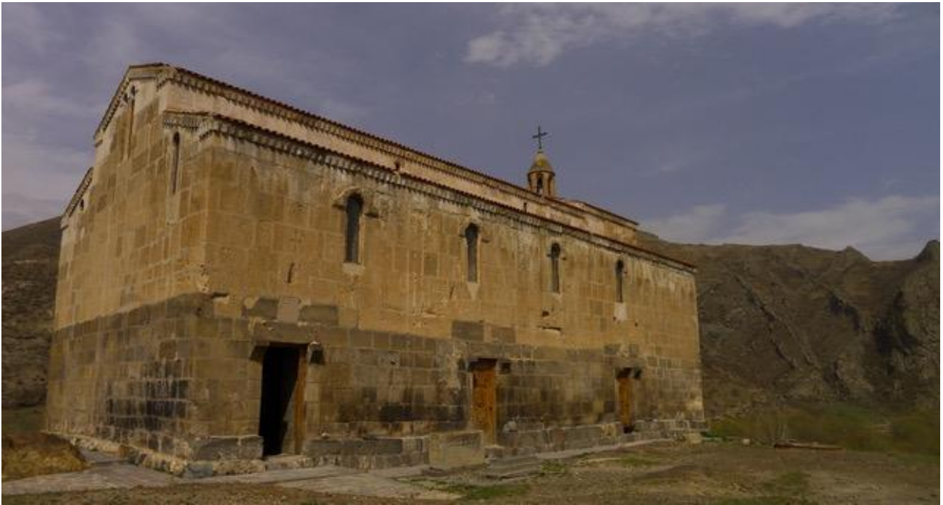
La chiesa di Ciceřnavank' (fondazioni dei secc. V-VI, basilica attuale dell'XI-XII secolo), Artsakh.

Durante il periodo trascorso sin dalla formazione dell'Unione sovietica all'inizio degli anni Venti del secolo scorso, le Repubbliche sovietiche avevano sviluppato tradizioni storiografiche idiosincratiche. Mentre l'Armenia e la Georgia rivaleggiavano tra loro, confrontando racconti concorrenti che risalivano all'inizio del primo millennio prima della nostra era, il loro vicino Azerbaigian, che era un'entità politica recente e portava addirittura un nome che prima del 1917 aveva designato soltanto il territorio a sud del fiume Arasse (cioè, oltre i confini sovietici), si sforzò di elaborare, mimeticamente, una storiografia autoctona che identificava come suo antenato diretto l'Albania del Caucaso. Questa teoria fu sviluppata nelle numerose pubblicazioni di Ziya Bunyatov (1923-1997), riconosciuto come padre della storiografia azerbaigiana, e, più recentemente, di Farida Mamedova. Questa teoria dotava gli azerbaigiani di un'identità autoctona antica, seppure cristiana. Diversi storici russi e occidentali hanno dimostrato a più riprese che Bunyatov falsificava sistematicamente le sue citazioni e le sue traduzioni.