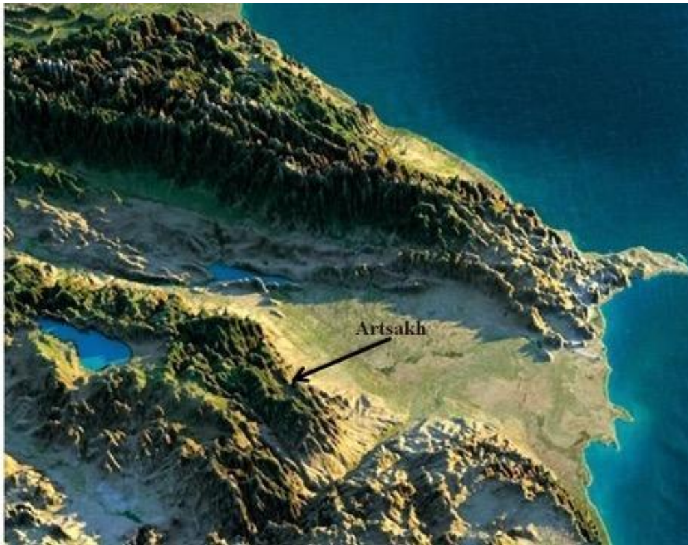
Mappa della regione.

Se osserviamo la mappa del Caucaso del sud – il territorio che si stende a sud della catena del Grande Caucaso tra il mar Nero e il mar Caspio – notiamo un netto confine geografico che divide l'ultima propaggine orientale del Piccolo Caucaso, la quale scende ripidamente verso il fiume Kur, e le pianure che si estendono a est fino alla costa caspiana. L'antica regione armena di Artsakh (l'estremità orientale dell'Armenia storica) occupa proprio quei monti che sovrastano la valle del Kur, l'antica frontiera con l'Albania del Caucaso. Il territorio di questo antico regno cristiano – da non confondere con l'Albania nei Balcani – coincideva in gran parte con quello dell'attuale Azerbaigian, in particolare con le pianure della riva sinistra del fiume Kur, estendendosi fino al litorale del Daghestan meridionale. La popolazione di questo regno aveva origini eterogenee e fino all'alto Medioevo parlava diverse lingue caucasiche del Nordest e iraniane.