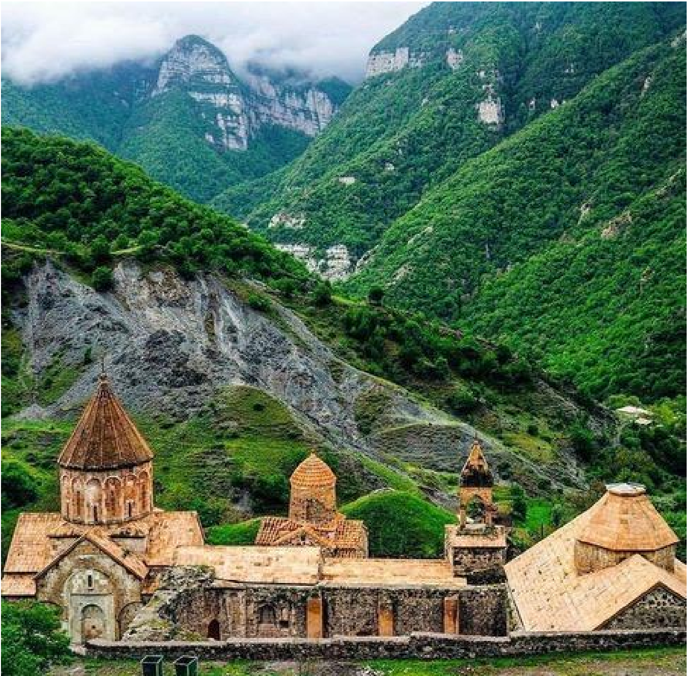
Monastero di S. Taddeo, o Dadivank? (seconda metà del XII-XIII secolo), Artsakh.

Contrariamente all'Armenia montagnosa, caratterizzata da un terreno accidentato, l'Albania del Caucaso, geograficamente facilmente accessibile e percorribile, fu largamente islamizzata dagli arabi già prima della fine dell'VIII secolo. Di conseguenza, la lingua albanese gradualmente svanì, mentre l'armeno diveniva la lingua dominante di tutte le popolazioni cristiane che rimanevano ancora sull'antico territorio dell'Albania, fossero esse di origine armena, albanese o altre, caucasiche o iraniane. Con la dominazione islamica sul mondo delle pianure che si stendono a oriente del Piccolo Caucaso, le inaccessibili gole dell'Artsakh divennero rifugio per cristiani di varie origini.