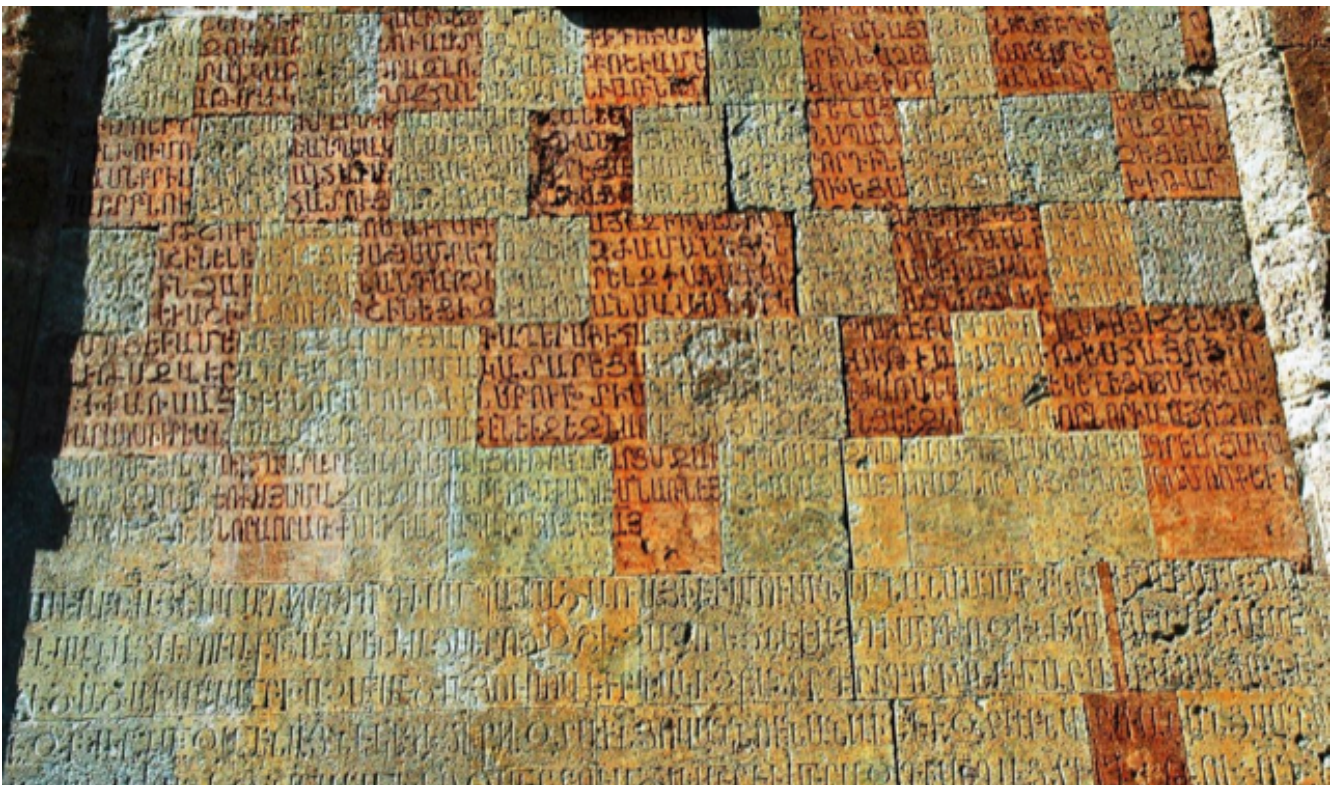
Dadivank', iscrizione murale.

Quando, verso la fine del decimo secolo, tribù turcomanne e turche cominciarono a penetrare nel Caucaso del sud, esse non vi incontrarono, secondo ogni verosimiglianza, abitanti che scrivessero ancora l'albanese. Gli scambi tra i turchi e gli armeni furono, invece, intensi, come testimoniano i prestiti armeni relativi alla religione, a diverse attività professionali e alla famiglia in azerbaigiano e in turco, per esempio torən → torun (nipote), orinak → örnek (esempio), xač → haç (croce). Fu in ambienti urbani armeni che i turchi appresero anche le tecniche di costruzione.