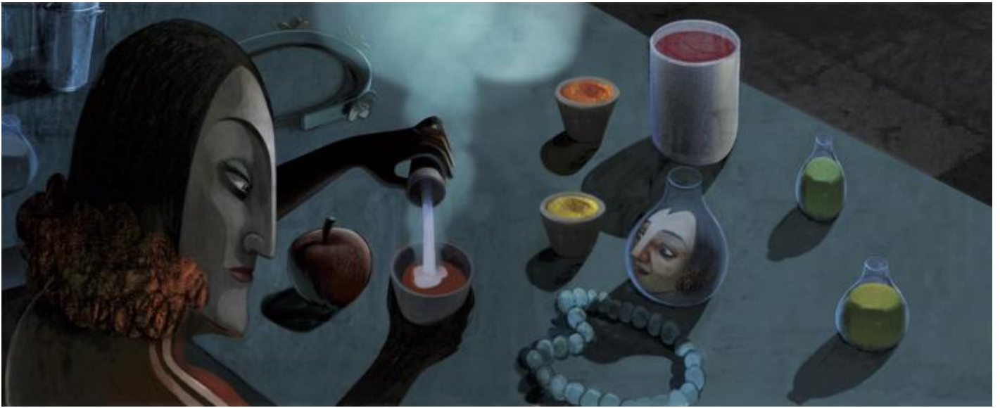
La regina malvagia prepara il veleno per uccidere Biancaneve.