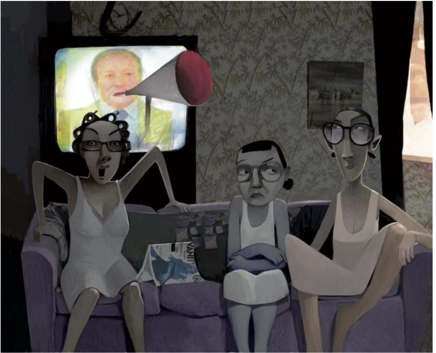
La matrigna e le sorellastre di Cenerentola.

La lingua, essenziale, accesa da inflessioni e locuzioni dialettali, fa da smagliante contrappunto alle immagini, ariose quando vengono scontornate nella pagina bianca, affogate nei chiaroscuri, nelle ombreggiature espressiviste quando si concentrano sui personaggi negativi, o quando esplorano i segreti e le paure della notte. Non mancano trovate umoristiche irresistibili, spesso debitorie al teatro popolare, come nei casi dei sette barbuti nani senza gambe, con Eolo che ‘pirita’, scoreggia, in continuazione, Pisolo che si addormenta ogni 5 minuti, Cucciolo in cerca delle mammelle della mamma eccetera.