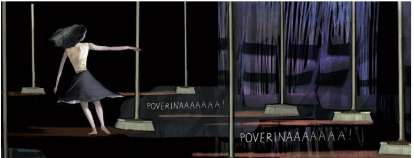
Il ballo con le scope da Anastasia, Genoveffa e Biancaneve.

È una bambina trascurata la Cappuccetto grassa, con un'identità incerta, continuamente esplicitata da sdoppiamenti e moltiplicazioni in tante altre Cappuccetto. E però è una che sa quello che vuole e lo raggiunge travolgendo gli ostacoli. Donne in cerca di identità, di felicità, sono queste, in un mondo non attrezzato, di proibizioni (Cappuccetto), invidie e maledizioni (Rosaspina), odi per l'ingenua bellezza della gioventù degli adulti che vedono sfuggire, nonostante sedute dall'estetista e jogging forsennati, il tempo (Biancaneve), soprusi di chi ha il potere, le orribili sorellastre di Cenerentola, donne avvelenate a loro volta dalla prosopopea e dall'avidità voglia di promozione sociale materna, in camicia da notte, 'villane' rifatte senza grazia. Una grazia che alla fine vince, determinata o inconsapevole, contro tutto .