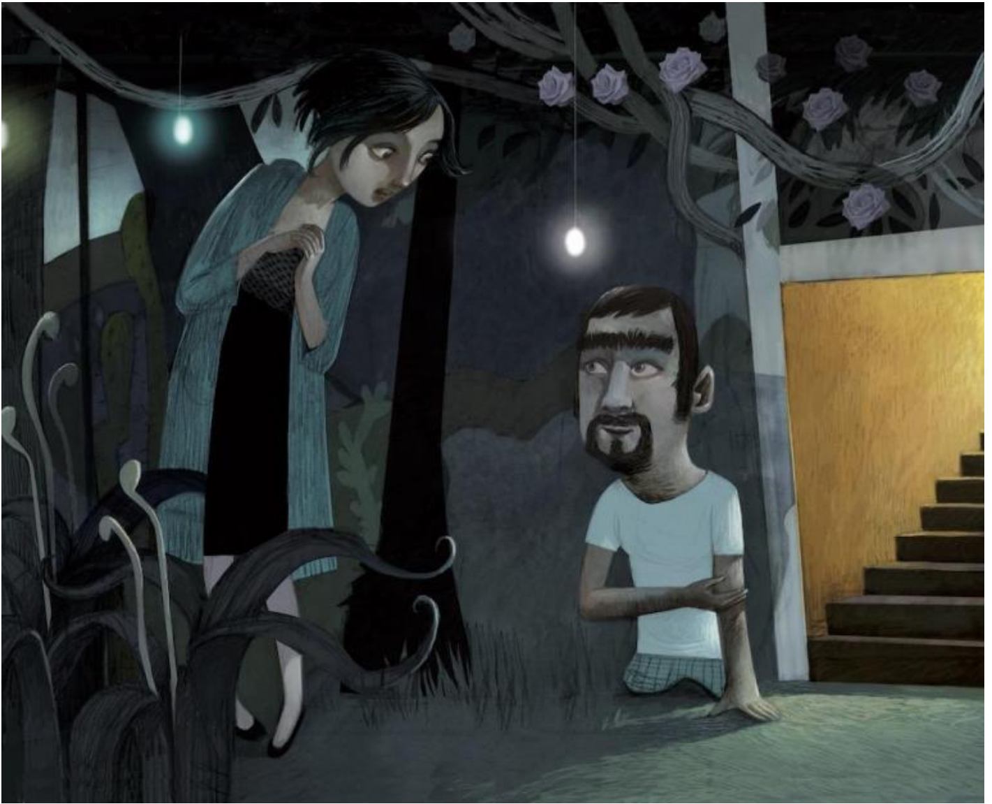
Biancaneve e Gongolo, da Gli alti e i bassi di Biancaneve.

Ora questi racconti crudeli e ironici, dolci e ghignanti, dal teatro vengono trasportati in un bel libro, E tutte vissero felici e contente (La nave di Teseo). Sulla pagina non perdono la forza epigrammatica dei contrasti fisici e della deformazione grottesca del teatro della regista palermitana, ma acquistano in più una smagliante traduzione visiva a opera di Maria Cristina Costa, disegnatrice di lunga navigazione, dal segno spigoloso, espressionista, dal colore spesso opaco, una matita e delle tonalità capaci di rendere la dimensione di incubo che spesso hanno gli interni familiari di Emma Dante. Le due, coetanee, collaborano dal 2011 e il loro rapporto sembra simbiotico, tanto che alcune immagini che illustrano il volume paiono richiamare i tagli di colore, di luce scura, di penombra, gli enigmi esistenziali resi per saturazione o raffreddamento delle immagini del recente film Le sorelle Macaluso ; e viceversa, immagini della fortunata e intensa pellicola paiono ispirarsi alle donne e alle ragazze di questa raccolta di conti di fantasia.