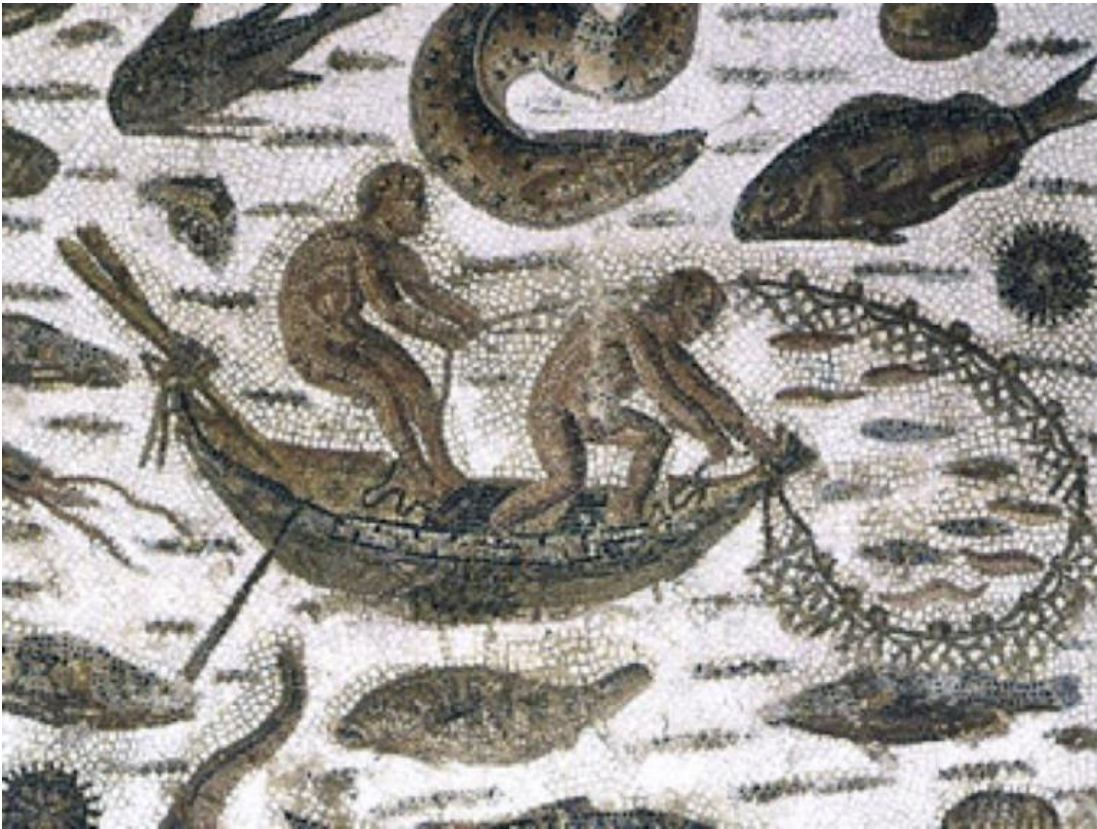
Mosaico romano III sec. D.C. (part.) Museo Archeologico di Susa in Tunisia.

La riflessione di Mauro Ceruti, “Un groviglio inestricabile”, con cui si chiude Sospeso respiro , ci offre una chiave possibile per afferrare il senso delle quattro sillogi poetiche commentate da Vitali. Scrive Ceruti che era stato il filosofo israeliano Yehuda Elkana a suggerirgli che “i generi della tragedia e dell’epica ci aiutano a comprendere i due atteggiamenti che si confrontano di fronte alle sfide” che la storia pone alla conoscenza e all’agire degli uomini. “L’atteggiamento tragico considera la storia come il manifestarsi dell’inevitabile... L’atteggiamento epico considera invece che ciò che è accaduto avrebbe potuto andare diversamente”.