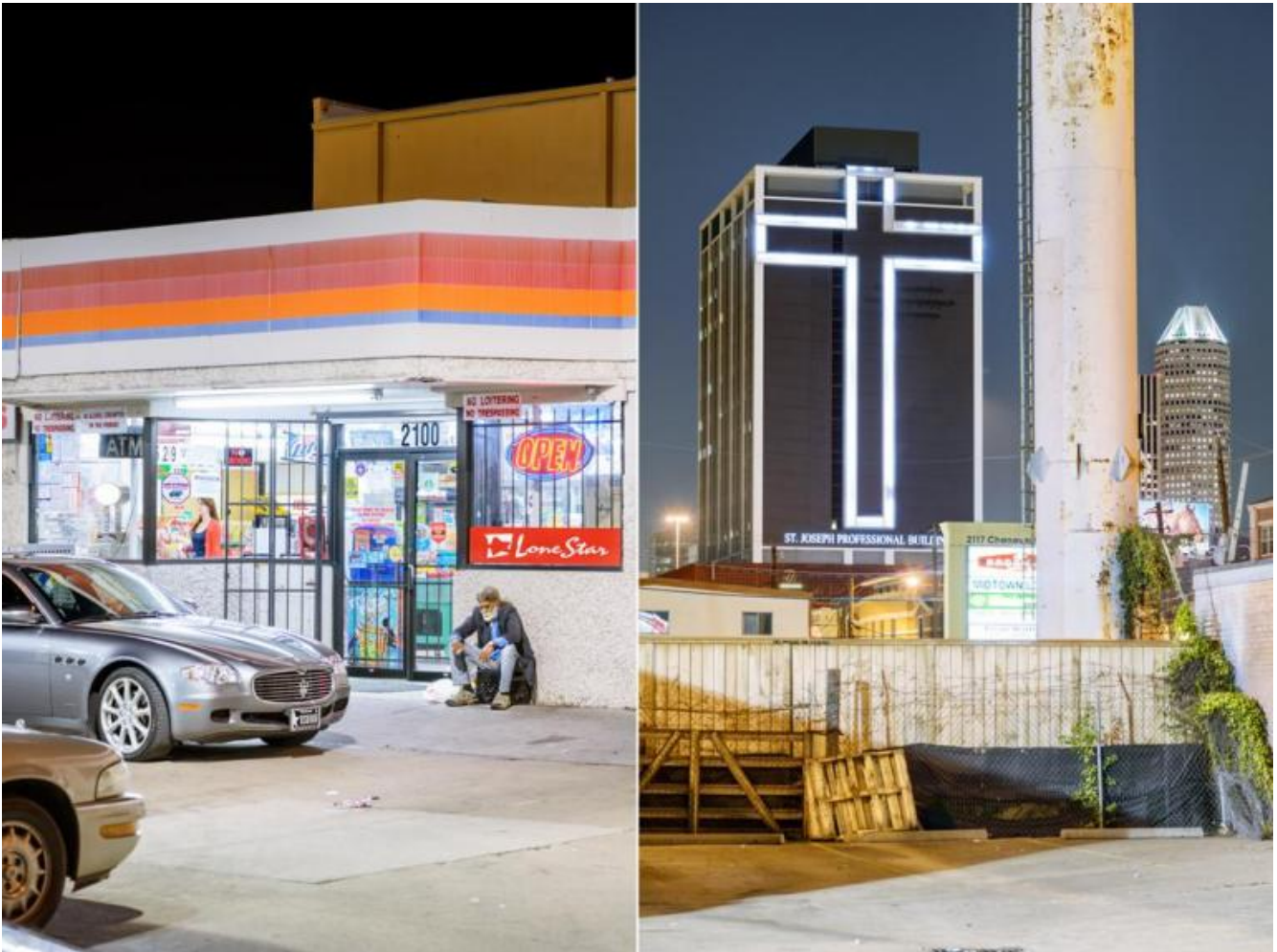
Olivo Barbieri, Houston, TX, USA 2012.

Qui sta forse il punto cruciale di un tentativo di lettura dell'immaginario contemporaneo e della sua criticità, nel momento in cui si compie lo sganciamento dal simbolico e dalla sua funzione di connessione tra realtà e immaginazione. Così come "la parola scritta si presenta sotto un duplice volto: strumento di potere e strumento d'informazione", secondo l'analisi di Italo Calvino nel saggio "I Promessi Sposi: il romanzo dei rapporti di forza" , [I. Calvino, Una pietra sopra. Discorsi di letteratura e società , Oscar Mondadori, Milano 1995], alla stessa maniera l'infosfera si presenta come una semiosi incontenibile, in grado perciò di creare una costante tensione e di tenere sospesi verso mete irraggiungibili, che sono soprattutto contabili e di consumo.